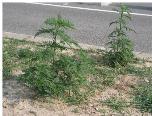
Slika 3. Ambrozija uz rub ceste (Foto: Z. Ostojić, lipanj, 2006). Figure 3. Common ragweed along the roadside (Photo: Z. Ostojić, June, 2006).