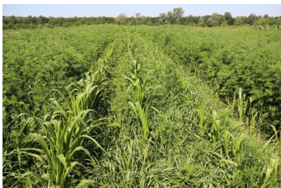
Slika 2. Usjev kukuruza zakorovljen ambrozijom na lokaciji Kloštar Ivanić. Figure 2. Common ragweed in maize field at location Kloštar Ivanić.

Na području kontinentalne Hrvatske ambrozija je široko rasprostranjena u okopavinskim usjevima (Slika 2.) i ruderalnim površinama (Slika 3.). Zanimljivo je stoga usporediti morfološku svojstva sjemena na različitim lokacijama kao polazište za daljnja istraživanja i bolje poznavanje ove vrste i njenoj prilagodbi u ovom geografskom području.