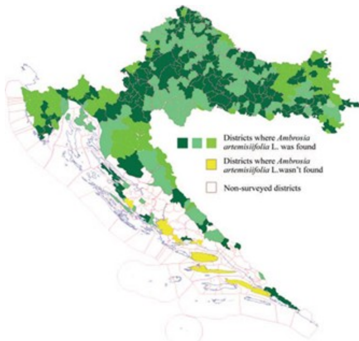
Slika 1. Rasprostranjenost ambrozije u Hrvatskoj od 2004. do 2006. godine.

Figure 1. Distribution of common ragweed in Croatia from 2004 to 2006.