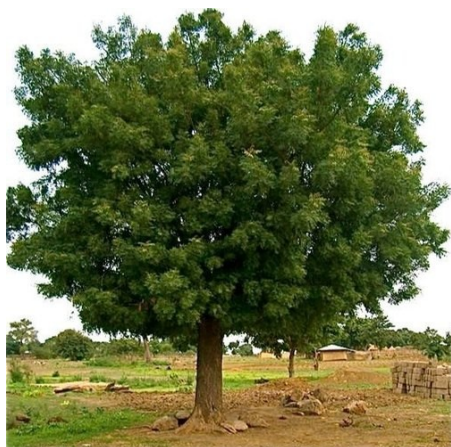
Slika 6. Drvo indijskog jorgovana (neem-a)

neema je azadiraktin, složena kemikalija sačinjena od preko 25 različitih, ali usko povezanih spojeva koji djeluje kao repelentno sredstvo jer odbijaju kukce od ishrane, a djeluje i kao regulator rasta (Gahukar, 1995). Svojstva azadiraktina koja djeluju kao regulatori rasta utječu na hormon edikson, odnosno snižavaju njegovu razinu u tijelu kukca što onemogućava završetak razvoja kukca. Posebno je djelotvoran na ličinačke stadije jer nezrele ličinke uslijed niske razine hormona ediksona ne mogu završiti razvoj i ugibaju. Smrtnost odraslih uzrokovana djelovanjem azadiraktina je niska, no češće su deformacije u vidu nerazvijenih krila i slično. Osim toga, azadiraktin ometa spolnu komunikaciju i parenje. Spoj azadiraktin je djelotvoran na oko 200 vrsta kukaca, grinja i nematoda. Upotrebljava se za zaštitu biljaka u vegetaciji i suzbija populacije cvjetnog štitastog moljca, tripsa, gusjenica leptira te brojnih drugih štetnih kukaca. Aktivna tvar azadiraktin razgrađuje se u vodi ili na svjetlu oko 100 sati. Dosta je nepokretan u tlu (Gahukar, 1995). Niti jedno sredstvo na bazi djelatne tvari azadiraktina nema dozvolu za suzbijanje štetnika u Hrvatskoj u 2021. godini (FIS, 2021).