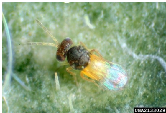
Slika 3. Ženka parazitoidne osice Encarsia formosa (Izvor: Cappaert, 2015).

U populaciji ovih osica vlada spolni dimorfizam. Ženke su brojnije i učestalije, crne su boje sa žutim zatkom i dužine oko 0,6 mm (Slika 3.). Mužjaci su malobrojni i crne su boje (Šimala et al., 2016).