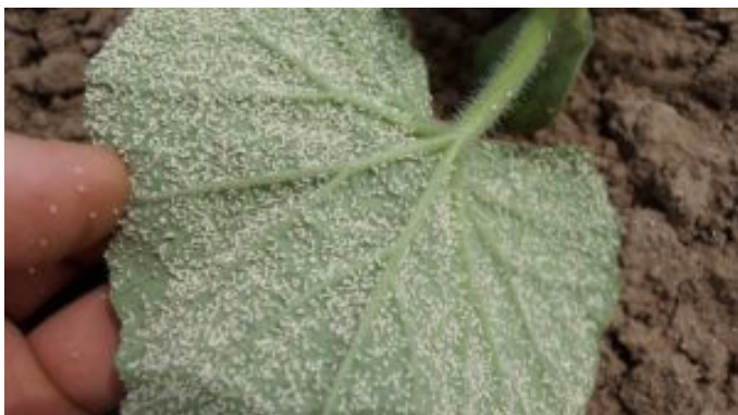
Slika 2. Cvjetni štitasti moljci na naličju lista dinje

Oštećenja koja nastaju kao rezultat ishrane cvjetnog štitastog moljca okarakterizirana su dvojako. Mogu biti nesistemična i sistemična izravna oštećenja. Nesistemična izravna oštećenja praćena su simptomima poput klorotične pjegavosti, žućenja, gubitka turgora i preranog odbacivanja jače napadnutih listova. Sistemična izravna oštećenja definirana su kao nepatogeni fiziološki poremećaji nastali kao posljedica ishrane i djelovanja toksičnih enzima injektiranih u biljku od strane ličinke. Djelovanje enzima očituje se na plodu rajčice koji nejednako dozrijeva. Posljedice takvog stanja biljke jest smanjen prinos i lošija kvaliteta ploda (Šimala et al., 2016).