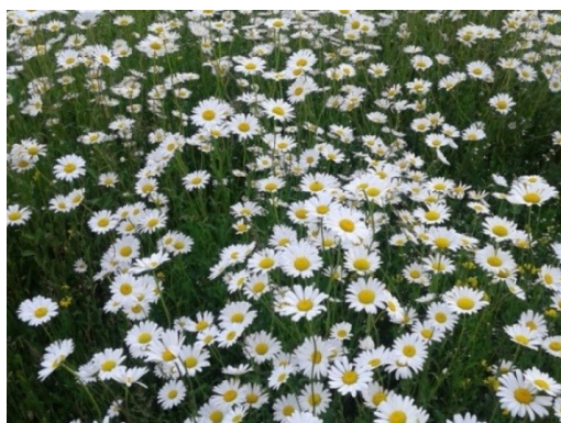
Slika 5. Dalmatinski buhač. Figure 5. Pyrethrum.

U Republici Hrvatskoj prema FIS-u (2021), na bazi piretrina registrirana su sredstva namijenjena suzbijanju zelene breskvine uši na breskvi, nektarini, marelici, šljivi, trešnji; američkog cvrčka na vinovoj lozi; cvjetnog i duhanovog štitastog moljca na lubenici, tikvi, dinji, rajčici, patlidžanu, paprici, krastavcima, salati, špinatu i matovilcu.