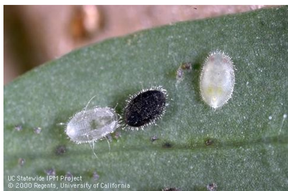
Slika 4. Parazitirana ličinka (kukuljica) cvjetnog štitastog moljca (crne boje).

Odrasle osice najčešće parazitiraju na ličinkama 1. i 2. razvojnog stadija cvjetnog štitastog moljca hraneći se njihovim tjelesnim sadržajem. Hrane se još i mednom rosom. Jaja odlažu u ličinke 3. razvojnog stadija ili u kukuljicu koja je na početku razvoja (Roermund, 1995). Parazitirana kukuljica je crne boje (Slika 4.) zbog toga što se ličinka osice kukulji unutar kukuljice štitastog moljca (Gotlin Čuljak i Juran, 2016). Proces kukuljenja traje 10 dana (Šimala et al., 2016). Učinkovitost osice je nešto lošija na krastavcima i izraženije dlakavim sortama rajčice, jer zbog dlačica osica teže pronalazi moljca. Tijekom života može parazitirati oko 450 ličinki, no najčešće parazitira oko 250 ličinki. Neke ličinke ugibaju od samog uboda bez da su parazitirane (oko 30 za života osice), odnosno bez da je u njih odloženo jaje (Maceljski, 2002).