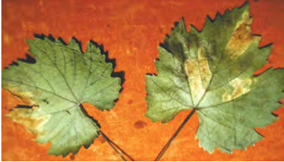
Slika 4. Trokutaste promjene boje na plojkama

P. tracheiphila napada listove i cvjetove. Najuočljiviji simptomi nastaju na listovima. U početku su pjege svijetložute. Boja pjege postupno se mijenja, ovisno o sorti. Na sortama s crvenim grožđem napadnute zone plojke poprimaju boju vina (slika 4). Na sortama s bijelim bobama pjege na plojci nešto su svjetlije nego u kultivara s obojenim bobama, od svijetložute do crvenkastosmeđe. Pjege, bez obzira na sortu, imaju trokutast oblik.