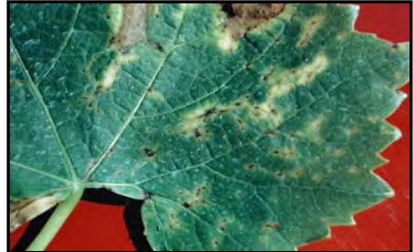
Slika 2. Pjegice na plojci