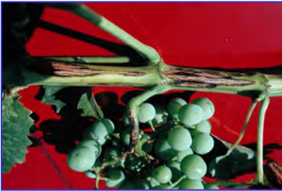
Slika 1. Simptomi na mladicama i peteljkovini

rozgvi mogu primijetiti mnogo drastičniji simptomi, koji se pojavljuju na najdonjim internodijima. Nekrotične pjegice produžena eliptična oblika prekrivaju veću ili manju površinu internodija. Dio kore s vremenom nekrotizira i ispucava. Pupovi na zaraženim lucnjevima ostaju uspavani, kasnije se otvaraju, a neki se i ne otvore. Štete se očituju u smanjenu urodu, a kompromitirana je i pravilna rezidba. Na mladicama su simptomi vidljivi do pred kraj vegetacije. Na zaraženim mladicama donji internodiji imaju tamnoplave do crne duguljaste lezije šiljate na krajevima. Unatoč zarazi, na mladicama se ne stvaraju piknidi dok mladice ne odrvene. Tijekom vegetacije sredina se lezije raspucava, pa središnji dio ima svijetlosmeđu boju (slika 1). Nekroza može obuhvatiti mladicu, i ona se prelomi pod težinom uroda ili naletom vjetera. Na plojci nastaju tamnosmeđe do crne pjegice, a okolno tkivo žuti (slika 2). Plojka na mjestu infekcije zaostaje u rastu, zbog čega se deformira. Kod jačih se napada list suši. Peteljka i peteljkovina grozda mogu biti zaražene, a simptomi se očituju nekrozama, pa dolazi do venuća i sušenja bobica i grozda. Na bobama nastaje blago ulegnuće pokožice. Gljivica može putem micelija ući u panj (deblo) i postupno izazvati truljenje (Kaliterna i sur., 2012.). Neki od spomenutih simptoma mogu izostati, jer unutar vrste postoje izolati koji ne parazitiraju peteljkovinu i bobice (Schilder i sur., 2005.).