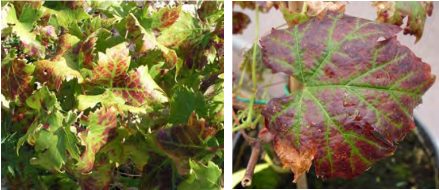
Slika 2. Početna (lijevo) i uznapredovala (desno) promjena boje lista te uvijanje ruba lisne plojke prema dolje kao posljedica zaraze virusima iz skupine uvijenosti lista vinove loze.

Osim zaraženim sadnim materijalom, virusi tipa 1 i 3 prenose se unutar istog ili susjednih vinograda velikim brojem različitih vrsta štitastih uši na semiperzistentan način, a vektori GLRaV-2, osim na zaraženu sadnom materijalu, nisu poznati. Zbog mogućnosti prijenosa s velikim brojem različitih vrsta štitastih uši potrebno je provoditi njihovo redovito praćenje, te po potrebi suzbijanje korištenjem odgovarajućih, za tu namjenu registriranih insekticida.