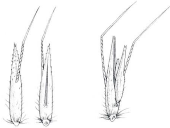
Slika 3. Pšeno divlje zobi ( Avena fatua )