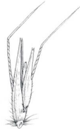
Slika 4. Pšeno Avena sterilis subsp. ludoviciana