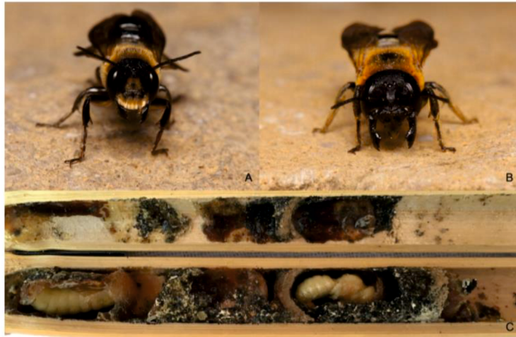
Slika 2. Spolni dimorfizam. A) mužjak, B) ženka, C) ličinke

često uočene kako se hrane na cvijeću japanskog bagrema ( Styphnolobium japonicum ) (Lanner i sur., 2020.; Lanner i Bila Dubaić, 2021.; Centar za biologiju pčela, 2021.).