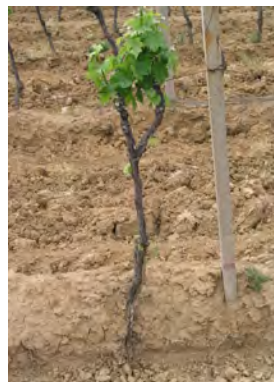
Slika 3. Primjer oštećenja korijena obradom tla

Osim neposredne koristi za okoliš, klimu i bioraznolikost, važne su i druge prednosti zatravljanja, kao što su: