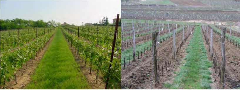
Slika 1. Primjer zatravljivanja međurednog prostora (lijevo) i zatravljivanja svakog drugog međurednog prostora

postiže zadovoljavajuće učinke. Štoviše, dokazano je da alelopatski učinak nekih korovnih vrsta može negativno utjecati na vinovu lozu. Stoga se zatravljivanje češće obavlja ciljano, odnosno sjetvom trava ili smjesom trava i vrsta iz porodice leguminoza. Za dobar uspjeh zatravljivanja potrebno je prije podizanja mladog nasada ili u etabliranu nasadu prije toga suzbiti korove, osobito višegodišnje.