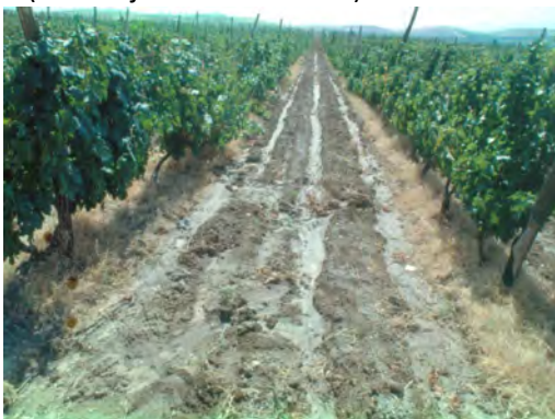
Slika 2. Primjer erozije na obrađenu tlu