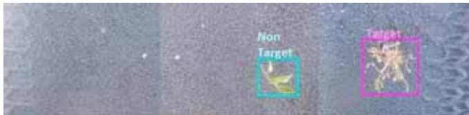
Slika 11. Pametno otkrivanje korova za apliciranje i biljke (Partel i sur., 2019)