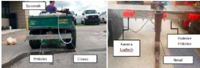
Slika 10. Pametna prskalica montirana na terensko vozilo (Partel i sur., 2019)

Jedan od suvremenih primjera zaštite bilja od korova je upotreba Smart Sprayer-a odnosno sustava koji se zasniva na strojnom učenju (machine learning). Smart Sprayer sadrži mlaznice, crpku, RTK GPS (točnost oko 2 cm), tri video kamere (Webcam Logitech c920), pametni kontroler (Arduino mega) za upravljanje svim sensorima i aktuatorima (npr. crpka), računsku jedinicu (NVIDIA Jetson TX2 GPU) za obradu slike i detekciju korova (Slika 10.). Kako bi se postigla precizna aplikacija i kreirala aplikacijska karta (karta korova) razvijen je program korištenjem C programskog jezika. Softver radi u stvarnom vremenu i može obraditi do 28 sličica u sekundi u svim koracima zajedno: akvizicija slike, detekcija objekata i komunikacija. Za preciznu mrežnu detekciju upotrebljava se YOLOv3 (Slika 11.)