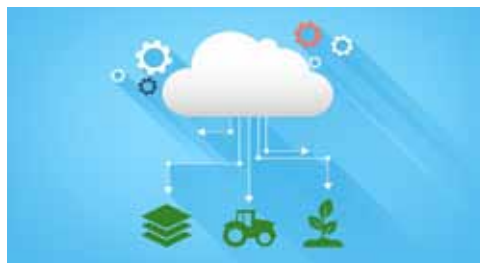
Slika 7. Virtualni oblak Picture 7. Virtual cloud