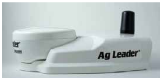
Slika 3. AgLeader antena Picture 3. AgLeader antenna