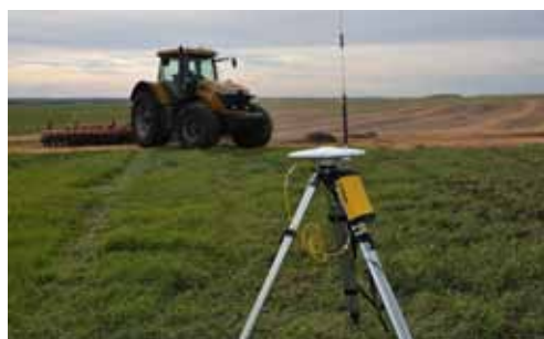
Slika 5. OptRx senzor Picture 5. OptRx sensor