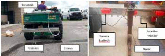
Slika 10. Pametna prskalica montirana na terensko vozilo (Partel i sur., 2019)

Jedan od suvremenih primjera zaštite bilja od korova je upotreba Smart Sprayer-a odnosno sustava koji se zasniva na strojnom učenju (machine learning). Smart Sprayer sadrži mlaznice, crpku, RTK GPS (točnost oko 2 cm), tri video kamere (Webcam Logitech c920), pametni kontroler (Arduino mega) za upravljanje svim sensorima i aktuatorima (npr. crpka), računsku jedinicu (NVIDIA Jetson TX2 GPU) za obradu slike i detekciju korova (Slika 10.). Kako bi se postigla precizna aplikacija i kreirala aplikacijska karta (karta korova) razvijen je program korištenjem C programskog jezika. Softver radi u stvarnom vremenu i može obraditi do 28 sličica u sekundi u svim koracima zajedno: akvizicija slike, detekcija objekata i komunikacija. Za preciznu mrežnu detekciju upotrebljava se YOLOv3 (Slika 11.)