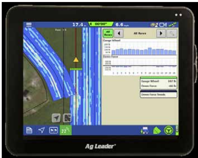
Slika 1. AgLeader zaslon Picture 1. AgLeader display