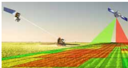
Slika 6. Telematski sustavi pri zaštiti bilja Picture 6. Telematic systems in plant protection