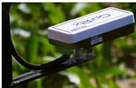
Slika 4. Bazna stanica Picture 4. Base station