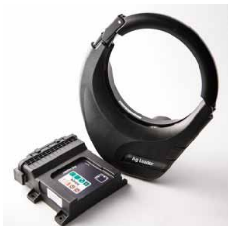
Slika 2. Hidraulično upravljanje Picture 2. Hydraulic steering