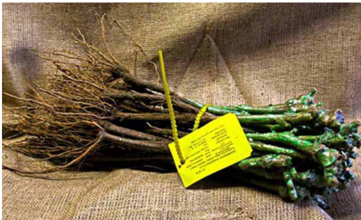
Slika 3. Cijep vinove loze