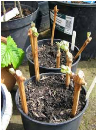
Slika 1. Postupak ukorjenjivanja reznica vinove loze

Vinova loza se može vegetativno razmnožavati na više načina: grebenicama ili povaljenicama trsa, reznicama ili ključicama i cijepljenjem ili navrtanjem. Ovdje ćemo obraditi klasični način cijepljenja omega spojem u rasadniku.