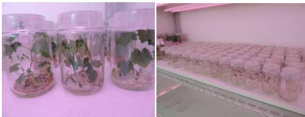
Slika 4. Multiplikacija biljnog materijala u in vitro uvjetima - biljni materijal u posudama za rast Figure 4. Multiplication of plant material in in vitro conditions - plant material in growth vessels

S vremenom je postignuto i uspješno kultiviranje drvenastih kultura. Murashige i Skoog su 1962. godine objavili sastav hranidbene podloge (koji po njima zovemo MS medij) na kojem se i danas najčešće uzgajaju biljke različitih vrsta pa tako i vinove loze.