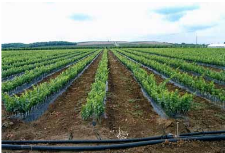
Slika 2. Prporište ili ložište u rasadniku

Proizvodnja cjevova se provodi u rasadniku, koji mora sadržavati sljedeće osnovne objekte: matične nasade američkih vrsta loza i njihovih križanaca (podloge za vinovu lozu), matične nasade sorata vinove loze namijenjene proizvodnji plemki, slobodne površine za prporenje i proizvodnju korjenjaka podloga te građevinske objekte. U matičnom nasadu podloga uzgajaju se podloge za vinovu lozu čija je namjena: proizvodnja cjevova u rasadniku ili proizvodnja korjenjaka za podizanje matičnjaka ili vinograda gdje se cijepjenje obavlja na stalno mjesto u zeleno ili zrelo. Proizvodnja plemki se osigurava iz matičnih nasada vinove loze, a sadni materijal za podizanje tih nasada potječe od selekcioniranog klonskog i bezvirusnog materijala. Njega u matičnim nasadima mora biti besprijekorna, kako bi se osigurala zdrave i potpuno dozrele reznice, a to znači dobar prirod plemki (Mirošević i Karoglan Kontić, 2008.). Prporište ili ložište je površina na kojoj se obavlja prporenje cjevova kako bi se postigao dobar rast i razvoj korijena i mladica. Građevinski objekti se sastoje od rashladnih komora ili hladnjača, stratifikala, bazena za namakanje podloga i plemki, skladišni prostor, prostor za pripremu i pakiranje reznica i cjevova te cjepljarnica.