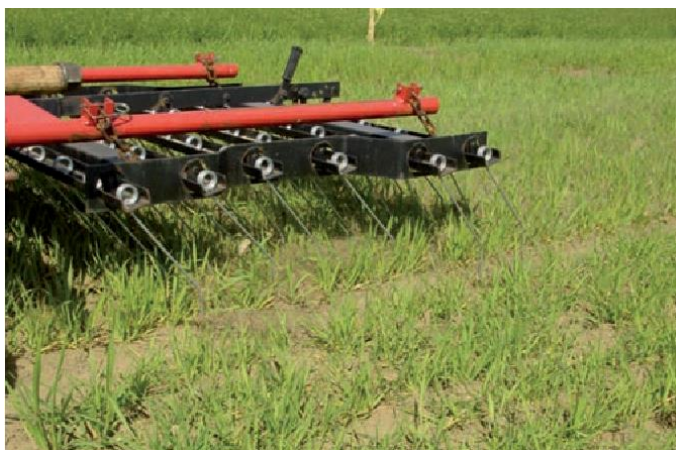
Slika 2. Drljača s fleksibilnim zupcima (izvor: Pannacci i sur., 2017.)

Ovisno o proizvođaču, nekoliko je različitih izvedbi pljevilica za mehaničko suzbijanje rezanjem, čupanjem ili zatrpavanjem korova. Radna tijela mogu biti drljače s krutim ili fleksibilnim zupcima (slika 2), rotirajuće drljače s ukošeno ili okomito postavljenim prstima (slika 3) i različite izvedbe kose za rezanje korova koji nadvisuju usjev.