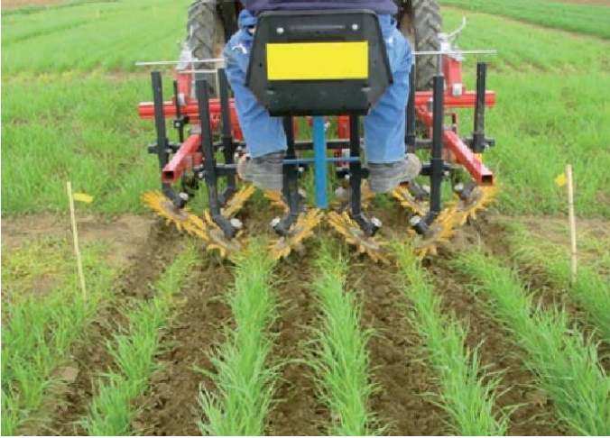
Slika 3. Rotirajuće drljače

Učinci mehaničkog suzbijanja korova su različiti. Ovisi o vrsti, gustoći i razvojnoj fazi korova, vremenu primjene, tipu i vlazi tla. Nedostatak je što korovi unutar reda ostaju nesuzbijeni. Jednokratna primjena najčešće nije zadovoljavajuća. Moguća su mehanička oštećenja kod slabo ukorijenjena usjeva, osobito kod izvedbi s fleksibilnim zupcima jer rade po cijeloj površini. Zbog kompenzacije oštećenja neki autori preporučuju povećanje sjetvene norme za 10 %. Kod rotirajućih drljača oštećenje usjeva je manje jer se radna tijela kreću u međurednom razmaku. Drljače s rotirajućim prstima manje su osjetljive na vlagu i tip tla i mogu se koristiti i u kasnijoj fazi razvoja žitarica (Pannacci i sur., 2017.). Postoje preporuke da se strne žitarice siju u trake s međurednim razmakom manjim od uobičajenoga, a u prostoru između traka obavlja se kultivacija. Također se istražuje sjetva žitarica u redove šireg razmaka (25 – 30 cm) zbog mogućnosti međuredne kultivacije.