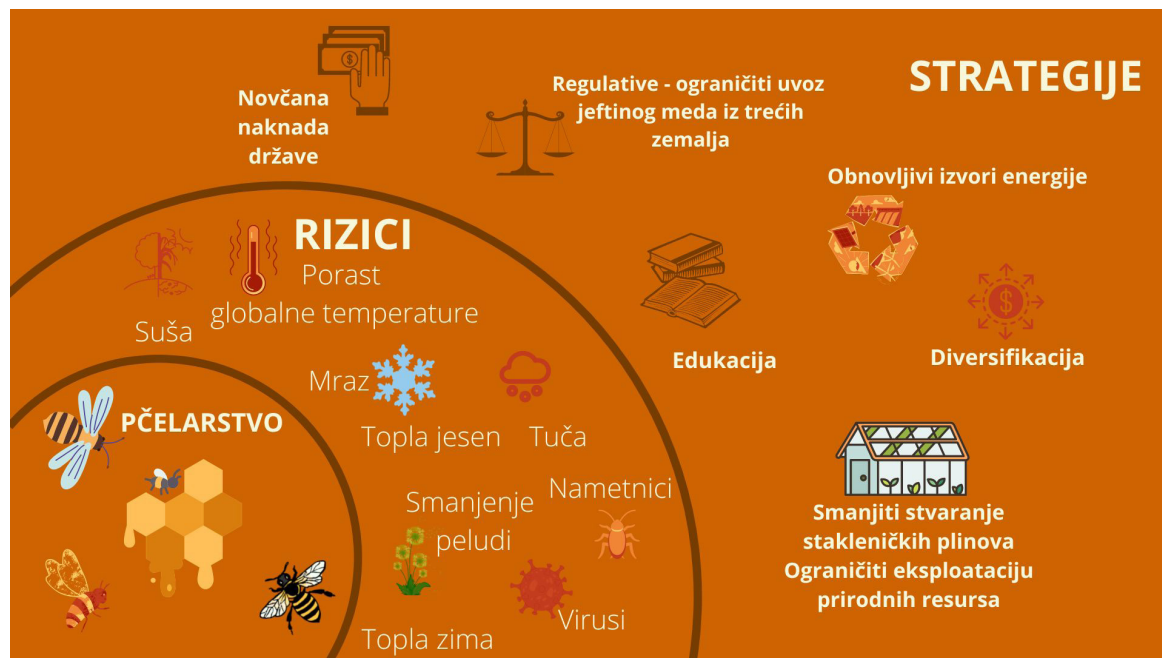
Slika 1. Rizici i strategije za upravljanje rizikom u pčelarstvu