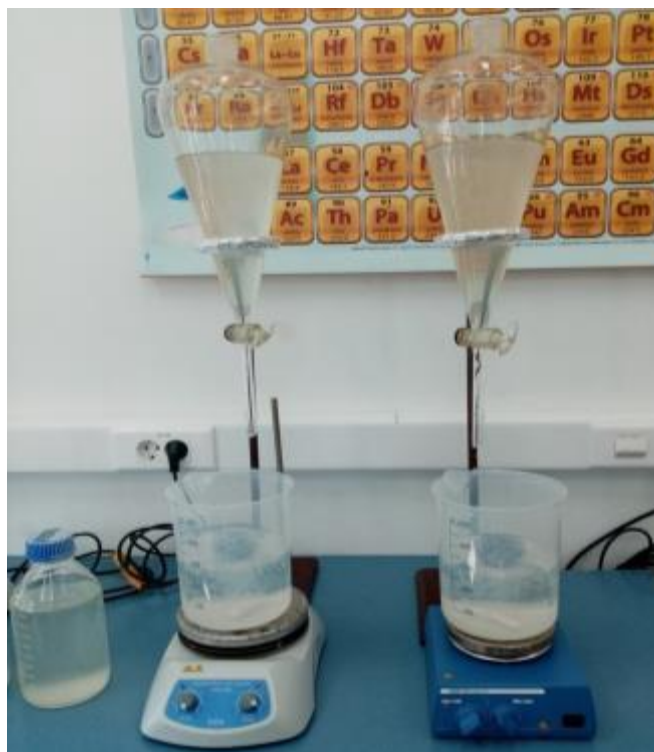
Slika 5. Priprava mikrokapsula pomoću lijevaka za odijeljavanje

Drugi tip mikrokapsula pripravljen je miješanjem 1200 g formiranih mikrokapsula u 1 litri 0,5% (w/v) otopine kitozana u 1% (v/v) octenoj kiselini u razdoblju od 1 sata na magnetnoj miješalici (Slika 5.). Mikrokapsule obložene slojem kitozana se filtriraju, isperu destiliranom vodom te čuvaju na hladnom i tamnom mjestu do primjene.