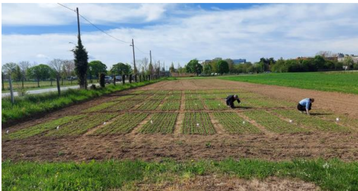
Slika 2. Lan nakon nicanja

Dobiveni podaci obradit će se analizom varijance, a razlike između srednjih vrijednosti testirane su LSD testom na nivou od 5%.