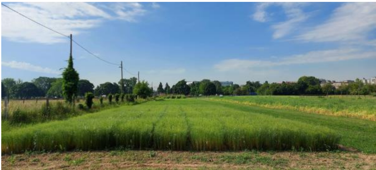
Slika 4. Lan u ranoj žutoj zriobi