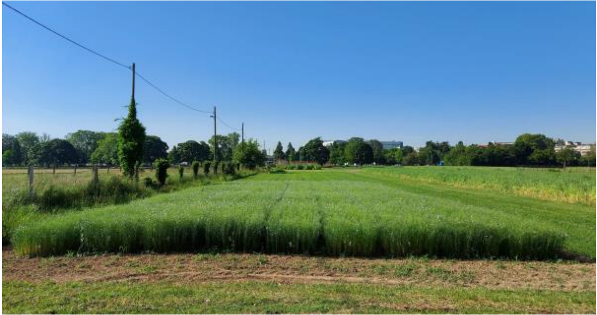
Slika 3. Lan u cvatnji