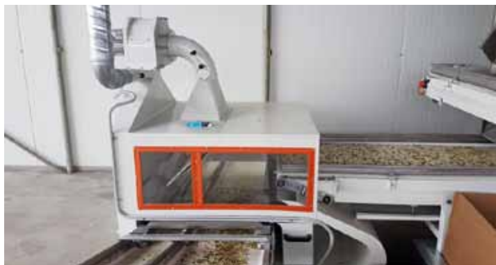
Slika 8. Pneumatski separator

Pneumatski separator namijenjen je za zračno odvajanje cvatova kamilice od prema težini pojedinih frakcija. Primjese mogu biti u obliku primjese zemlje, kamena, metalnih ostataka, a efektivno odvaja i čestice prašine. Pneumatski separator opremljen je ventilatorom s podešavanjem brzine strujanja zraka, čime se precizno može regulirati kvaliteta odvajanja pojedinih frakcija.