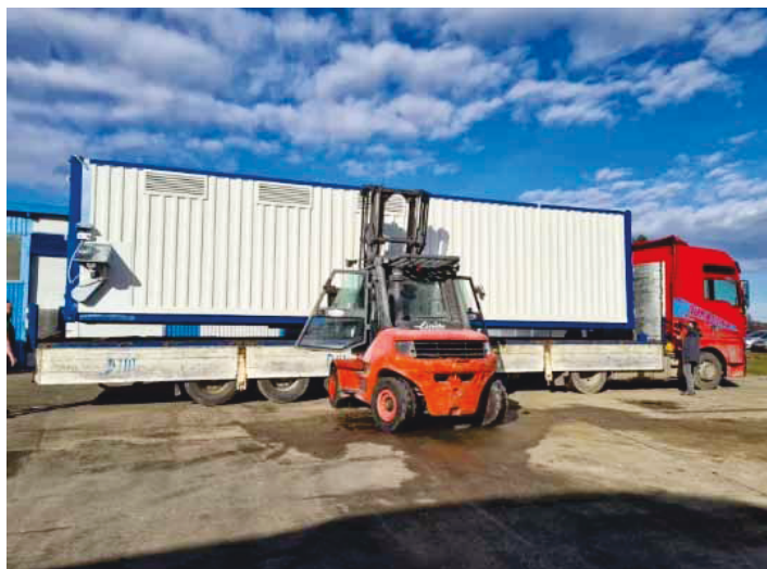
Slika 3. Univerzalna prijenosna kontejnerska sušara

Pod ove sušare čini perforirani pocinčani lim debljine 1,2 mm i promjera perforacija za ventilaciju od 3,2 mm.