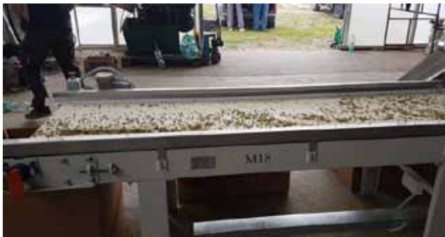
Slika 9. Revizijski transporter Figure 9. Revisory conveyor

Revizijski transporteri namijenjeni su za inspekciju i organoleptički pregled raznih vrsta materijala. Na kraju revizijskog transportera nalazi se pneumatski separator s lomljenim trakastim transporterom, čija je funkcija klasiranje glavica po kvaliteti te odvajanje prašine. Tako klasirana glavica kontrolira se na revizijskom transporteru nakon čega se obrađena roba prve klase pakira izravno u kutije za skladište gotove robe.