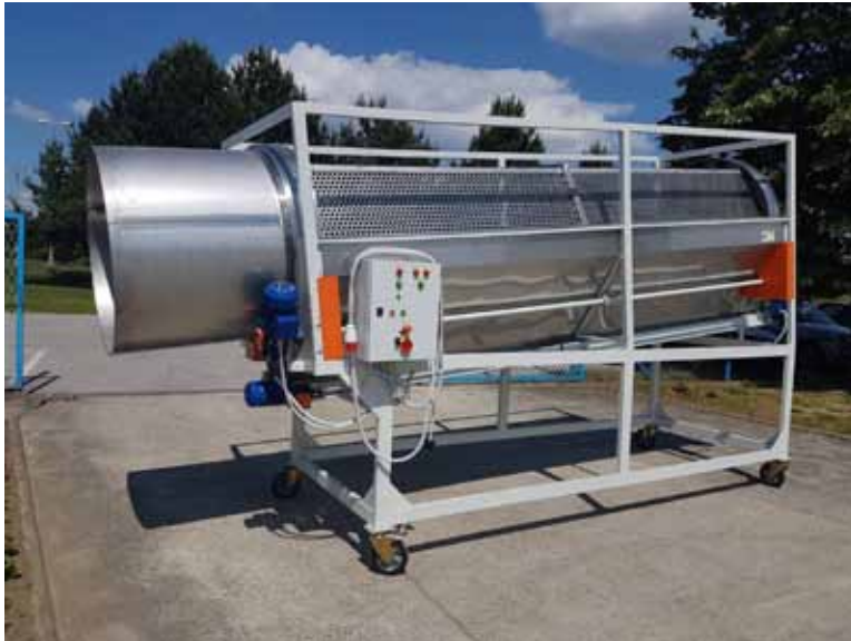
Slika 2. Cilindrični separator

Upotreba ciklindričnog separatora neizostavan je dio dorade kamilice jer se time smanjuje trošak sušenja, a povećava kvaliteta i ukupna vrijednost ubrane mase.