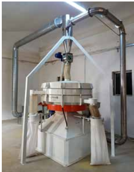
Slika 7. Rotacijsko-planetarno sito

Ovaj tip sita namijenjen je za razdvajanje materijala na dvije do pet frakcija, zavisno od broja ugrađenih umetaka (etaža). Mnoge su prednosti planetarnih sita, kao npr. visoka kvaliteta prosijavanja, tih i miran rad, potpuna zatvorenost (što je važno jer nema prašenja) i visoka produktivnost i pouzdanost u radu.