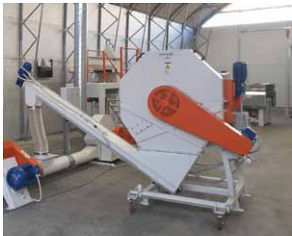
Slika 10. Rezačica biljne mase Figure 10. Herbs cutter

Namijenjena je za rezanje različitih vrsta bilja u svježem ili suhom stanju. Duljina reza bira se prema zahtjevu tehnologije. Može se koristiti i za usitnjavanje osušenih materijala prije mljevenja. Rezačica se sastoji od postolja, rotorskog i statorskog sklopa.