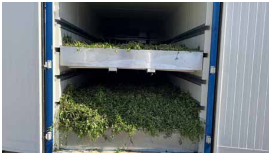
Slika 4. Unutrašnjost prijenosne kondenzacijske sušare

Kondenzacijska sušara u izvedbi tvrtke Herbas koncipirana je kao regalna i podna, tj. materijal se može puniti na perforirani pod sušare ili u police (okvire s propusnim dnom) u jednoj ili više etaža. Punjenje na pod, jednu ili više etaža zavisi od vrste materijala, gustoće i visine sloja. (Slika 4)