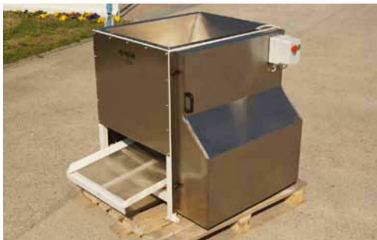
Slika 5. Odvajač glavica cvijeta kamilice