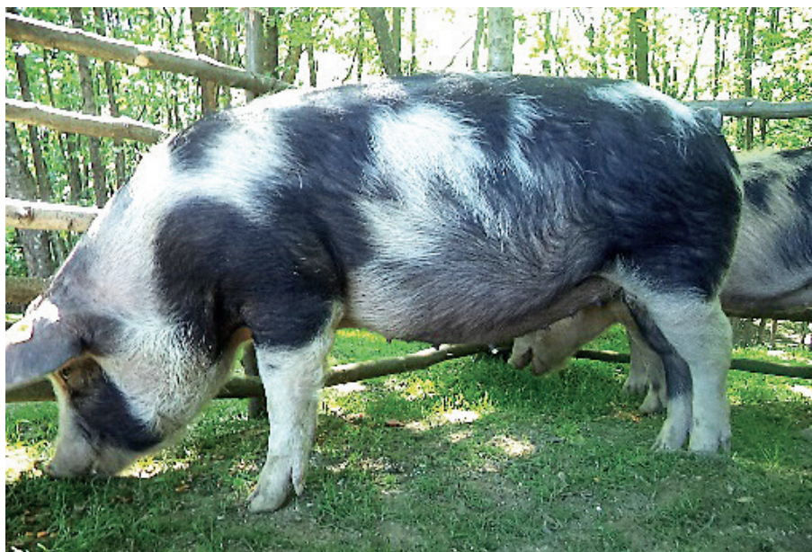
Slika 1. Krmača banijske šare svinje