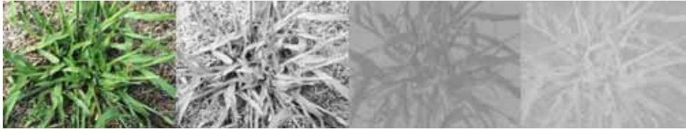
Slika 2. Primjer pretvaranja RGB slike korova u YCrCb prostor boja

ss Green Indeks - ExG). Hamuda i sur. (2016) su dali detaljan opis ExG i drugih indeksa boja u svom pregledu metoda segmentacije biljaka na terenskim slikama. Uz korištenje indeksa boja izvedenih iz RGB kanala, neke metode detekcije korova pretvaraju RGB slike u prostore boja kao što je YCrCb (Tang i sur., 2016). Primjer pretvaranja RGB slike korova u YCrCb prostor boja prikazan je na slici 2. Sujaritha i sur. (2017) su koristili umjetnu rasvjetu na terenu kako bi stvorili jednoliku rasvjetu po cijeloj površini slike.