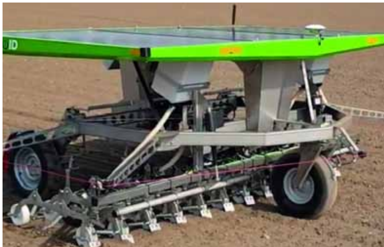
Slika 5. Robot za mehaničko suzbijanje korova FarmDroid FD20