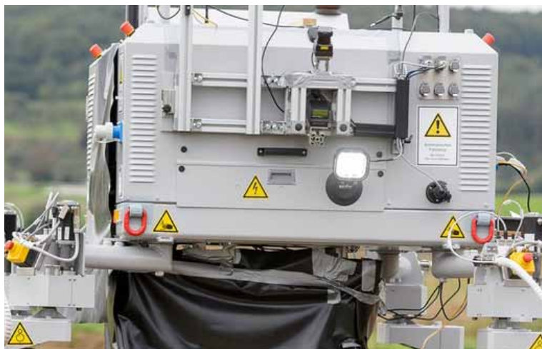
Slika 6. Integrirani višenamjenski robot za primjenu u poljoprivredi BoniRob

Neki roboti imaju mogućnost uklanjanja korova i kemijskim i mehaničkim sustavom. Integrirani višenamjenski robot za primjenu u poljoprivredi pod nazivom BoniRob razvijen je kao zajednički projekt Sveučilišta Osnabruck, razvojne tvrtke DeepField Robotics, tehnološke tvrtke Bosch i proizvođača poljoprivrednih strojeva Amazone (Slika 6).