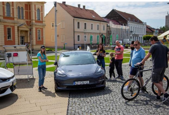
Slika 4.9. Izložba električnih vozila