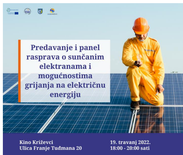
Slika 4.7. Vizual predavanja i panel rasprave o sunčanim elektranama i mogućnostima prelaska na električnu energiju

Slika 4.7. u nastavku prikazuje poziv na predavanje i panel raspravu o grijanju na električnu energiju, ovim se vizualom događaja energetska zadruga koristila prilikom oglašavanja predavanja u medijima te na vlastitim stranicama (službena web stranica, Facebook, Instagram).