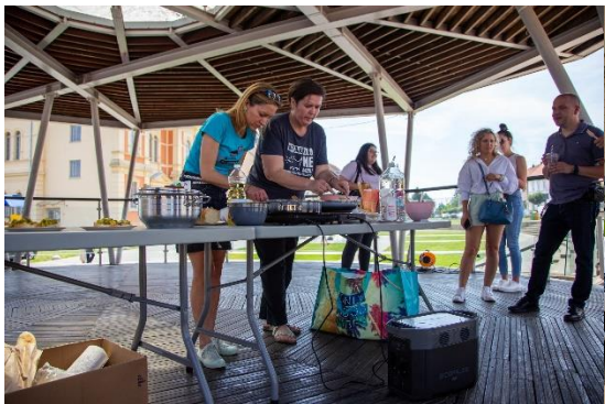
Slika 4.8. Radionica pripreme veganskih obroka

Slike u nastavku prikazuju aktivnosti s dosadašnjih izdanja festivala „KLIKni na održivo“ koji je križevačku dokolicu obogatio mogućnošću usvajanja znanja i vještina vezanih uz održivost i ekologiju.