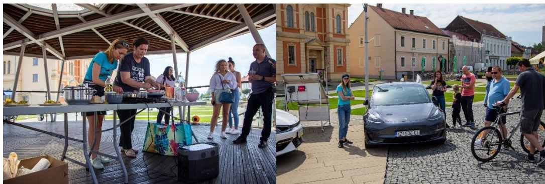
Slika 4.8. Radionica pripreme veganskih obroka

Slike u nastavku prikazuju aktivnosti s dosadašnjih izdanja festivala „KLIKni na održivo“ koji je križevačku dokolicu obogatio mogućnošću usvajanja znanja i vještina vezanih uz održivost i ekologiju.