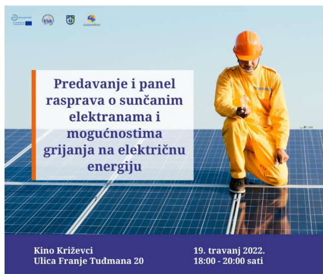
Slika 4.7. Vizual predavanja i panel rasprave o sunčanim elektranama i mogućnostima prelaska na električnu energiju

Slika 4.7. u nastavku prikazuje poziv na predavanje i panel raspravu o grijanju na električnu energiju, ovim se vizualom događaja energetska zadruga koristila prilikom oglašavanja predavanja u medijima te na vlastitim stranicama (službena web stranica, Facebook, Instagram).