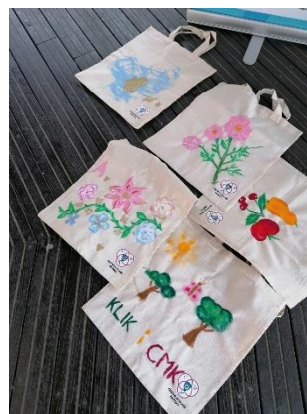
Slika 4.10. Radionica izrade prirodne kozmetike Slika 4.11. Radionica oslikavanja torbi