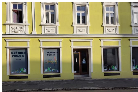
Slika 4.3. Energetske-klimatski ured u Križevcima

Slika 4.3. u nastavku prikazuje vanjski izgled energetske-klimatskog ureda koji se nalazi u samom centru grada Križevaca, na adresi Ivana Zakmardija Dijankovečkog 8, Križevci.