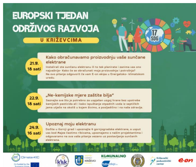
Slika 4.6. Program Europskog tjedna održivog razvoja u Križevcima

Energetska zadruga KLIK osim svakodnevne savjetodavne aktivnosti u sklopu energetske-klimatskog ureda i različitih projektnih aktivnosti povremeno organizira edukacije sa svrhom educiranja građana o različitim temama vezanim uz energetska učinkovitost, obnovljive izvore energije, solarne elektrane. Osim same energetske tranzicije zadruga nastoji poduprijeti i tranziciju poljoprivrede ka održivim poljoprivrednim praksama, stoga su edukacijske aktivnosti vezane i uz ekološku i održivu poljoprivredu. Zadruga svake godine organizacijom edukacija obilježava Europski tjedan održivog razvoja, tako je 2022. godine Europski tjedan održivog razvoja u Križevcima obilježen edukacijama na tri važne teme: „Kako obračunavamo proizvodnju vaše sunčane elektrane“, „Ne-kemijske mjere zaštite bilja“ te „Upoznaj svoju elektranu. Na slici 4.6. u nastavku prikazan je program Europskog tjedna održivog razvoja u Križevcima 2022. godine.