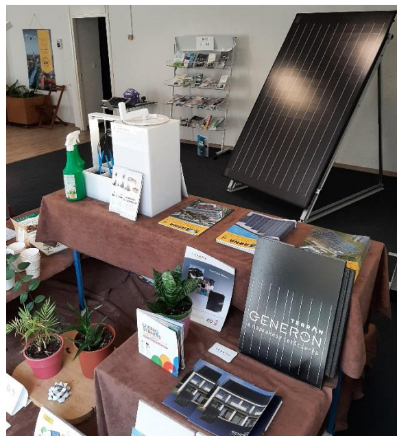
Slika 4.5. Izložbeni prostor proizvoda partnera