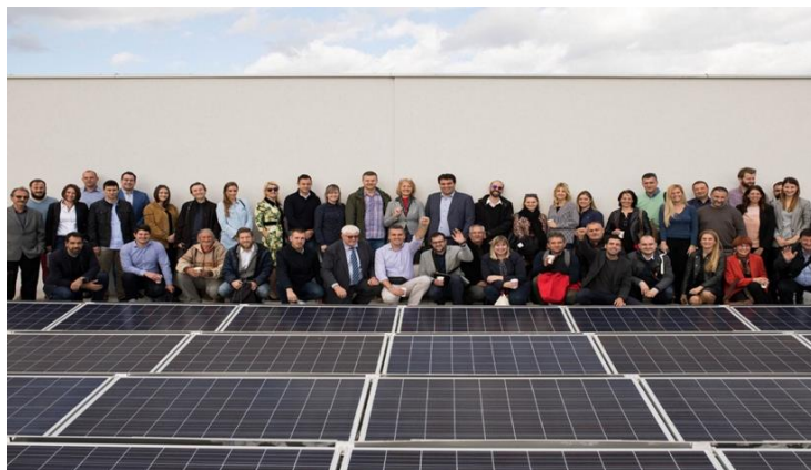
Slika 4.1. Križevački sunčani krovovi, pokretanje sunčane elektrane na krovu RCTP Križevci

Na slici 4.1. u nastavku prikazano je otvorenje, odnosno pokretanje sunčane elektrane na krovu RCTP-a Križevci.