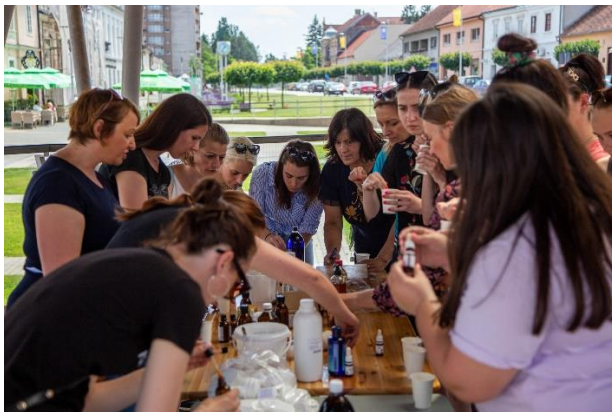
Slika 4.10. Radionica izrade prirodne kozmetike