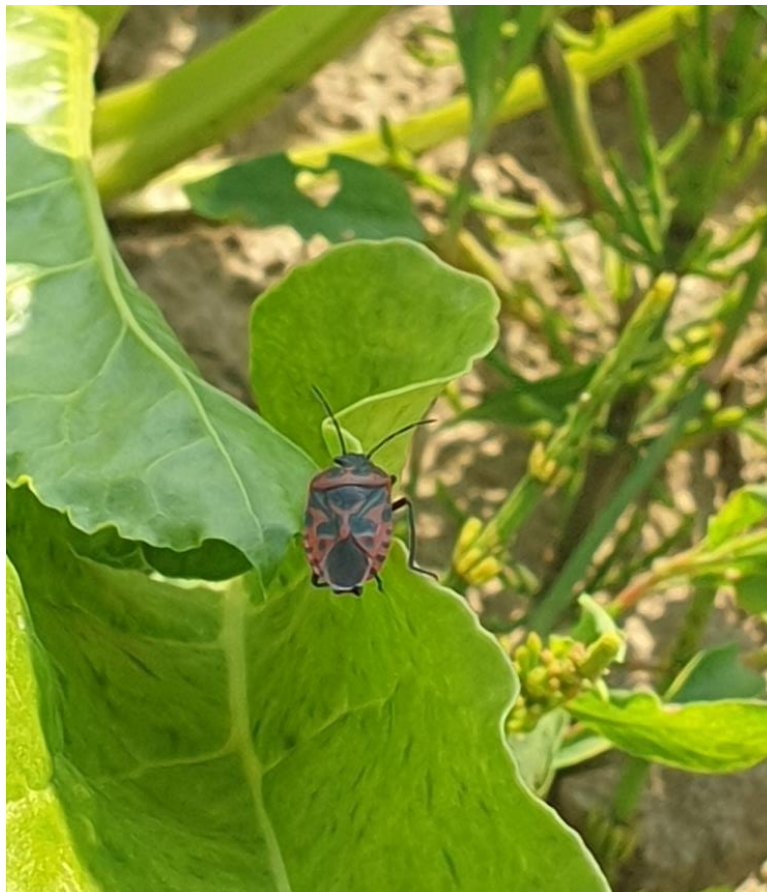
Slika 5.2.1. Vrsta Eurydema ventralis na šećernoj repi

Vrsta Eurydema ventralis , Kolenati (Slika 5.2.1.) utvrđena je u lipnju na lokalitetu Jakšić na listovima, duž stabljike europskog mračnjaka te uzgajane kulture (šećerna repa) na promatranoj parceli. Na njima nisu ustanovljeni tragovi oštećenja od ove stjenice, također ni prilikom laboratorijskih istraživanja. Ovu vrstu smatramo slučajnom jer nije dokazano kako je svojim načinom ishrane prouzročila štetu promatranoj korovnoj vrsti.