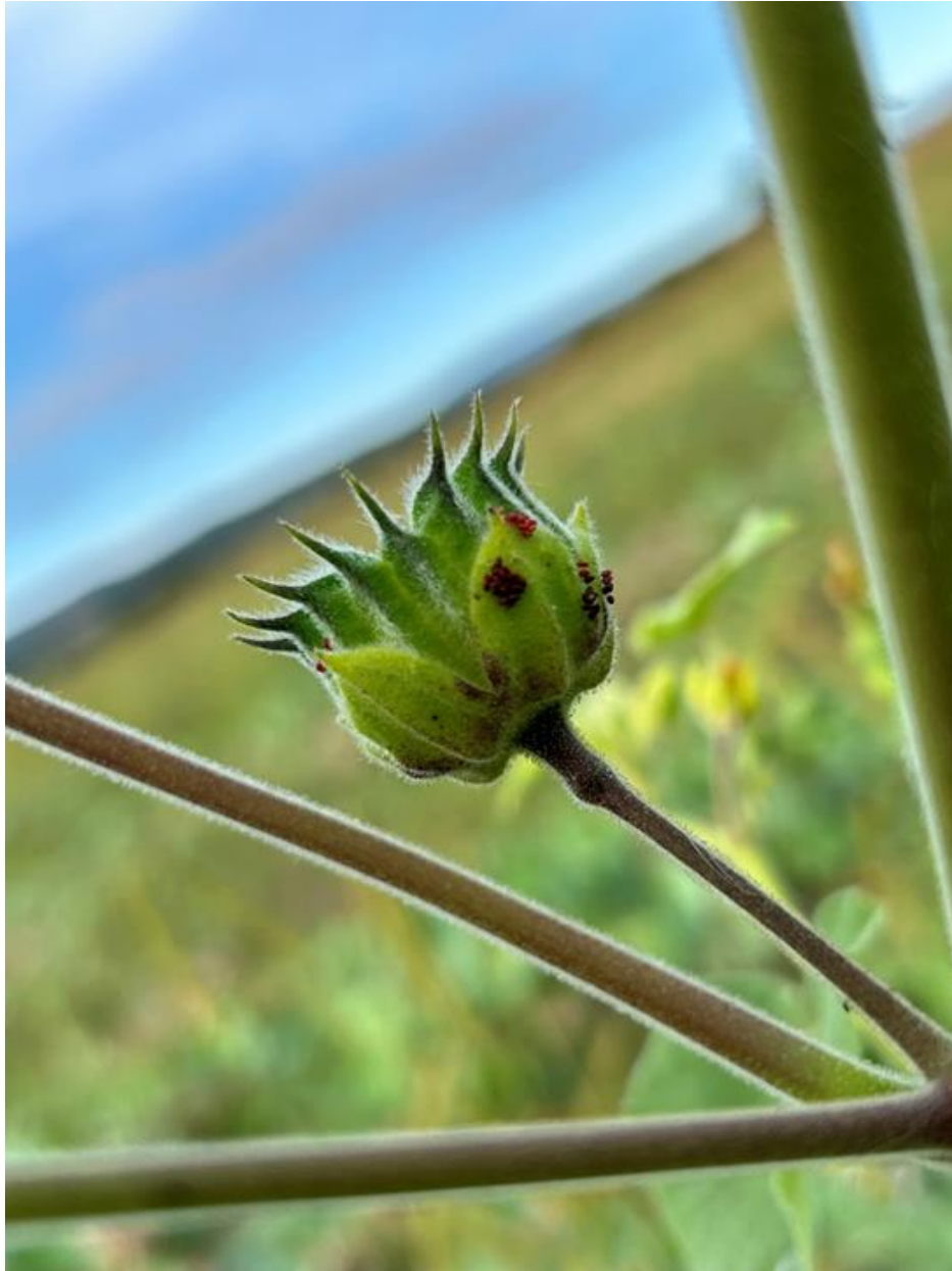
Slika 5.3.1. Jajna legla stjenice Liorhyssus hyalinus F. na tobolcu europskog mračnjaka