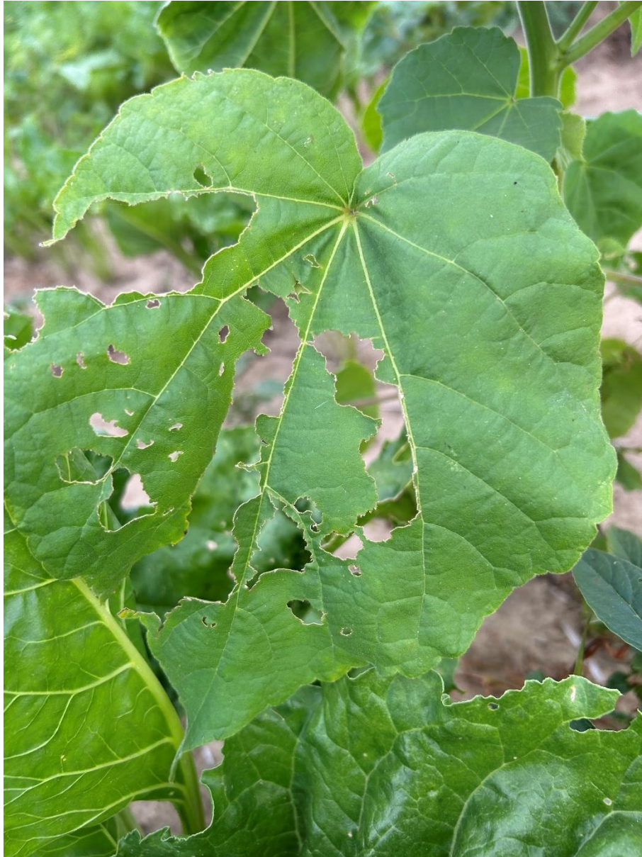
Slika 5.3.6. Oštećena lisna površina europskog mračnjaka uslijed hranidbe gusjenice kukuruznog moljca