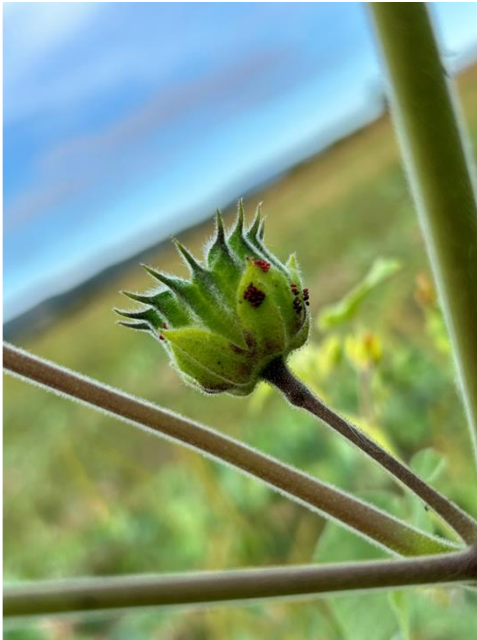
Slika 5.3.1. Jajna legla stjenice Liorhyssus hyalinus F. na tobolcu europskog mračnjaka (Foto: Antonio Bajić, 2023.)