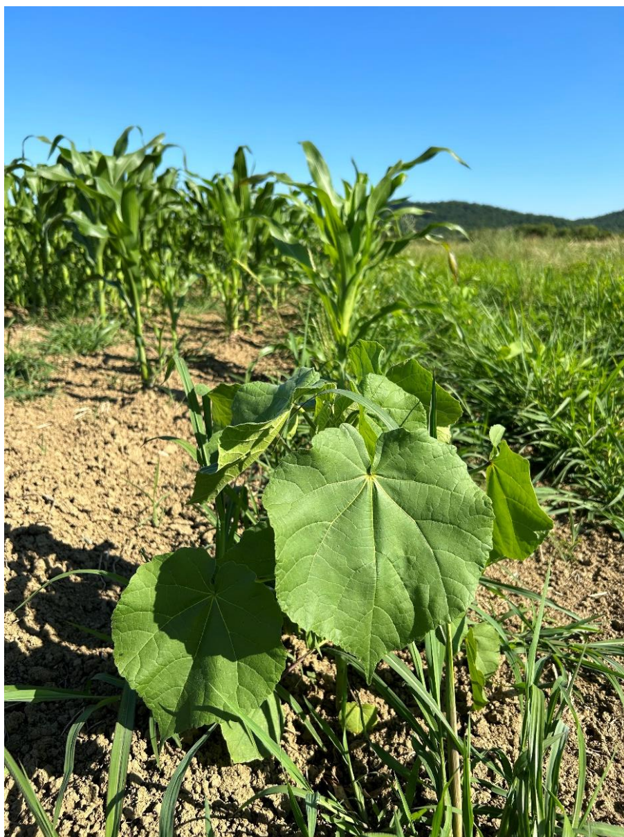
Slika 2.4.2. Europski mračnjak u usjevu kukuruza