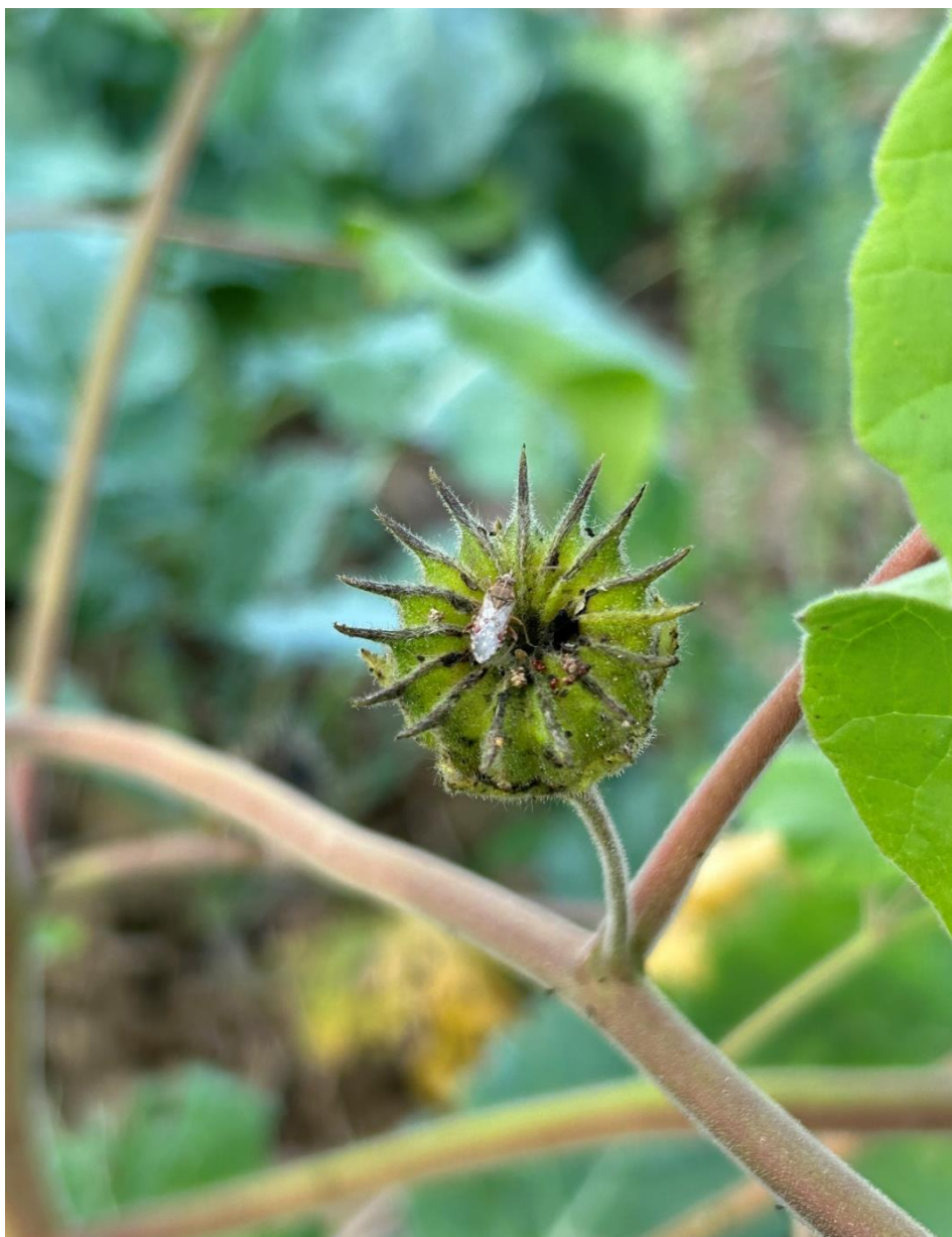
Slika 5.3.2. Odrasli oblik Liorhyssus hyalinus F. na europskom mračnjaku