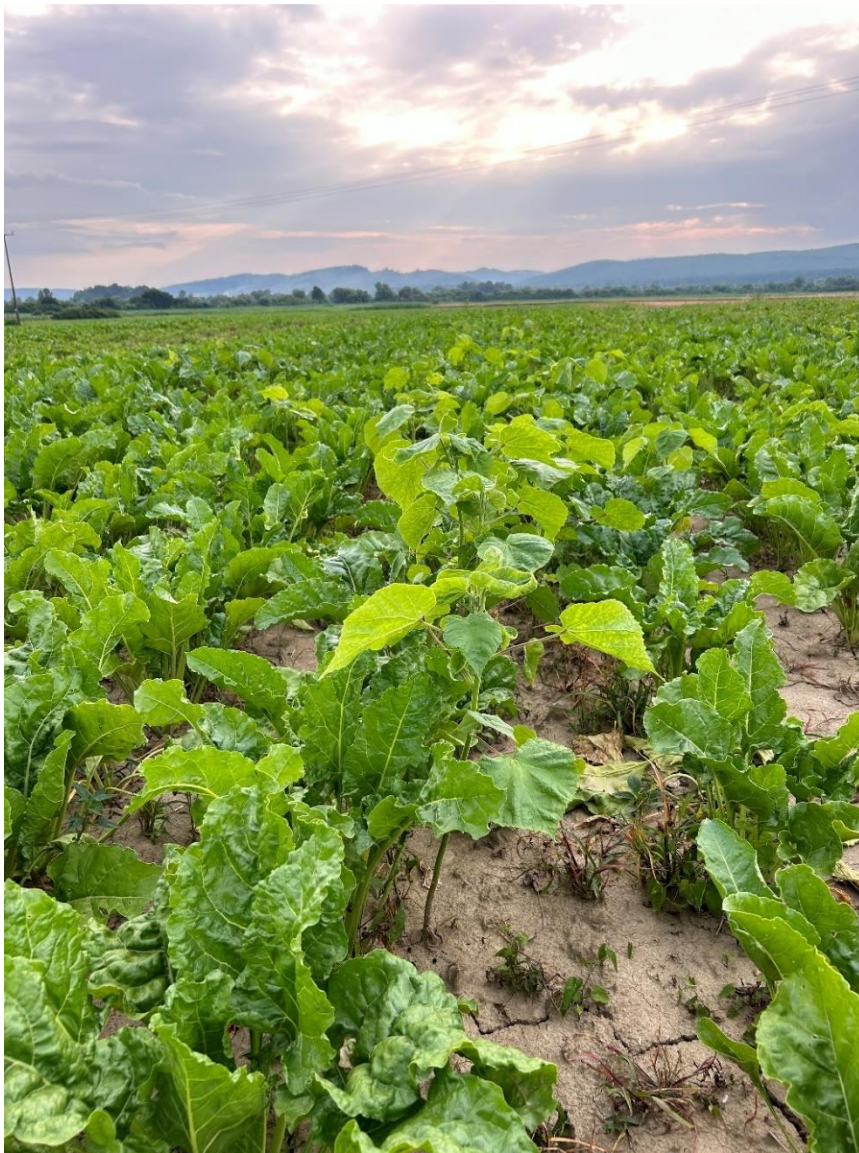
Slika 2.4 4. Europski mračnjak u usjevu šećerne repe

Europski mračnjak predstavlja veliki problem pretežito u usjevu okopavina. Šećerna repa kao jedna od okopavinskih kultura, ostavlja veliku površinu životnog prostora oko sebe slobodno za širenje i razvijanje mračnjaka. Glavni razlozi šteta u usjevu šećerne repe su: rana sjetva, sjetva na konačan sklop biljaka, sporo nicanje, spori razvoj, brzi porast europskog mračnjaka u ranim stadijima, kasno zatvaranje redova šećerne repe te relativno kasno vađenje (Šarec, 1998. cit. Grubišić, 2001.). Istraživanjem Schweizera i Bridgea (1982.) utvrđeno je kako je europski mračnjak u populaciji od 6, 12, 18 i 24 biljaka mračnjaka/ 30 m reda snizio prinos za 14, 17, 25 i 30 %. Zakorovljenost usjeva šećerne repe na području Požeško-slavonske županije prikazana je na Slici 2.4.4.