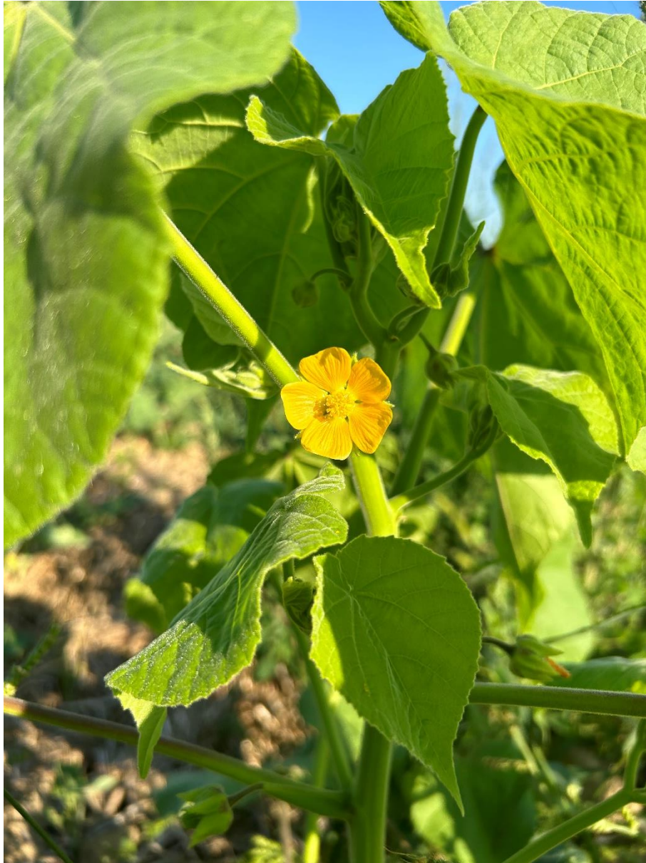
Slika 2.3.2. Žuti cvijet Abutilon theophrasti Medik