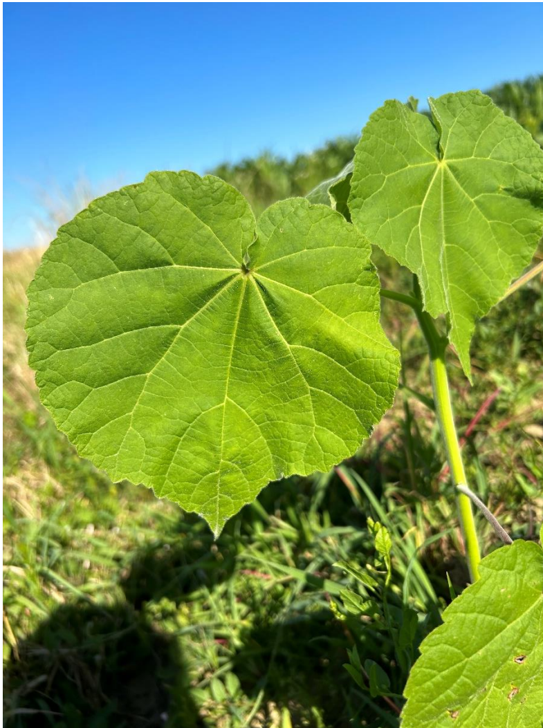
Slika 2.3.1. Srcoliki oblik lista Abutilon theophrasti Medik

Europski mračnjak je biljka uspravne i uglavnom nerazgranjene (osim pri vrhu) stabljike. Svojom habitusom može dosegnuti visinu od 0,5 m do 1,5 m, no postoje zapisi kako može doseći visinu i do čak 3 m, ovisno o uvjetima u kojima biljka raste i razvija se. Listovi su naizmjenični, na dugim peteljkama, srcolikog oblika, pri vrhu ušiljeni (Slika 2.3.1.). Rub lista je plitko nazubljen.