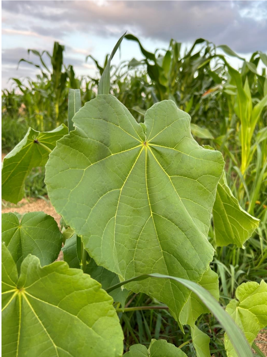
Slika 2.4.1. Razvijen list europskog mračnjaka u usjevu kukuruza