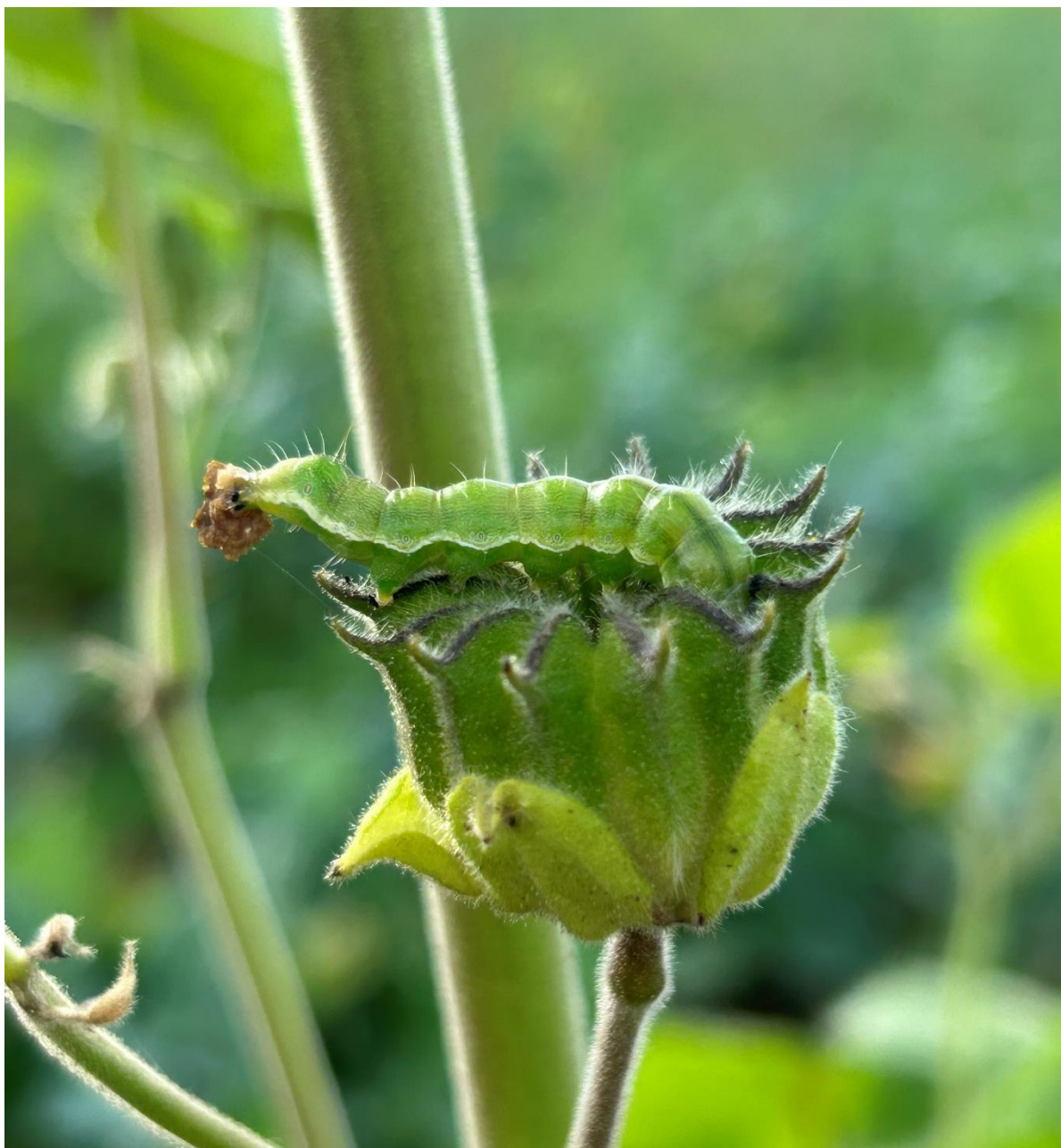
Slika 5.3.8. Gusjenica vrste Heliothis armigera na tobolcu mračnjaka