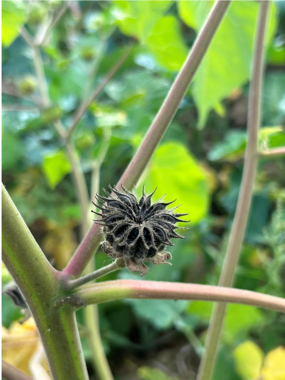
Slika 2.3.3. Tobolac vrste Abutilon theophrasti Medik