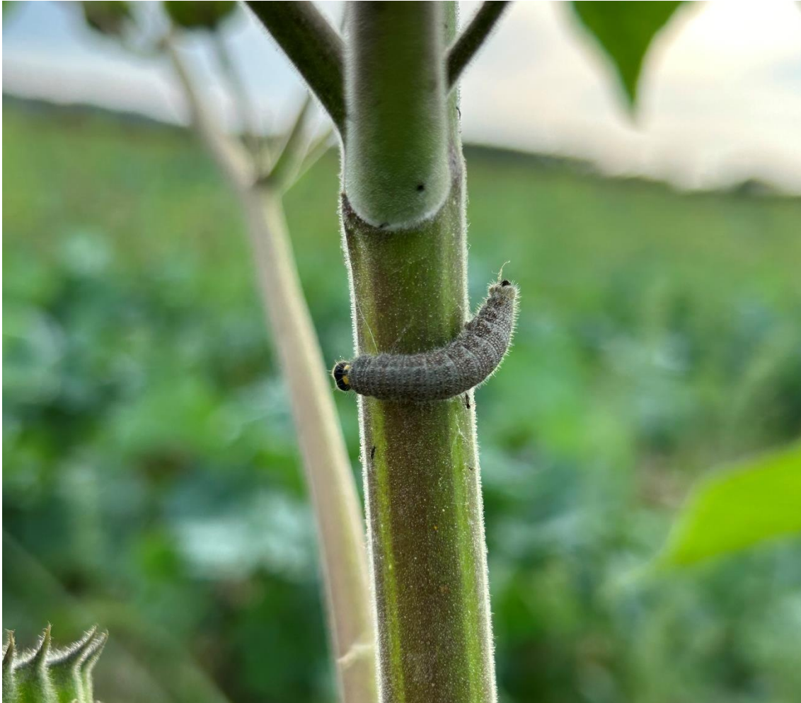
Slika 5.3.7. Gusjenica vrste Carcharodus alceae Esp. na stabljici europskog mračnjaka (Foto: Antonio Bajić, 2023.)