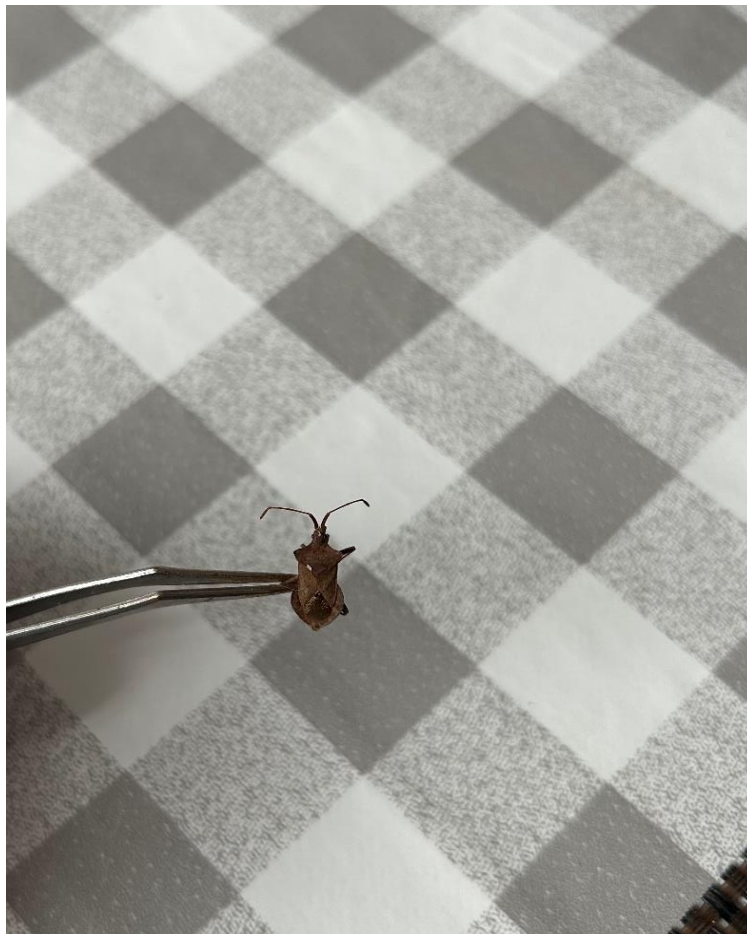
Slika 5.2.2. Vrsta Coreus marginatus u laboratorijskim uvjetima

Vrsta Coreus marginatus L. (Slika 5.2.2.) utvrđena je u lipnju 2023. na lokalitetu Vidovci. Ova vrsta se hrani sjemenom i lišćem vrsta iz porodice dvornikovki (kiselice) i drugim vrstama iz porodice Polygonaceae. Ova se vrsta također hrani i vrstama iz porodice Asteraceae i Rosaceae. Vrsta je pronađena na lokalitetu u usjevu soje koji je bio dosta zakorovljen. Uočena je na listu i stabljici soje te listovima europskog mračnjaka. Nakon promatranja u laboratorijskim uvjetima kroz testove hranidbe, nije utvrđeno kako je vrsta na bilo koji način učinila štetu na europskom mračnjaku te ju smatramo slučajnom vrstom.