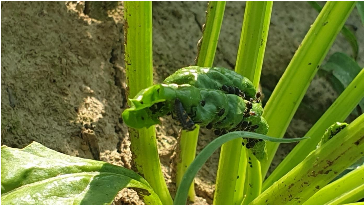
Slika 5.3.3. Lisne uši na šećernoj repi

Lisne uši (Slika 5.3.3.) utvrđene su na lokalitetima Bučje i Pleternica tijekom mjeseca srpnja. Jedinke ove vrste pronađene su na lišću te stabljici u brojnijoj populaciji. Detaljnim pregledom navedenih biljnih organa korovne vrste, nisu utvrđene posljedice hranidbe lisnih uši.