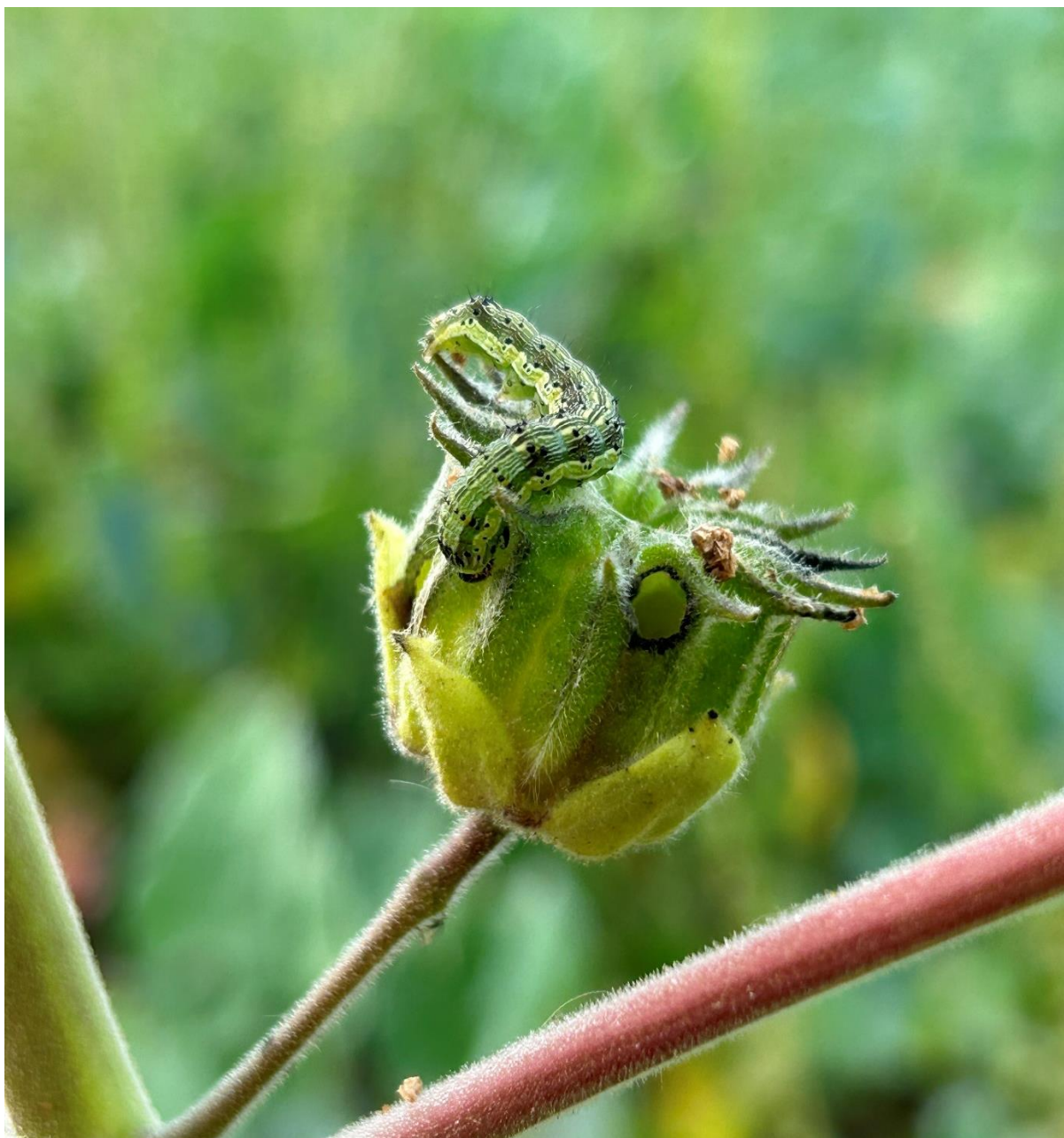
Slika 5.3.9. Karakteristični okrugli otvori nastali ubušivanjem vrste Heliolithis armigera u tobolac europskog mračnjaka