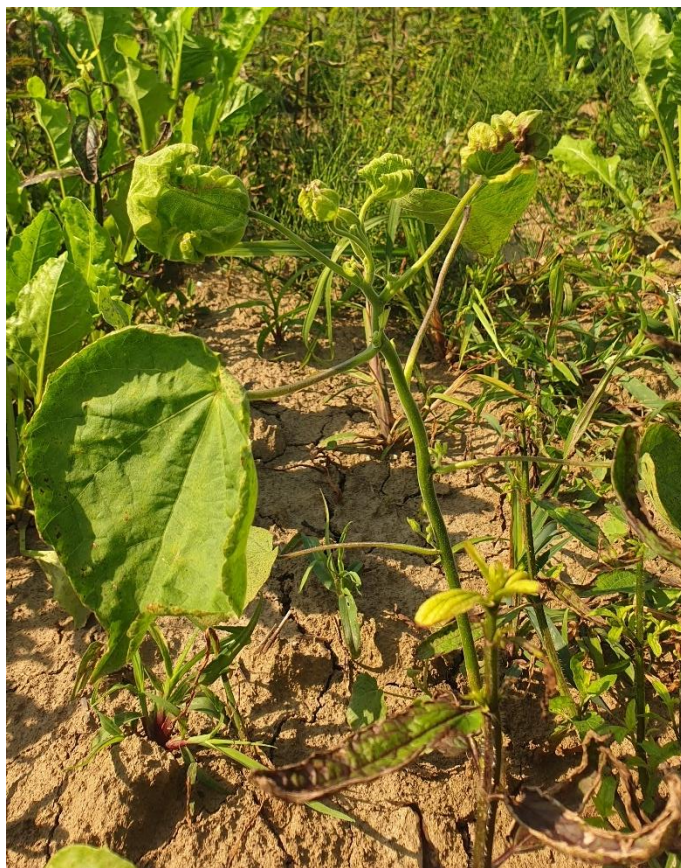
Slika 2.5.1. Oštećenja europskog mračajaka nastala nakon kemijskog tretiranja