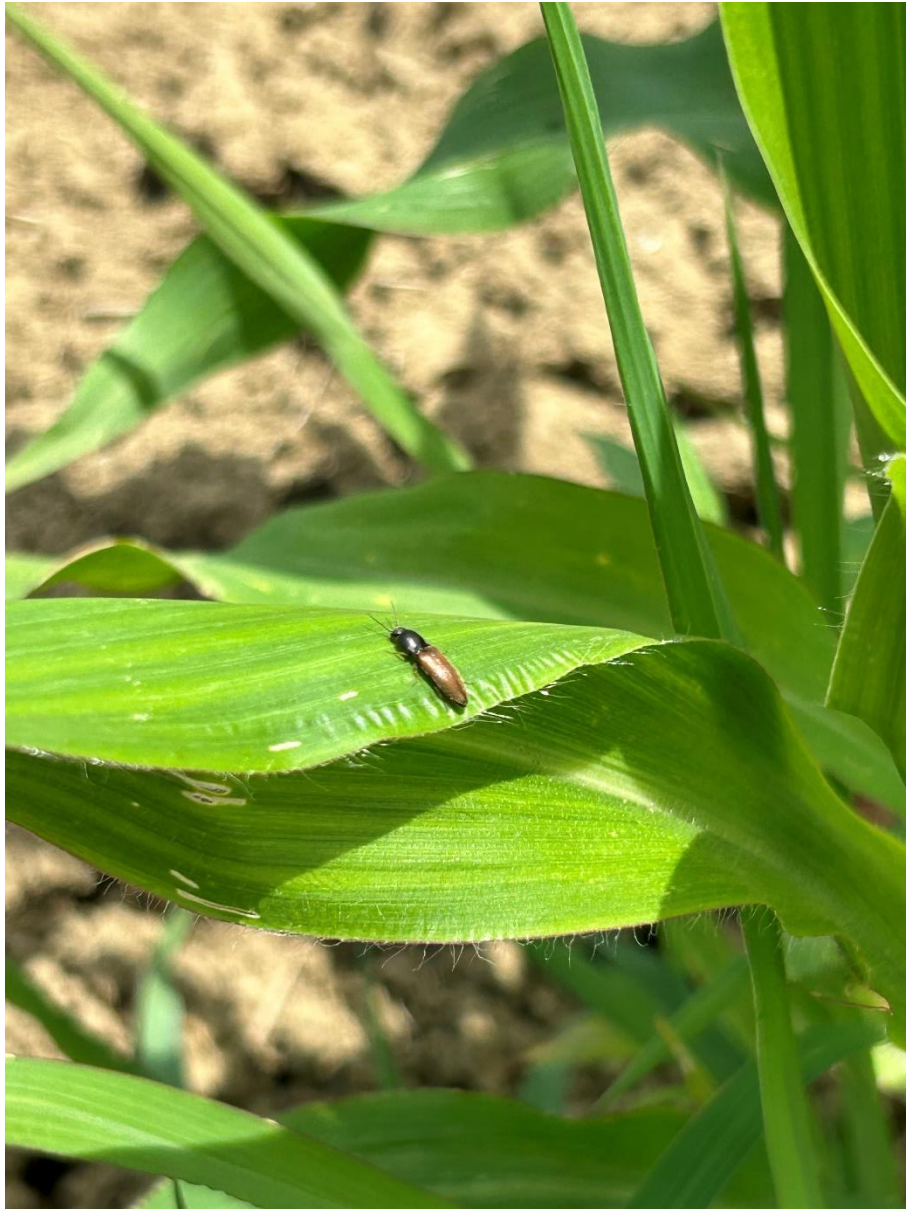
Slika 5.2.4. Agriotes spp. na listu kukuruza

Jedinke Agriotes spp. (Slika 5.2.4.) utvrđene su na lokalitetu Pleternica tijekom srpnja. Odrasla jedinka ove vrsta, poznatija kao klisnjak, ne pričinjava štete, nego se hrani polenom biljaka. Pronađena je u usjevu kukuruza na biljkama uzgajane kulture te na promatranoj korovnoj biljci. Uočena je na listovima i stabljici. Ova je vrsta poznatija po štetama koje nanose njeni ličinački stadiji, oštećujući korijen biljke. Tako pojavnost ovog stadija i vrste na europskom mračnjaku smatramo slučajnom.