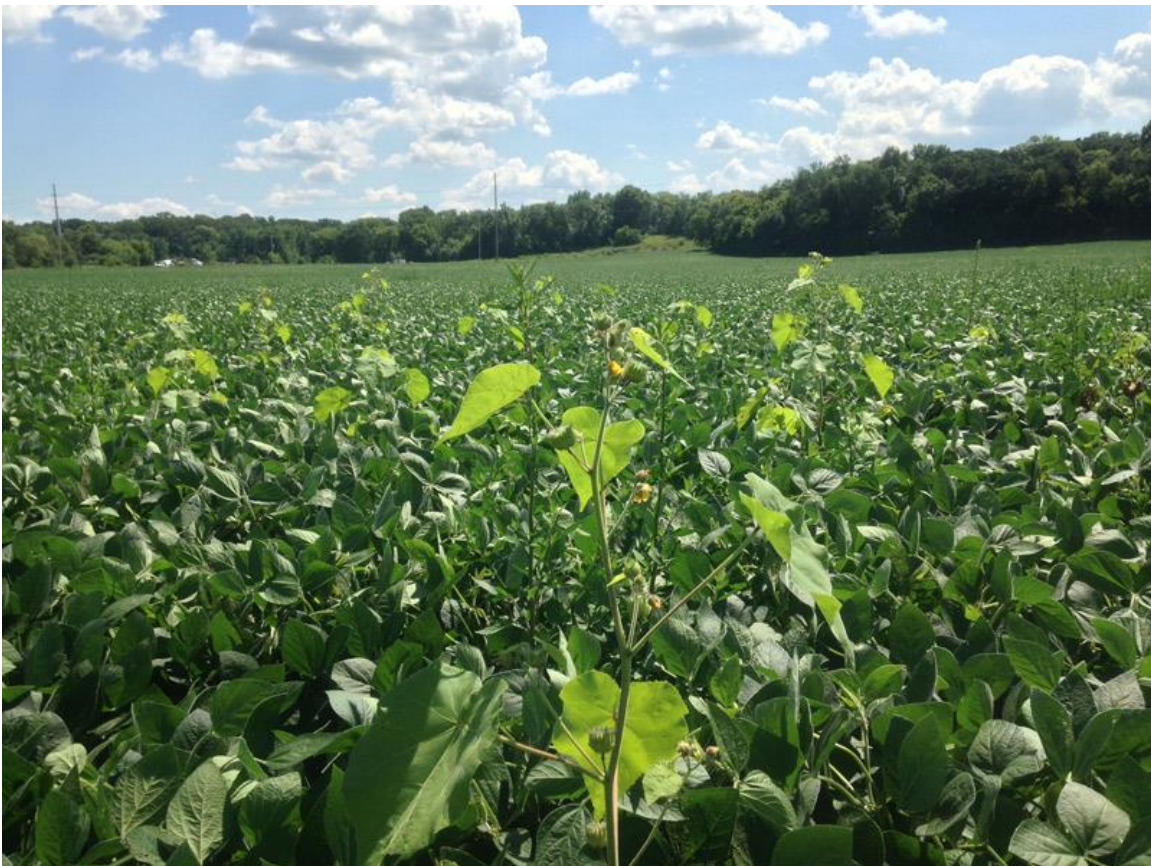
Slika 2.4.3. Europski mračnjak u usjevu soje

smanjila je prinos soje za 27%, dok je u kasnom roku prinos bio smanjen za 14%. Razlog tomu je rapidni porast europskog mračnjaka u ranim razvojnim stadijima te razvoja lisne površine u gornjim dijelovima biljke koji su zasjenili biljku soje i tako joj u začecima rasta i razvoja onemogućili sposobnost usvajanja sunčeve energije. Također gustoća populacije mračnjaka u rasponu od 2,5 do 40 biljaka/ m 2 uzrokovalo je smanjenje suhe težine lišća, stabljike, korijena, mahuna i sjemena soje. Sukladno tomu, došlo je i do smanjenja indeksa lisne površine soje, broja mahuna i prinosa sjemena kada su usjev soje i mračnjak nicali u isto vrijeme. Smanjenje rasta soje uzrokovano velikom gustoćom europskog mračnjaka bilo je manje kada su uvjeti visokog sadržaja vlage u tlu minimizirali učinke na soju jer europski mračnjak nije veliki kompetitor za vodu. Da vrijeme sjetve soje ima veliki utjecaj na europski mračnjak pokazuje kako biljke mračnjaka koje su niknule 21 i 23 dana nakon nicanja soje nisu smanjivale rast usjeva ili prinos (Hagood i sur., 1980.). Lindquist i sur. (1995.) dokazali su kako rano iznikle jedinke europskog mračnjaka u usjevu soje proizvode veći broj sjemena od biljaka koje su kasnije iznikle. Ujedno konkurentnost usjeva soje smanjilo je proizvodnju sjemena mračnjaka za 82%, za razliku od mračnjaka uzgojenog u monokulturi.