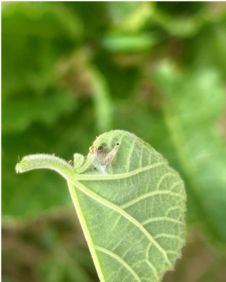
Slika 5.3.4. Gusjenica kukuruznog moljca na naličju lista europskog mračnjaka

segmenta nalaze se četiri okruglaste pjege, iz kojih izbija po jedna dlačica koja naraste do 25 mm. Kukuljica kukuruznog moljca duga je 14 – 16 mm te je smeđe boje (Maceljski i Igrc Barčić, 1999.).