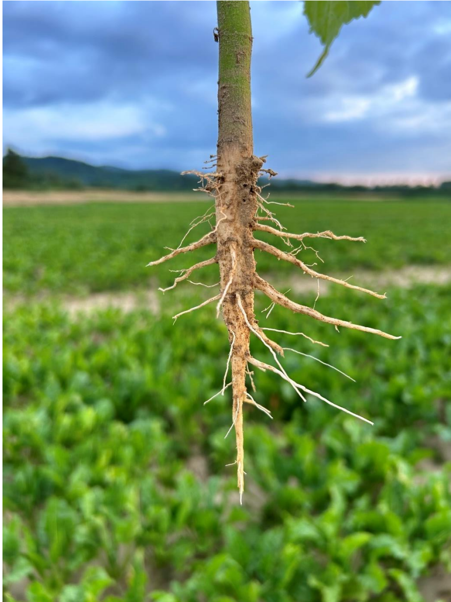
Slika 2.3.4. Razgranat korijenov sustav vrste A. theophrasti