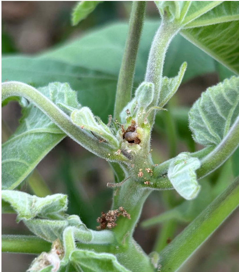
Slika 5.3.5. Gusjenica kukuruznog moljca unutar stabljike europskog mračnjaka