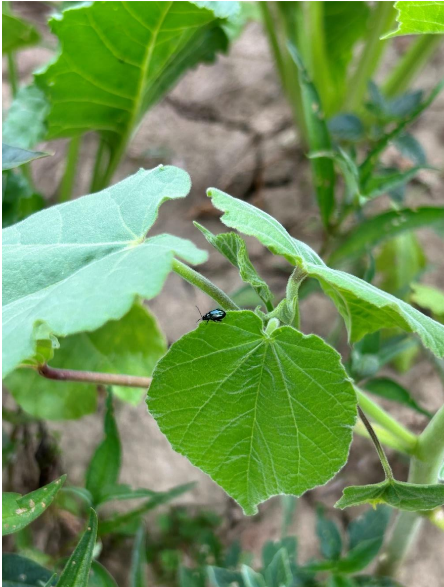
Slika 5.2.3. Phyllotreta spp. na europskom mračajaku

Phyllotreta spp. (Slika 5.2.3.) utvrđena je u srpnju na lokalitetu Bučje na promatranoj korovnoj vrsti. Pregledom 9 biljki europskog mračajaka, utvrđene su 2 jedinke vrste. Vrsta je ustanovljena na listovima i stabljici korovne biljke, no detaljnim pregledom nisu utvrđeni simptomi štete, niti tragovi hranidbe. Stoga ovu vrstu smatramo slučajnom vrstom.