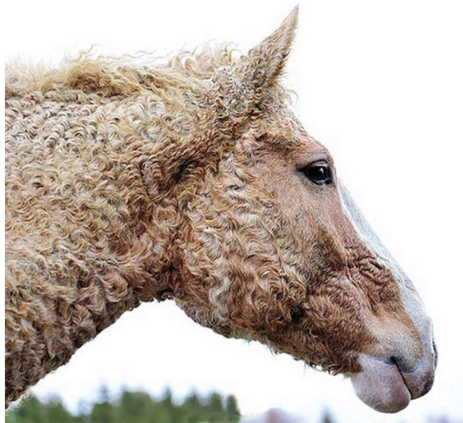
Slika 12. američki kovrčavi bakšir