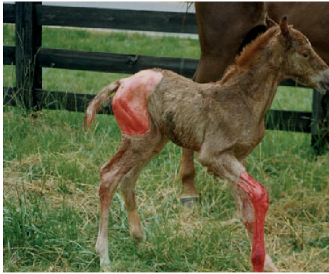
Slika 11. Prikaz ždrijebeta oboljelog bulozom spojne epidermolize

dermalno-epidermalnom spoju. Laminin 5 je heterotrimerni protein koji se sastoji od 3 glikoproteinske podjedinice — \alpha 3 , \beta 3 i \delta 2 lanaca — koje su kodirane genima LAMA3 (laminin podjedinica alfa 3), LAMB3 (laminin podjedinica beta 3) i LAMC2 (laminin podjedinica gama 2) (Graves i sur., 2009.).