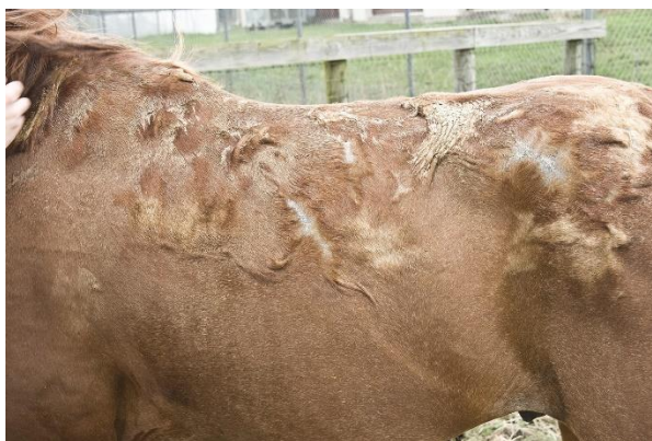
Slika 8. Prikaz dorzalnog dijela tijela konja oboljelog HERD-om.