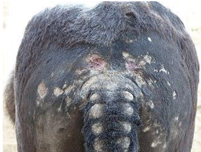
Slika 3. Klinički znakovi preosjetljivosti na ubod insekata (IBH).

Kako navode Schaffartzik i sur. (2012.) preosjetljivost na ubod insekata (IBH) najčešća je alergijska kožna bolest konja u cijelom svijetu. Akutni stadij bolesti uključuje reakciju preosjetljivosti tipa I posredovanu imunoglobulinom E (IgE), ali je tijekom kroničnih stadija vjerojatno prisutna i odgođena reakcija preosjetljivosti tipa IV bolesti. Lindgren i sur. (2020) navode kako su klinički znakovi postupni u početku i sezonski se ponavljaju jer kukci žive samo u toplom razdoblju godine od proljeća do jeseni. Klinički znakovi navedene bolesti prikazani su na slici 3.