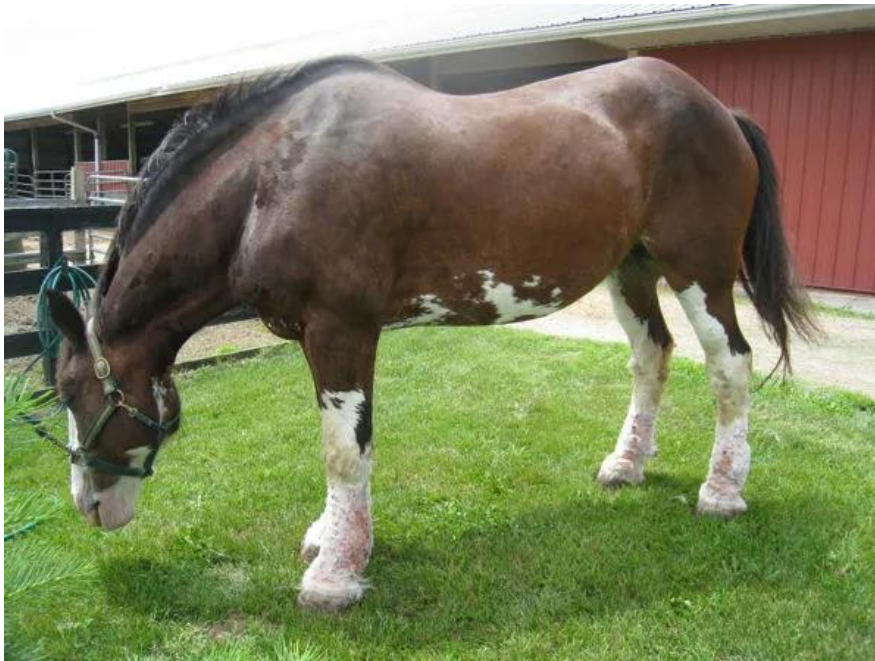
Slika 9. Prikaz konja oboljelog kroničnim progresivnim limfedemom

Prevalencija ove bolesti je oko 96% kod nekih belgijskih i njemačkih pasmina konja. Koeficijenti heritabilnosti za pojavu kliničkih lezija CPL-a kod belgijskih vučnih konja procijenjeni su na 0,26 za konje starije od tri godine, što dovodi do pretpostavke da genetska komponenta ima ulogu u ovoj bolesti (De Keyser i sur., 2014.). Međutim, nijedan od potencijalnih gena za koje je poznato da utječu na Limfedem-distihijazni sindrom i Darier-Whiteovu bolest (Keratosi folikularis) kod ljudi (npr. FOXC2 [Forkhead box C2] i ATP2A2 [ATPaza sarkoplazmatski/endoplazmatski retikulum Ca 2+ transponiran 2]) ne utječu na pojavu CPL-a kod konja (Young i sur., 2007.).