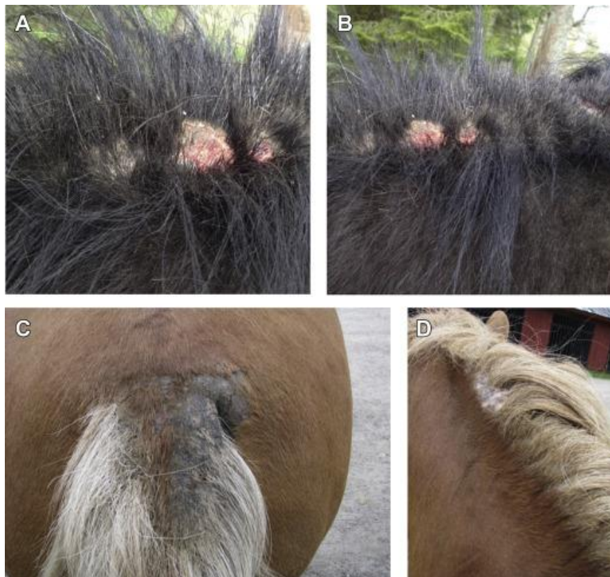
Slika 4. Prikaz kože oboljelog konja IBH na grivi i repu

Prema Andersonu i sur. (2012.) konje koji su oboljeli od IBH-a, a ostavljeni su bez nadzora i adekvatne brige lako se mogu prepoznati po gotovo potpunom gubitku dlake s grive i repa, a kontinuirano češanje može uzrokovati otvorene rane. Slika 4. prikazuje stanje kože zahvaćene bolesti u području grive i repa kod oboljelog konja. Sekundarni simptomi uključuju lihenizaciju, kruste i ljuštenje.