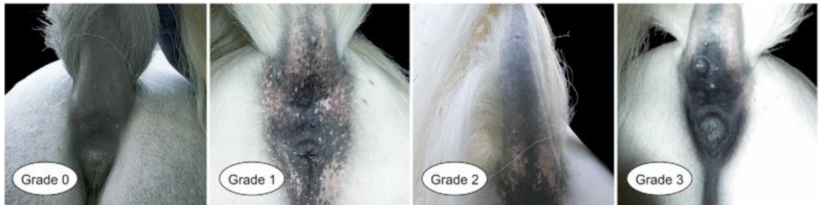
Slika 5. Varijacija stupnja melanoma u četiri siva lipicanska konja.

identifikaciju potencijalnih novih genomskih regija koje bi mogle igrati ulogu u melanomu konja. Potrebne su daljnje studije koje uključuju veće skupine i pažljivu kliničku klasifikaciju slučajeva kako bi se bolje razumjeli složeni genetski i molekularni mehanizmi koji dovode do kožnih bolesti. (Lindgren i sur., 2020) (slika 5.).