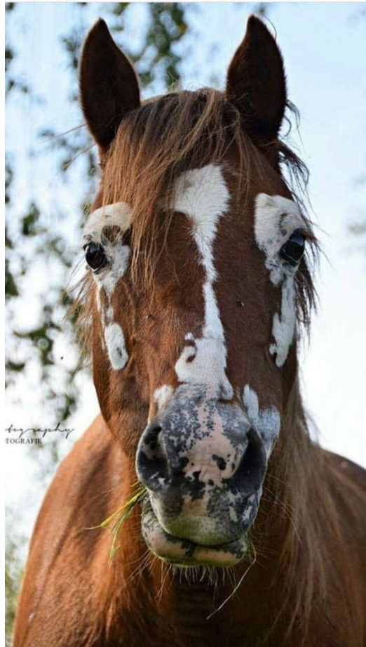
Slika 7. Prikaz glave konja zahvaćene vitiligom