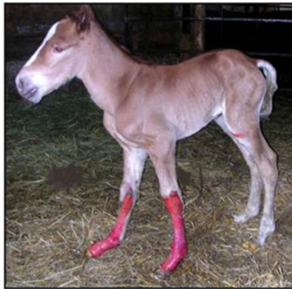
Slika 10. Ždrijebe oboljelo bulozom spojne epidermolize

Buloza spojne epidermolize (Junctional epidermolysis bullosa; JEB) je kožna bolest genetskog podrijetla koja zahvaća novorođenčad. Pojavljuje se kod belgijskih, talijanskih francuskih vučnih konja i američkih sedlastih konja (American Saddlebreds). Ima autosomno recesivni način nasljeđivanja. Slika 10. prikazuje ždrijebe oboljelo od buloze spojne epidermolize. Ova se bolest prvo zvala epithe liogenesis imperfecta, ali kada se pokazalo da se radi o defektu lamina propria, preimenovana je u bulozu spojne epidermolize (Lindgren i sur., 2020).