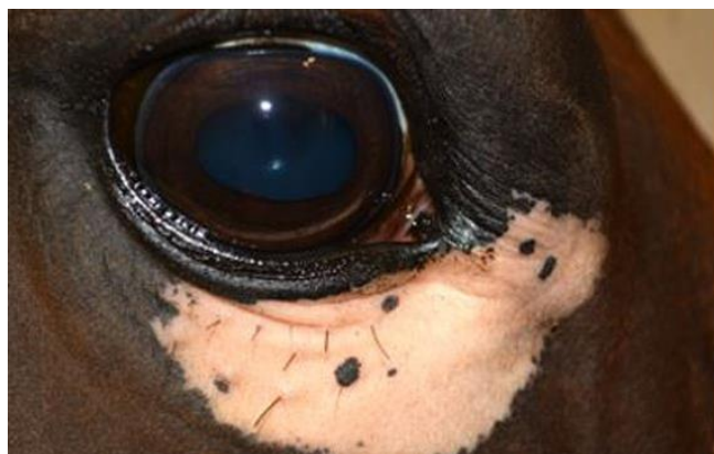
Slika 6. Vitiligo kod konja u predjelu oka

Boja dlake kod konja varira ovisno o pasmini i ovisno o individualnim jedinkama unutar pasmine. Boje dlake kod konja mogu biti vrlo raznolike, poput smeđe, crne, sive, bijele, žute i mnoge druge nijanse i kombinacije navedenih boja. Boja dlake konja nije samo estetski faktor, već može služiti u prepoznavanju pasmina i identifikaciji jedinke. Neke jedinke mogu imati uzorke i oznake na tijelu karakteristične za određenu pasminu. Pojava vitiliga može imati značajan utjecaj na estetiku jedinke. Svaka jedinka ima jedinstvenu pojavu ovog stanja. Mrlje se mogu pojaviti na različitim dijelovima tijela u potpuno različitim oblicima i veličinama.