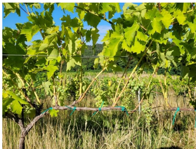
Slika 4. Prikaz defoliranih trsova