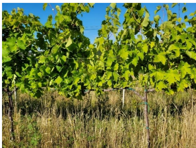
Slika 3. Prikaz kontrolnih trsova

Pokus je postavljen po slučajnom bloknom rasporedu. Blok čini 8 trsova. Pokus je sastavljen od dva tretmana- djelomična defolijacija i kontrola, a svaki tretman ima 3 ponavljanja. Tretman djelomične defolijacije proveden je u fazi zametanja bobica, što odgovara 29. stadiju prema modificiranoj E-L skali (Coombe, 1995). Pokus se sastojao od dvije vrste tretmana: tretman s djelomičnom defolijacijom i tretman bez djelomične defolijacije odnosno kontrola. Djelomična defolijacija obavila se 8. srpnja 2022. Lisna površina izračunata je pomoću metode Lopes i Pinto (2005) za svaku lozu u eksperimentu. U trenutku pune zrelosti su sva ponavljanja zasebno pobrana, dana 31.8.2022. Određeni su elementi rodosti: prinos po trsu, prosječna masa grozda te prosječni broj grozdova po trsu. Sa svakoga trsa u pokusu pobrojani su grozdovi i izvagana njihova ukupna masa iz čega se dobila prosječna masa grozda.