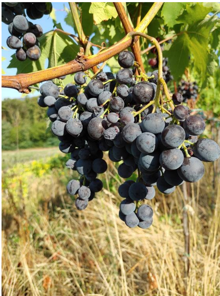
Slika 1. Grozd 'Muškat Hamburga'

osjetljivost na pepelnicu od koje najčešće strada. Ova sorta preferira umjereno plodna, umjereno vlažna, propusna i topla tla. Preporučuje se uzgoj na južno, južno – zapadnoj ekspoziciji. Prema Korenici (1982) važno je voditi brigu o klimatu, ekspoziciji, nadmorskoj visini i potencijalnim zasjenjivanjima terena radi vrlo visoke osjetljivosti ove sorte na niske temperature. Sadržaji šećera variraju od 19,0% pa do 24,0%, dok kiseline od 6,5% do 7,0%.