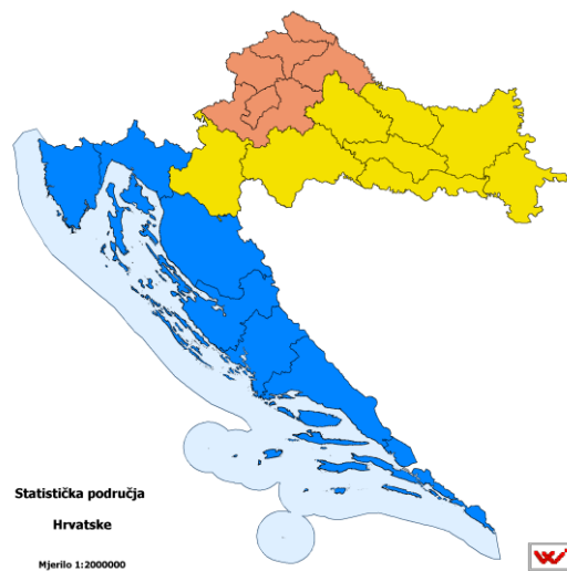
Slika 2.2. Prikaz statističkih područja Hrvatske

Međimurska županija. Ukupno sjeverozapadna Hrvatska obuhvaća 29 gradova i 116 općina ( https://hr.wikipedia.org/wiki/Sjeverozapadna_Hrvatska ).