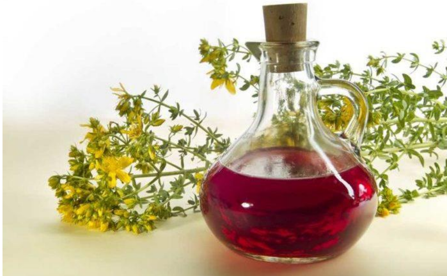
Slika 4.2. Kantarion – ulje od cvjetova Hypericum perforatum L.

cvjetova gospine trave ( Hypericum perforatum L.) koji su se stavljali u ulje (Slika 4.2.), a stanični se sok rosopasa ( Chelidonium majus L.) koristio za uklanjanje bradavica (Blagec, 2020.).