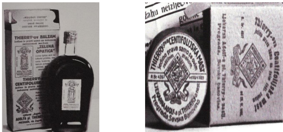
Slika 3.2. Thierryev balzam i centifolijska mast– zelena opatica

Prema preporuci sam Thierryev balzam najuspješnije djeluje kod slabe probave, kod podrigivanja, žgaravice, nadutosti, pravljena kiseline, pomanjkanja teka, grčeva, želučanog i crijevnog katara, osjećaja slabosti, kašlja, hripavosti i ostalih prsnih bolesti. Može se koristiti i protiv zubobolje, za odstranjivanje gnoja, kod upala grla, protiv raznih rana i kao sredstvo za ublažavanje boli. Koristi se tako da se uzima jedna žličica balzama više puta na dan kod odraslih dok se djeci nakapa 20 kapi balzama na šećer (Inić i Flegar, 2021.).