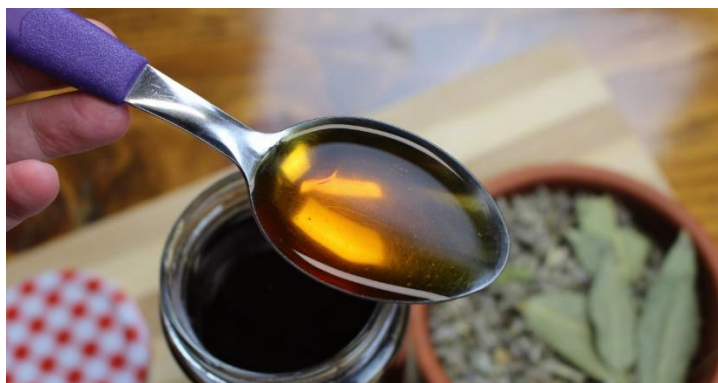
Slika 4.5. Ljekoviti lovorov sirup protiv kašlja

Gotovo da nema tradicionalnog jela koje je moguće pripremiti bez samoniklog bilja. To se odnosi na dodavanje ukusnog začinskog bilja koje svojim eteričnim komponentama daje hrani posebnu aromu i okus, a jednako je bitna i njihova ljekovitost (Kuštrak, 2005.). Takvo začinsko bilje koristi se osušeno ili svježe. Lovor ( Laurus nobilis L.) je začinska i ljekovita biljka koja se obično koristi kao začim u cijeloj hrvatskoj. Najčešće se koristi list, međutim, na Cresu i Rabu postoji tradicija izrade sirupa protiv kašlja (Slika 4.5.) od njegovih plodova i korištenje lovorovog ulja ("lumberovo ulje") u ljekovite svrhe, posebno kao sredstvo za vanjsku primjenu (Łuczaj, 2021.).