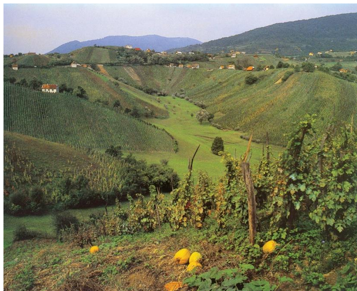
Slika 2.1: Prigorje Plešivice, gorja jugozapadno od Zagreba, dio je brežuljkastoga peripanonskog ruba.

Kontinentalna Hrvatska je pretežno nizinska, a iz nizine se izdižu šumovita gorja s visinama nižim od 1000 m (Psunj, Papuk, Krndija). Rubni dio Panonske nizine prelazi u brežuljkasti peripanonski prostor sa znatnijim udjelom gorja koja negdje prelaze 1000 m nadmorske visine (Medvednica, Ivančica, Žumberačka gora) (Slika 2.1.). To je brežuljkasti kraj u kojem se ističu tri glavne sastavnice: gore, pobrđa i riječne doline. Gore se ističu visinom, izgledom i sastavom te su većinom prekrivene šumom.