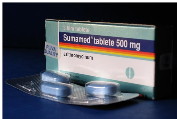
Slika 3.6. Sumamed – najpoznatiji Plivin antibiotik

Do prije dvadesetak godina Pliva je bila kompanija koja je oko 75 posto prihoda od proizvodnje lijekova ostvarivala na domaćem tržištu. Pliva je iz lokalne prerasla u snažnu regionalnu kompaniju i postala jedan od najpoznatijih brendova u regiji Srednje i Istočne Europe. Devedesetih je u tijeku jedan od većih investicijskih ciklusa: tih su godina otvoreni novi pogoni za proizvodnju azitromicina u Savskom Marofu i suhih oralnih oblika lijekova u Zagrebu te Novi istraživački institut, a dominantna odrednica Plivinog poslovanja je njegova internacionalizacija. 2006. godine, Pliva ulazi u sastav američkog Barra, a do nove promjene vlasnika dolazi 2008. godine kada Pliva postaje dijelom izraelske Teve. Pliva, danas članica Teva grupe, najveća je farmaceutska kompanija u Hrvatskoj i vodeća u regiji Južna i Istočna Europa kako se navodi na službenim internetskim stranicama Plive ( https://www.pliva.hr/about-pliva/our-history/ ).