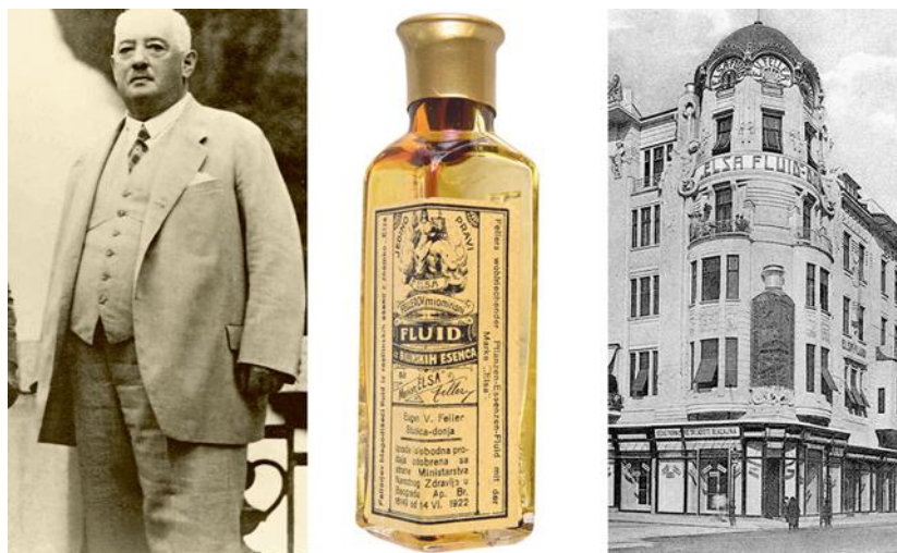
Slika 3.4. Ljekarnik Eugen Viktor Feller, poznati preprat Elsa-fluid i Fellerova zgrada u Zagrebu na uglu Jelačićeva trga i Jurišićeve ulice s velikom reklamom u obliku bočice Elsa-fluida na pročelju zgrade