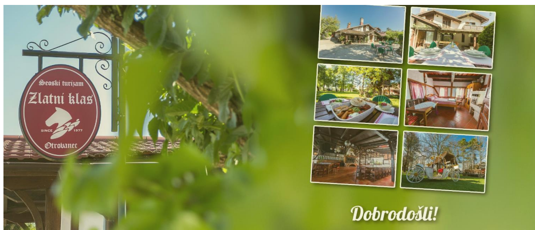
Slika 3.7. Restoran Zlatni klas u naselju Otrovanec (kod Virovitice)

je namijenjena Turcima i njihovim konjima. Konji koji su pili vodu iz jezera otrovali su se i uginuli, a dosta je i vojnika pilo otrovnu vodu. Turci su se uplašili i počeli bježati na istok, a selo je dobilo naziv Otrovanec. Na toj legendi razvija se i ugostiteljski objekt „Zlatni klas“ koji već godinama uspješno posluje (Slika 3.7.), i nudi tradicionalna jela od samoniklog bilja, od kojih se najviše ističe upotreba koprive za izradu tjestenine, kruha, valjušaka od krumpira, raznih umaka i sl.