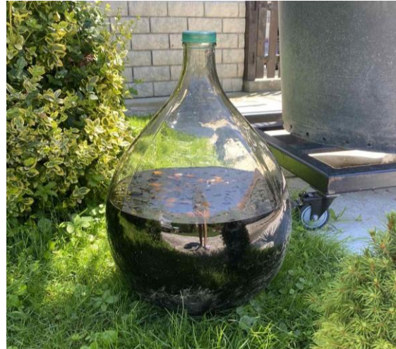
Slika 4.4. Ljekoviti liker od drijena i Ljekoviti liker od oraha – orahovac

Gotovo da nema tradicionalnog jela koje je moguće pripremiti bez samoniklog bilja. To se odnosi na dodavanje ukusnog začinskog bilja koje svojim eteričnim komponentama daje hrani posebnu aromu i okus, a jednako je bitna i njihova ljekovitost (Kuštrak, 2005.). Takvo začinsko bilje koristi se osušeno ili svježe. Lovor ( Laurus nobilis L.) je začinska i ljekovita biljka koja se obično koristi kao začim u cijeloj hrvatskoj. Najčešće se koristi list, međutim, na Cresu i Rabu postoji tradicija izrade sirupa protiv kašlja (Slika 4.5.) od njegovih plodova i korištenje lovorovog ulja ("lumberovo ulje") u ljekovite svrhe, posebno kao sredstvo za vanjsku primjenu (Łuczaj, 2021.).