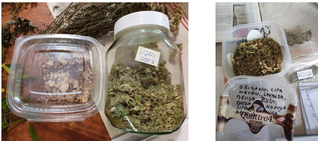
Slika 4.1. Sušeni bijeli sljez za čaj i mješavina bilja za čaj (origano, lipa, neven, lavanda, matičnjak, ruža, bazga, kadulja, šipak, kamilica, aronija)