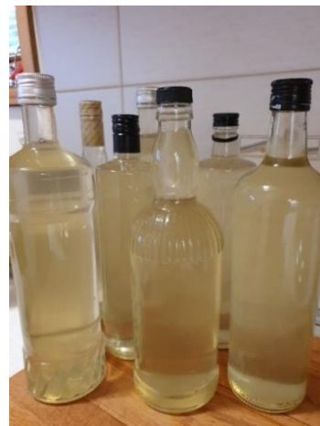
Slika 4.3. Priprema sirupa od bazge

Vrlo česta upotreba samoniklog bilja je bila za pripremu alkoholnih pića. Prema istraživanju Blagec (2020) najviše su se u SZ Hrvatskoj koristile vrste: pelin ( Artemisia absinthium L.), orah ( Juglans regia L.), divlja kruška ( Pyrus pyraster (L.) Burgsd.), loza ( Vitis vinifera L.), drijen ( Cornus mas L.) i malina ( Rubus idaeus L.). Bilje se koristilo za pripremu rakija, likera ili vina. Recept za liker od oraħa u Prilozima (Slika 4.4.). Pića su se radila u obliku svježeg soka, sirupa, čaja ili alkoholnog pića. Ljudi su ih koristili kao okrjepu u napornom fizičkom poslu