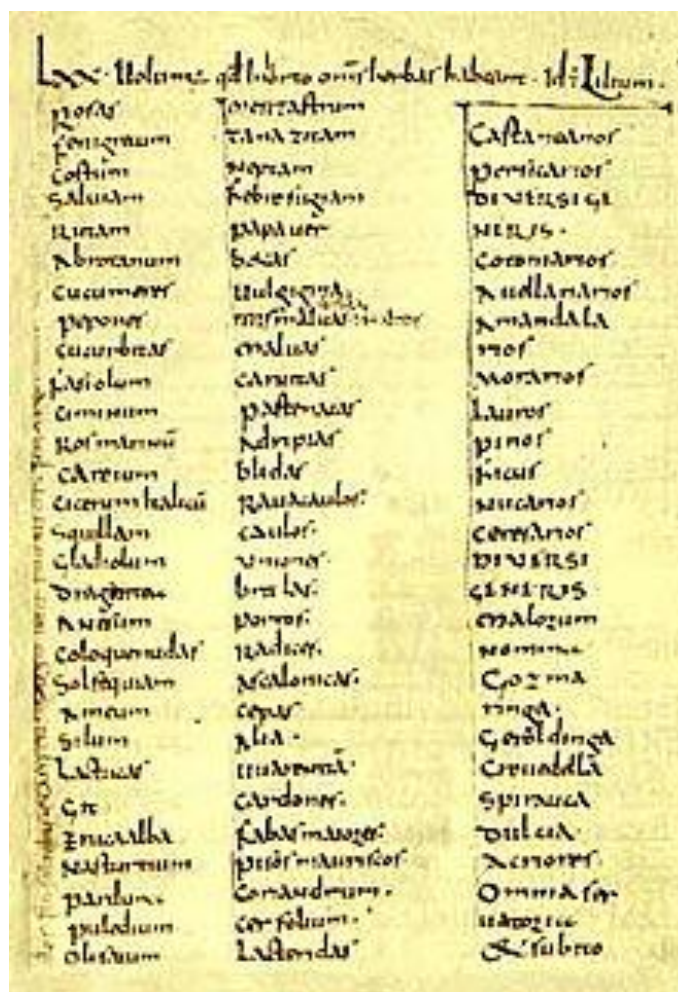
Slika 3.1. Poglavlje iz djela Karla Velikog - Capitulare de villis vel curtis imperii

Karlo Veliki (742. – 814.) je u svom djelu „ Capitulare de villis “ opisao upute za uzgoj ljekovitog bilja i time potaknuo njegovu primjenu (Slika 3.1.). Također, benediktinci su tijekom 6. stoljeća počeli uzgajati ljekovito bilje (Kolak i sur., 1997.). U susjednoj Bosni i Hercegovini franjevci su koristili biljke za liječenje već od 13. stoljeća, a takva praksa se održala sve do početka 20. stoljeća. Franjevci su se služili raznim knjigama, kodeksima i nabavljali lijekove iz Italije i Dubrovačke Republike (Mandić i Tomić, 2020.).