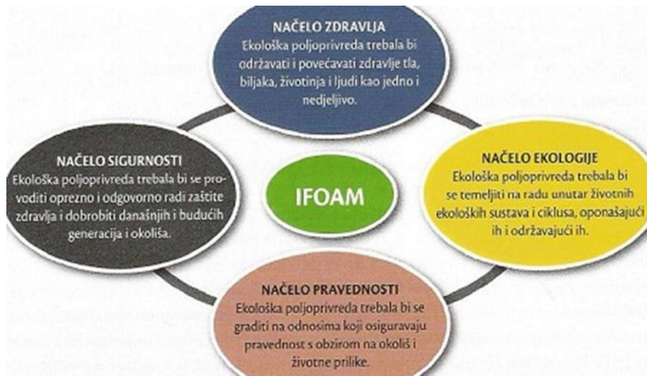
Slika 1. Načela ekološke poljoprivredne