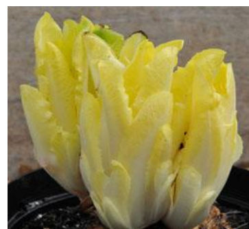
Slika 9. Tip Witloof (Web 9)

Od sorata zelenih listova za rez najrašireniji tip je Tržaški solatnik. Od glavatog radiča izduženih zelenih glavica najviše se uzgajaju sorte Pan di Zucchero, a od glavatog radiča glavice crvene boje sorte u tipu Palla rossa (Slika 10).