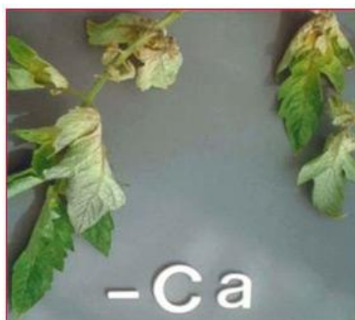
Slika 12. Nedostatak kalcija – uvijanje lišća