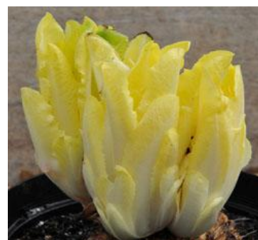
Slika 9. Tip Witloof (Web 9)

Od sorata zelenih listova za rez najrašireniji tip je Tržaški solatnik. Od glavatog radiča izduženih zelenih glavica najviše se uzgajaju sorte Pan di Zucchero, a od glavatog radiča glavice crvene boje sorte u tipu Palla rossa (Slika 10).