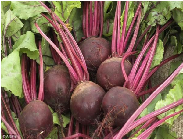
Slika 1. Cikla ( Beta vulgaris var. conditiva Alef.), (Web 1)