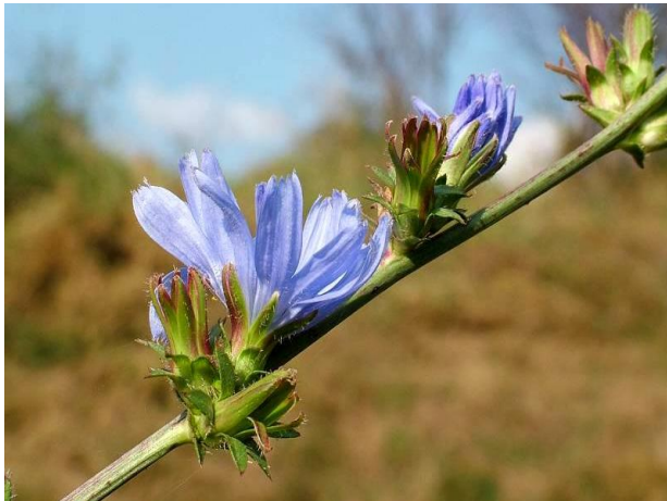
Slika 5. Cvjetovi radiča (Web 5)