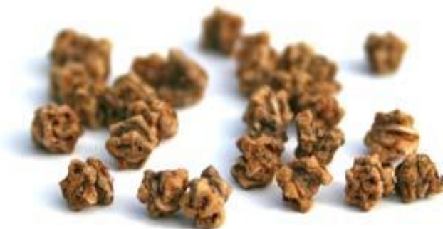
Slika 3. Sjeme cikle (Web 3)

Plod je klupko, koje nastaje srastanjem čaške i perikarpa svih oplodjenih cvjetova na koljencu, pa obično ima više sjemenki. Plodovi se koriste kao sjeme (Slika 3) pa se iz jednog klupka može razviti više biljaka (Lešić i sur., 2002).