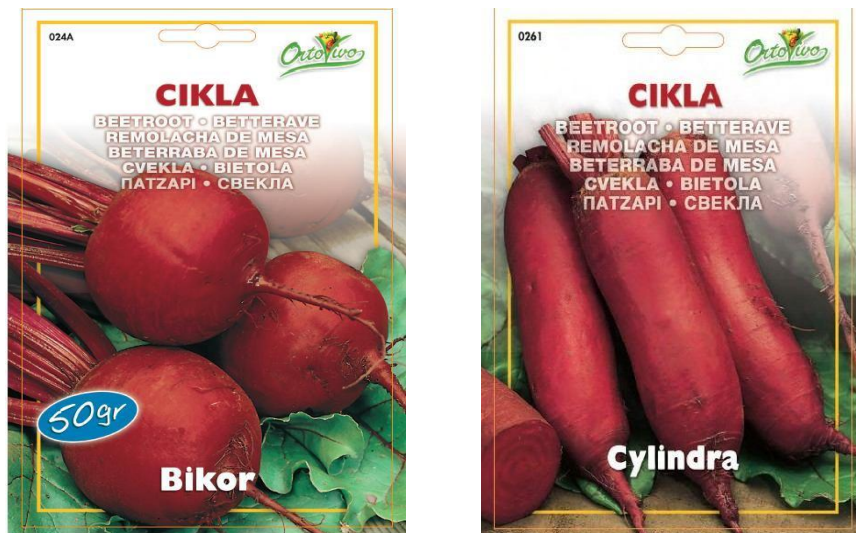
Slika 4. Cikla, sorta Bikor, Cylindra (Web 4)

Srednje rana sorta cikle je Bikor (Slika 4), u srednje rane sorte i rane hibride ubrajaju se Libero, Warrior F1, Bonel, Bikores, Nero i Pablo F1, a srednje kasna sorta je Cylindra (Slika 4). Bikor je srednje rana sorta pravilnog okruglog korijena tamnocrvene boje. Svjetliji krugovi nisu značajno izraženi, lisna rozeta je mala, a rep korijena tanak. Osnovna namjena uzgoja je za preradu (Matotan, 2004).