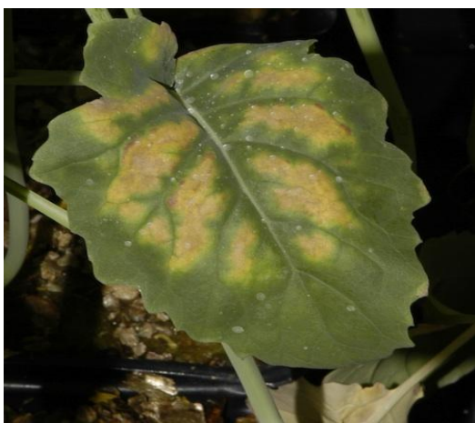
Slika 11. Nedostatak kalcija – kloroza (Web 11)

Općenito se nedostaci kalcija prvo zapažaju na mladom lišću kao kloroza (Slika 11). Biljka sporije raste, ima grmolik izgled i usporen je razvitak korijena. U kasnijim fazama nedostatka kalcija zapaža se nekroza mlađeg lišća, a lišće se često i uvija (Slika 12). Javljaju se tamnosmeđe zone s odrvenjelim i začepjenim provodnim žilama, a boja potječe od melaninskih tvari nastalih oksidacijom slobodnih fenola (koji se inače stabiliziraju u obliku Ca – kelata) u kinone. Polen je slabe klijavosti. Latentna i akutna pomanjkanja kalcija u biljkama uzrokovana su uglavnom lošom translokacijom kalcija do vršnog meristema, cvjetova, plodova te su češća u plodovima. Dobar su primjer gorke pjege kod jabuka, trulež ruba cvijeta kod rajčice i dr. (Tadić, 2005). Kako je kalcij potreban za čvrstoću stanične stijenke i održavanje integriteta membrane, nedostatak kalcija vodi do propadanja stanica što rezultira i osjetljivošću tkiva na sekundarne infekcije, kao što su Phytophthora spp. , Erwinia spp. i Botrytis spp. (Napier i Combrink, 2006).