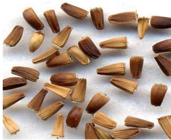
Slika 6. Sjeme radiča (Web 6)