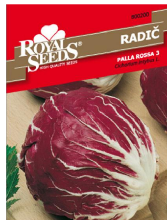
Slika 10. Radič, sorte Tržaški solatnik, Pan di Zucchero, Palla rossa (Web 10)