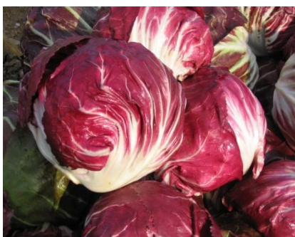
Slika 8. Glavati radič (Web 8)