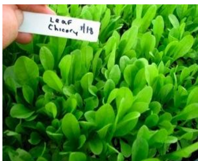
Slika 7. Lisnati radič (Web 7)