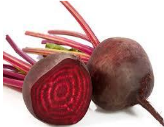
Slika 2. Koncentrični krugovi na presjeku zadebljalog hipokotila cikle (Web 2)

Listovi su na duljim ili kraćim peteljkaama i čine rozetu. Plojka je ovalna, glatka, sjajna s ravnim ili valovitim rubom, a može biti zelene, crvene ili djelomično crvene boje. U drugoj godini vegetacije, cikla razvije razgranatu cvjetnu stabljiku 0,8 do 1,5 m visoku (Lešić i sur., 2002). U slučaju niskih temperatura i ranije sjetve do cvjetanja dolazi u prvoj godini (Vogel, 1996). Cvjetovi su sitni, pentamerni, hermafroditni, smješteni u pazušcima pricvjetnih listova na granama, a oprašuju se vjetrom.