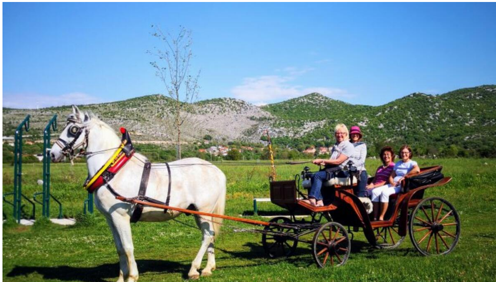
Slika 10. Turisti u vožnji kočijom kroz Dugopolje

Na području općine, u svrhu aktivnog odmora, odnedavno je uvedeno i jahanje konja te vožnja kočijom. U ponudi su ture i obilasci dugopoljskih vinograda i voćnjaka za iskusne jahače i početnike. Jednako tako, svi oni koji ne žele jahati, ali žele doživjeti vožnju "viktorijanskom" kočijom imaju priliku za stjecanjem vrijednog iskustva uz zanimljive priče iz prošlosti Dugopolja i upoznavanje s tradicijom ovog kraja. Obilazak kočijom provodi se uz licenciranog turističkog vodiča koji se služi engleskim, njemačkim, ruskim i talijanskim jezikom.