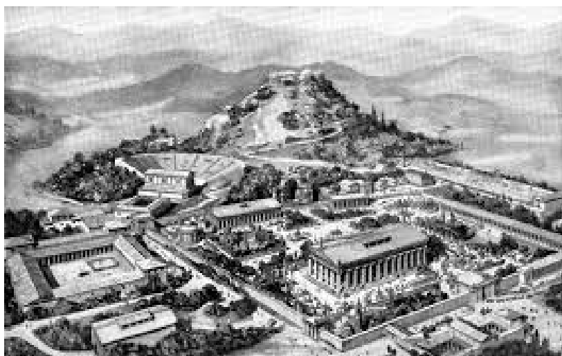
Slika 3. Olimp- mjesto održavanja Olimpijskih igara