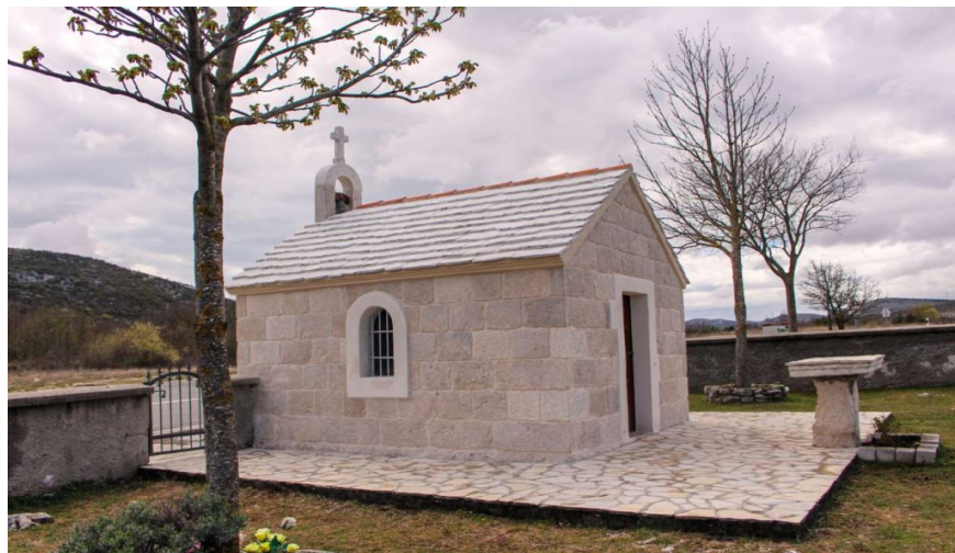
Slika 22. Kapelica Gospe u dnu polja