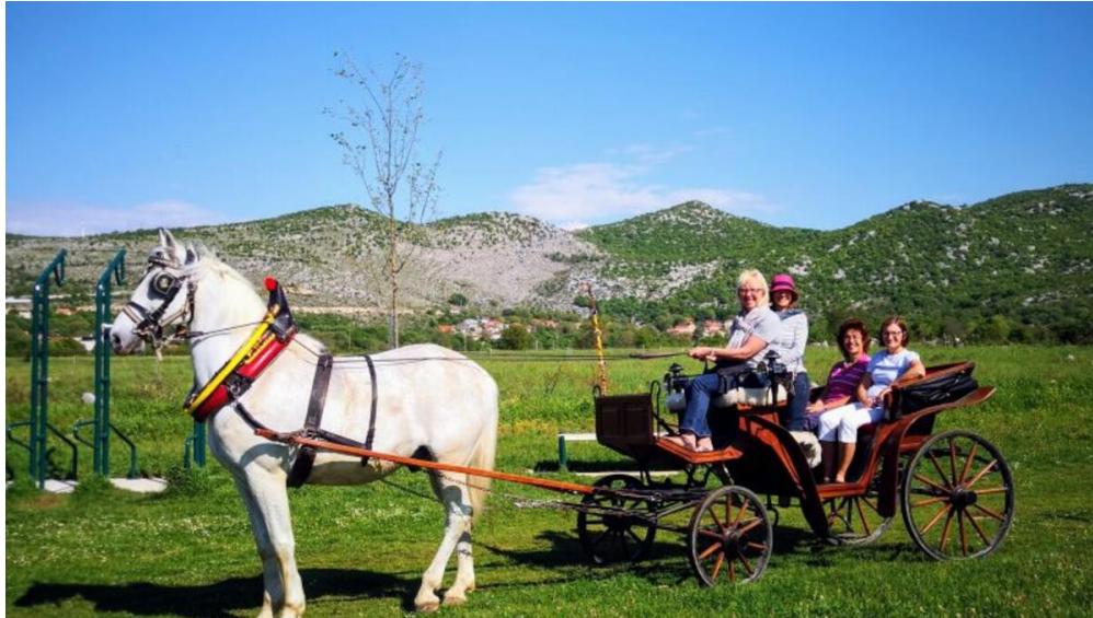
Slika 10. Turisti u vožnji kočijom kroz Dugopolje

Na području općine, u svrhu aktivnog odmora, oдавно je uvedeno i jahanje konja te vožnja kočijom. U ponudi su ture i obilasci dugopoljskih vinograda i voćnjaka za iskusne jahače i početnike. Jednako tako, svi oni koji ne žele jahati, ali žele doživjeti vožnju "viktorijanskom" kočijom imaju priliku za stjecanjem vrijednog iskustva uz zanimljive priče iz prošlosti Dugopolja i upoznavanje s tradicijom ovog kraja. Obilazak kočijom provodi se uz licenciranog turističkog vodiča koji se služi engleskim, njemačkim, ruskim i talijanskim jezikom.