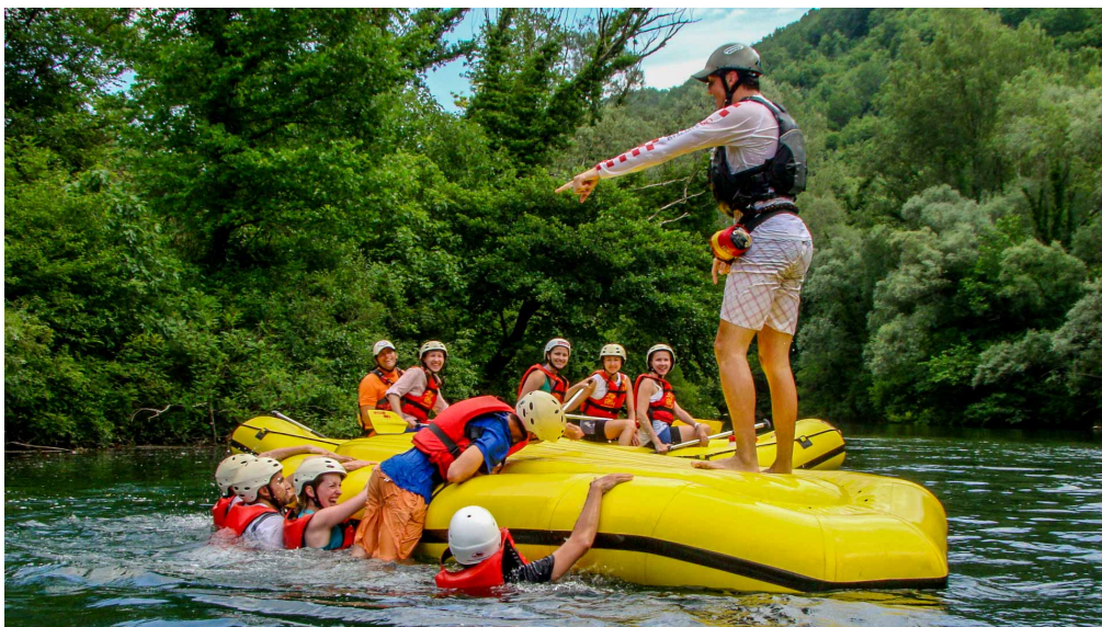
Slika 9. Rafting na Cetini

Planinarenje se može dodatno razvijati budući da je odabrana destinacija smještena na padinama Mosora. Uz Mosor, tu su i Biokovo, Kozjak i Svilaja koje su smještene unutar 30 km od destinacije. Paintball je na ovom području dosta zastupljen i već sada privlači velik broj domaćih turista. Na kanjonu rijeke Cetine, koja je udaljena 40-ak kilometara od Dugopolja, odvija se rafting (Slika 9.), a na istom je području dostupan i zipline.