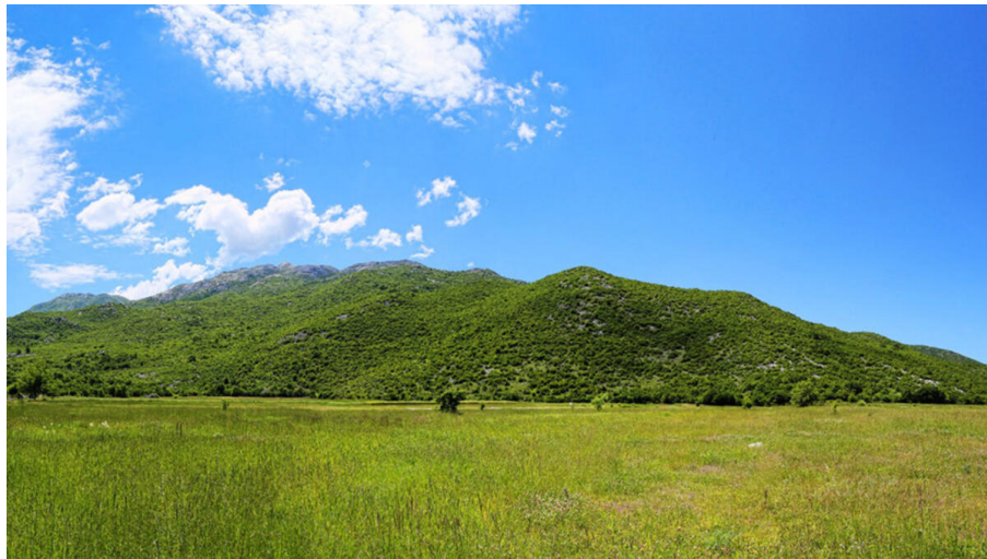
Slika 15. Mosor i dugopoljsko polje

endemičnim vrstama. Upravljanjem, čišćenjem i održavanjem staza bavi se Hrvatsko planinarsko društvo "Ljubljani" iz Dugopolja.