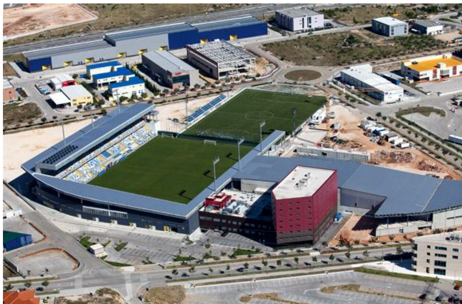
Slika 8. Stadion "Hrvatski vitezovi"

NK Dugopolje je nogometni klub iz Dugopolja koji se trenutno natječe u 2. HNL. Klub je osnovan 1952. godine pod imenom NK Proleter, a potkraj 1990. godine preimenovan je u sadašnje ime. Svoje domaće utakmice klub igra na stadionu Hrvatski vitezovi (Slika 8.), koji ima kapacitet za 5200 gledatelja. Stadion je smješten u gospodarskoj zoni Podi te je mjesto održavanja brojnih priprema, turnira, akademija i nogometnih škola domaćih i inozemnih klubova. Službeno je otvoren 22. srpnja 2009. godine prijateljskom utakmicom između NK Dugopolje i HNK Hajduk Split. Za izgradnju i uređenje samog stadiona uloženo je oko 70 milijuna kuna, a uz bazene i teniske terene čini dio Sportskog centra Hrvatski vitezovi. Stadion je u lipnju 2009. posjećen od strane UEFA-ina komisije koja je isti ocijenila kao odličan te odobrila igranje europskih utakmica u Dugopolju.