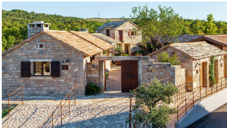
Slika 23. Etno-agro park Stella croatica

Izvor: https://stella-croatica-etno-selo