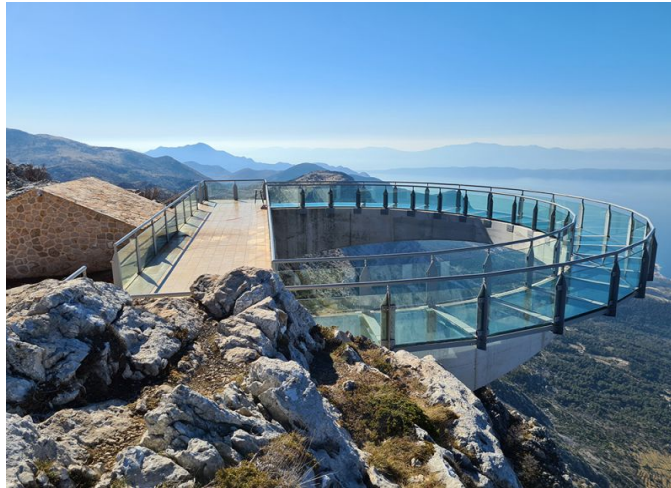
Slika 30. Skywalk Biokovo