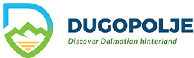
Slika 32. Logo- Posjetite Dugopolje

Dugopolje, tj. odabrana destinacija, idealna je destinacija za spoj ruralnog turizma i sportske rekreacije. Razvoju istog pogoduju klima, prometni položaj, prirodna i kulturna baština, relativna blizina mora, lokalni eno- gastro specijaliteti, Eurovelo ruta 8, športski centar "Hrvatski vitezovi", izletišta Dračanica, jednako kao i planina Mosor na čijem je podnožju sama destinacija i smještena. Kako bi potencijal u potpunosti bio iskorišten na najbolji mogući način, potrebno je proširiti ponudu, informirati domaće stanovništvo o selektivnim oblicima turizma te podići kapacitet lokalnih zajednica za izradu razvojnih projekata. Dobra promocija putem e-marketinga te edukacija i osposobljavanje lokalnog stanovništva odigrati će ključnu ulogu u ovom projektu. U ruralnom turizmu, na zadovoljstvo i cjelokupni dojam turista u velikom postotku utječu ljubaznost domaćina na gospodarstvu, stoga će i to biti jedan od ključnih čimbenika koji će doprinijeti što većoj posjećenosti i interesu šire populacije. Turisti će imati priliku jahati, biciklirati, šetati, planinariti, obilaziti kulturne i povijesne spomenike ovog kraja, uživati u gastronomiji, itd. Sami potencijal je velik, stoga je istog potrebno iskoristiti u potpunosti.