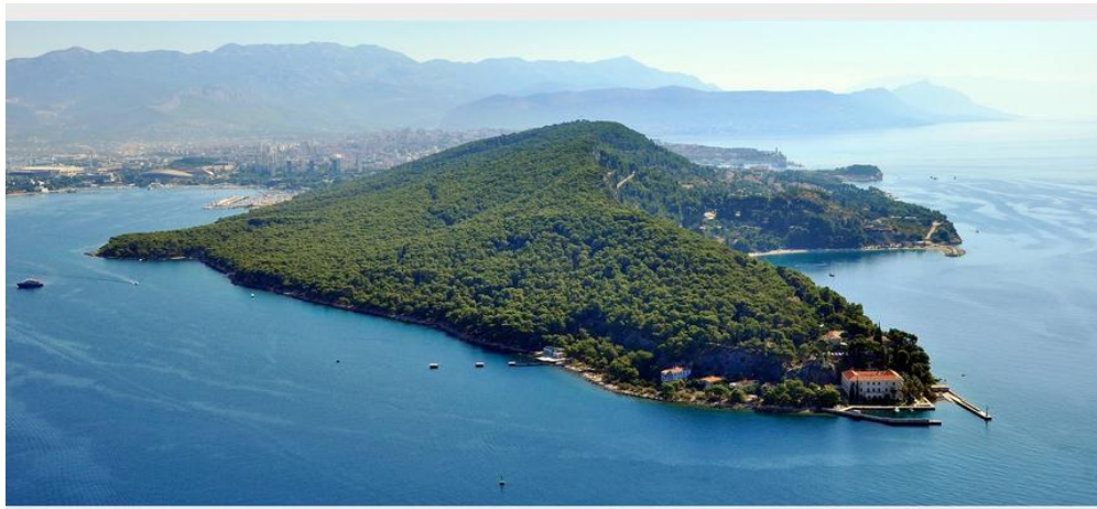
Slika 25. Marjan