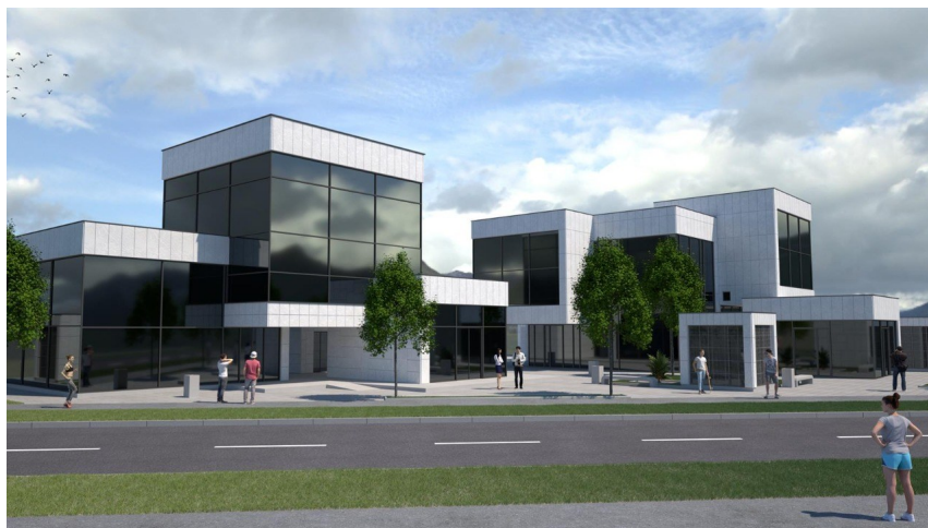
Slika 18. Centar za posjetitelje “Skrivena Dalmacija”

Centar za posjetitelje “Skrivena Dalmacija” nova je turistička atrakcija, smještena u Gospodarskoj zoni Podi, čiji je fokus usmjeren na kreiranje ponude za cjelogodišnji turizam. Osim tog primarnog cilja, centar će služiti kao polazna točka outdoor turističke ponude zaleđa Splitsko- dalmatinske županije. Outdoor turistička ponuda, jednako kao i niz ostalih atrakcija, u obuhvatu prostora od Vrlike do Vrgorca, posjetiteljima će biti predstavljeni kroz brend “Skrivena Dalmacija”. Cilj novonastalog brenda je valorizacija i veća vidljivost turističke ponude područja Dalmatinske zagore stranom i domaćem tržištu. Centar će nastojati na edukativan i inovativan način prikazati sve blagodati i raznolikost područja kojeg sami projekt obuhvaća. Zahvaljujući Centru, općina Dugopolje i ostatak Splitsko- dalmatinske županije, imati će priliku za dugoočekivani i zasluženi razvoj cjelogodišnjeg turizma.