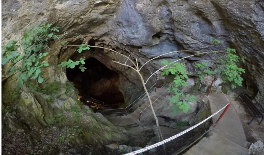
Slika 12. Špilja Vranjača izvana