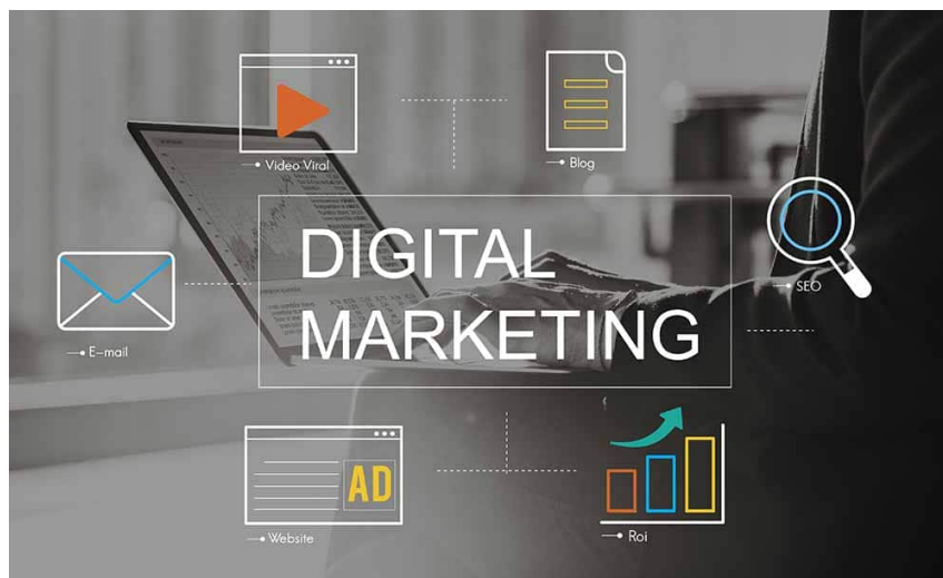
Slika 19. Digitalni marketing

spriječit će se problemi devastiranja okoliša, komunalnog nereda i zagađivanja samih resursa. Zajednički trud i rad donijet će rezultat koji će biti na dobrobit svima, kako domaćem stanovništvu, tako i turistima.