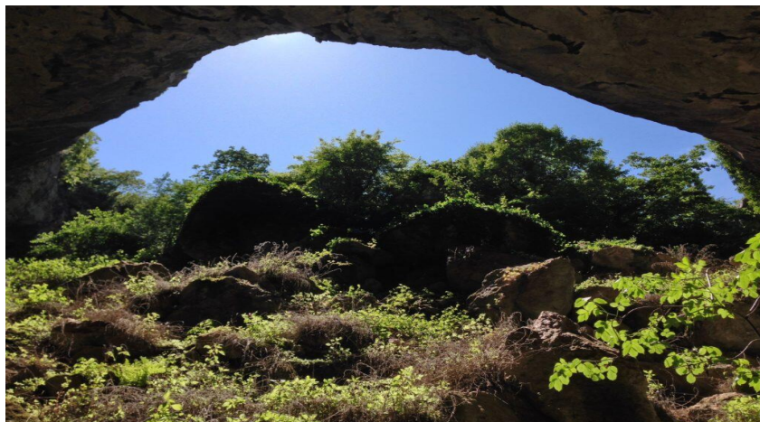
Slika 13. Kraljeva peć

Manje poznata turistima, ali jednako tako vrijedna je i Kraljeva peć (Slika 13.). Špilja je na nekim planinarskim kartama ucrtana kao 'Balića peć'. Kao i Vranjača, peć je smještena na sjevernom dijelu Mosora. Specifična je po ulazu širokom oko 40 metara i visokom 20-30 metara te dubini od 110 metara. Ne obiluje špiljskim ukrasima, ali je dio iste prekriven grmljem i vegetacijom. Faunu Kraljeve peći tvori nekoliko zanimljivih zajednica. Ona je dom kultiviranim pčelama koje su svoje stanište sagradile visoko i u hladu kamena peći. Također, stanište je i dviju vrsta endemskih puževa. Massarilatzeria dugopoljica je novootkrivena vrsta stonoge koja je pronađena upravo ovdje te je pobliže opisana i objavljena u jednom znanstvenom časopisu. Uz navedene vrste, Kraljeva peć je stanište i za sove i 8 različitih vrsta šišmiša. Staze unutar špilje još uvijek nisu uređene, no većinski dio špilje dostupan je planinarima- amaterima.