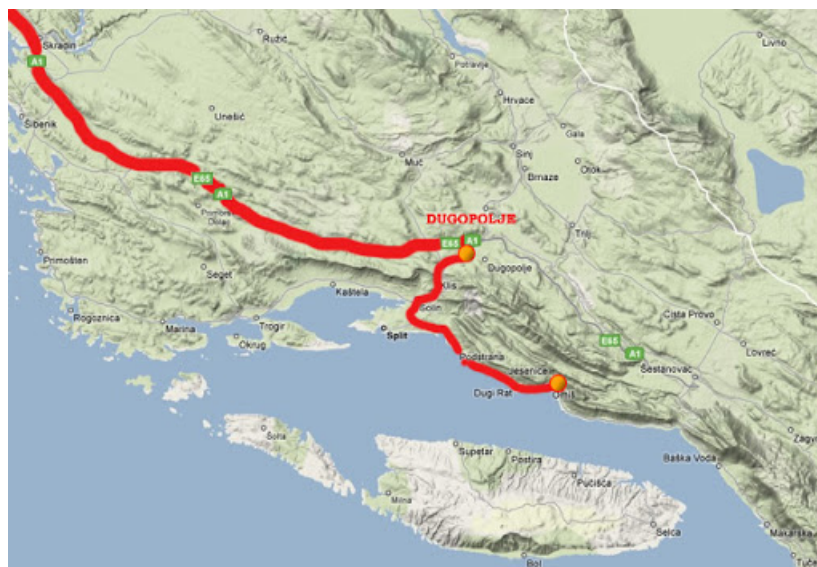
Slika 5. Prikaz Dugopolja na karti

Državna cesta D1 spaja općinu sa Solinom, Splitom i Trogirom prema jugu, te Dicmom, Sinjem i Kninom prema sjeveru. Klima ovog područja je umjereno topla vlažna, te je kao takva idealna za razvoj ruralnog turizma. Sama općina je poznata kao jedna od najvećih poslovnih zona u Hrvatskoj te broji otprilike 4000 stanovnika. Poljoprivreda je zastupljena, no još uvijek se njome bavi pretežno starije stanovništvo. Uzgaja se velik broj povrtnih (krumpir, kupus, rajčica, krastavac, itd.) i voćnih (vinova loza, maslina, višnja, trešnja, šljiva, itd.) vrsta.