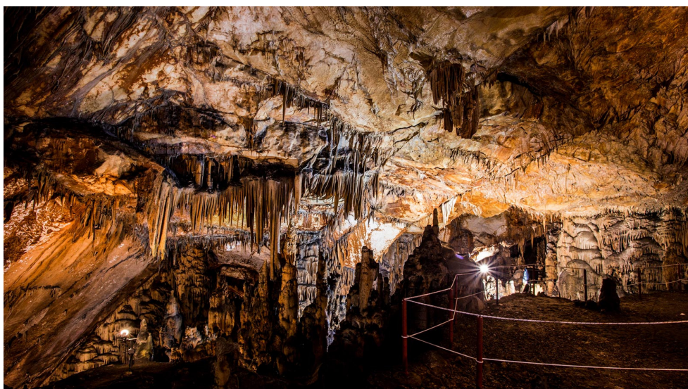
Slika 11. Unutrašnjost špilje Vranjače