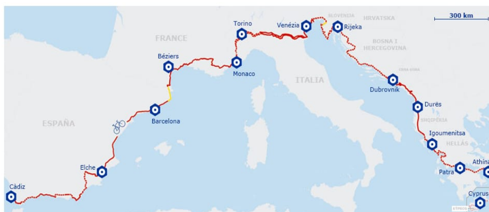
Slika 7. EuroVelo 8 ruta