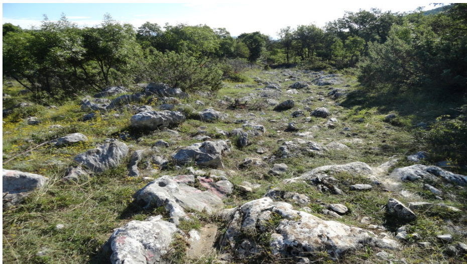
Slika 14. Rimska cesta

Rimska cesta, naročito zanimljiva arheolozima, uz Vranjaču slovi za jednu od poznatijih atrakcija na području općine. Tematska pješačka staza, duljine oko 2 km, nalazi se na nekadašnjim antičkim cestovnim komunikacijama. Ostaci odgovaraju osnovnom pravcu rimskih cesta, a njihovo pružanje obuhvaća rubna područja općina Dugopolje i Klis. Trasa je kretala od Salone, preko prijevoja Klis duž dugopoljske visoravni te se račvala kod zaseoka Kapele. Bila su moguća 2 skretanja; jedno je vodilo ka Aequumu (današnji Čitluk, kod Sinja), a drugo ka vojnom logoru Pons Tiluri (današnji Gardun, kod Trilja) Pretpostavlja se da je ova dionica bila u službi kolne ceste do 7. stoljeća i velike seobe naroda koja je zahvatila tadašnji prostor Rimske Dalmacije. Svečano otvorenje Rimske ceste bilo je 2014. godine, i usprkos tome što ovo područje nije do kraja arheološki istraženo, na predjelu Podi- zapad je zaštićeno kao kulturno dobro.