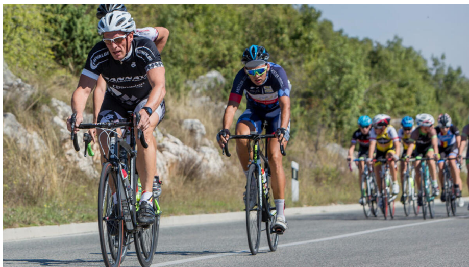
Slika 6. “Velika nagrada Dugopolja”

Na području Dugopolja, u svrhu razvijanja cikloturizma, 2014. godine po prvi put se održala “Velika nagrada Dugopolja”. To je međunarodna cestovna biciklistička tura (Slika 6.), održana u lipnju, u kojoj je sudjelovalo više od 100 natjecatelja iz Hrvatske, Slovenije te Bosne i Hercegovine. Za daljnji razvoj cikloturizma na području općine ključan faktor je EuroVelo 8 ruta koja prolazi kroz Dugopolje (Slika 7.)