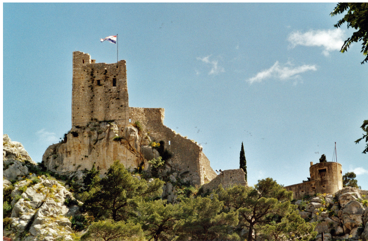
Slika 27. Tvrđava Peovica