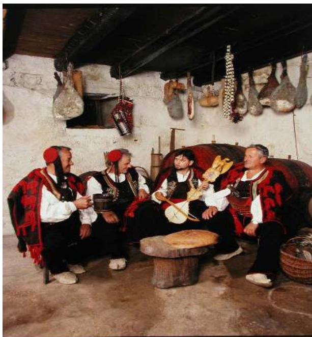
Slika 17. Članovi KUD-a Pleter u narodnoj nošnji