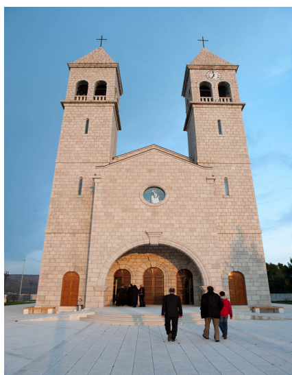
Slika 21. Crkva sv. Mihovila