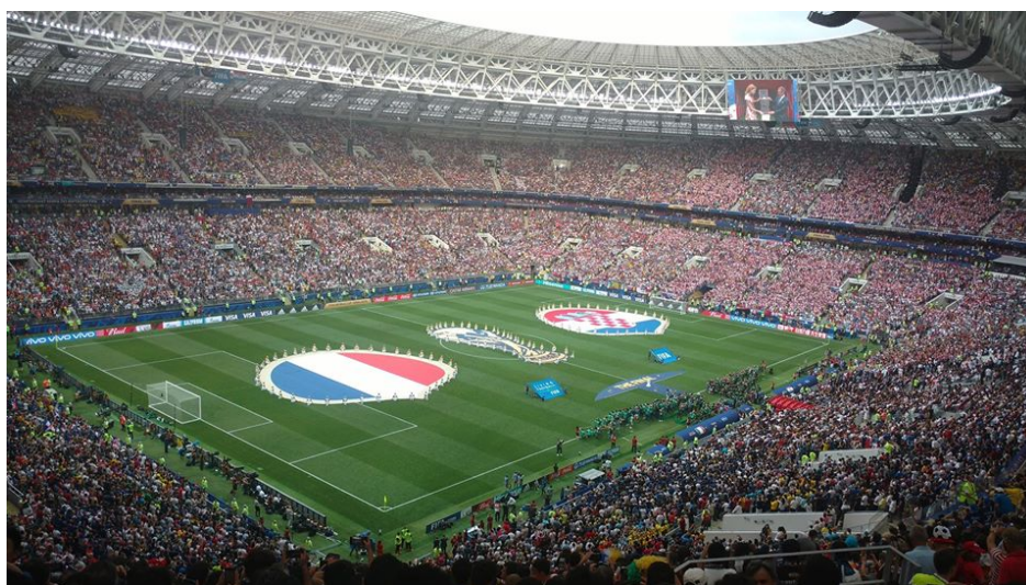
Slika 4. Finale Svjetskog prvenstva u nogometu 2018.g.

Olimpijske igre ostavile su značajan trag na ekonomski, društveni, kulturni i politički aspekt života. Uvelike su utjecale na razvoj ondašnje civilizacije. 23. lipnja 1984. godine osnovan je Međunarodni olimpijski odbor, te se iz tog razloga taj datum obilježava kao Olimpijski dan. Prve moderne olimpijske igre održane su 6. travnja 1896. godine u Ateni. Događaju je svjedočilo 80 tisuća gledatelja, a upravo on i je razlog početka razvoja sportskog turizma. Uz sveprisutne Olimpijske igre, danas su primjerice Svjetsko prvenstvo u nogometu i Wimbledon događaji koji pridonose razvoju sportskog turizma. Ogromne mase ljudi odlučuju se na putovanje upravo u tom periodu spajajući aktivni turizam sa odmorom, posjetom znamenitostima, upoznavanjem kulture, itd.