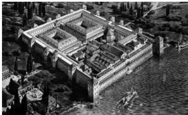
Slika 31. Dioklecijanova palača