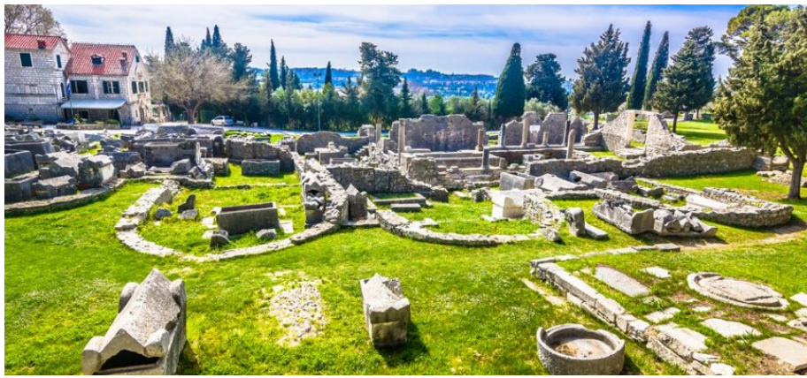
Slika 24. Antička Salona