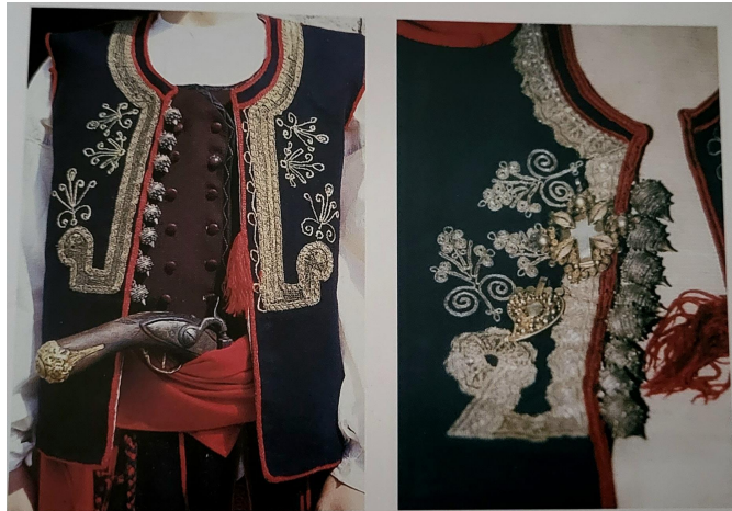
Slika 20. Tradicijsko dugopoljsko ruho za muškarce