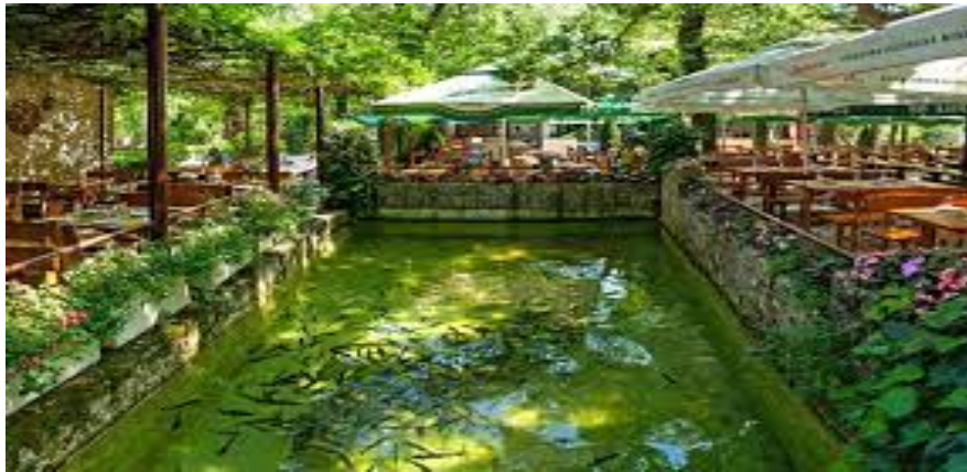
Slika 26. Radmanove mlinice