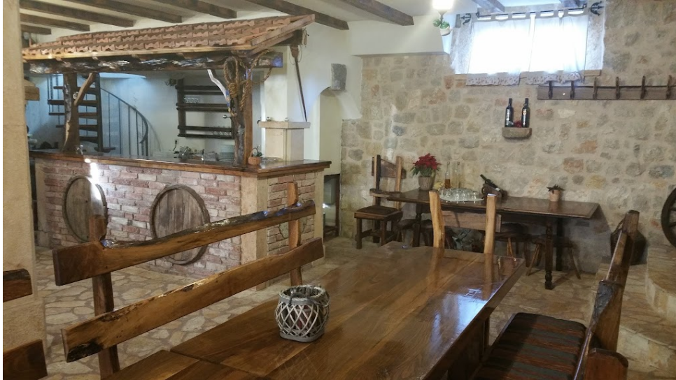
Slika 18. OPG Plazibat

Među mnoštvom manjih OPG-ova, 2 su se posebno istaknula. Riječ je o OPG Dodoja i OPG Plazibat. OPG Dodoja, odnosno seosko domaćinstvo "Zmajevi" radi dugi niz godina, a bavi se prvenstveno proizvodnjom suhomesnatih proizvoda. Navedeni OPG-ovi nude mogućnost organizacije svih vrsta proslava za manje i veće grupe, uz sve prateće usluge. Također, moguća je degustacija hrane i pića, jednako kao i priprema jela po narudžbi.