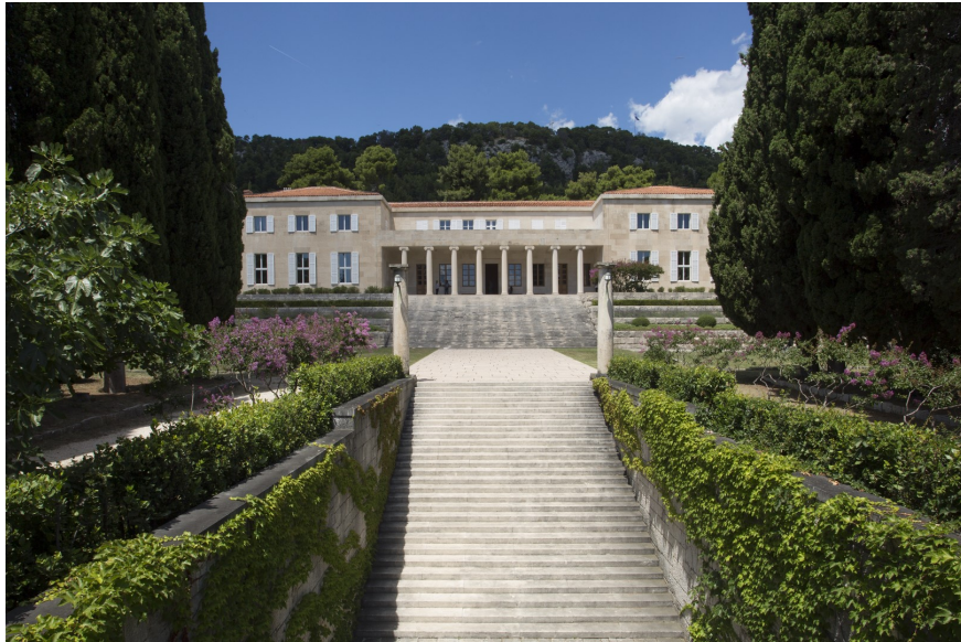
Slika 29. Galerija Meštrović