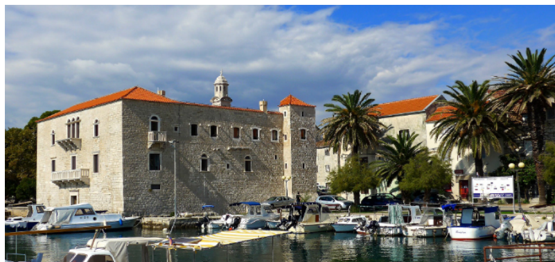
Slika 28. Kaštel Vitturi