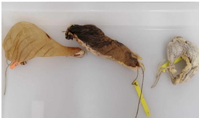
Slika 3.2.1.2. Osušena janjeća sirišta