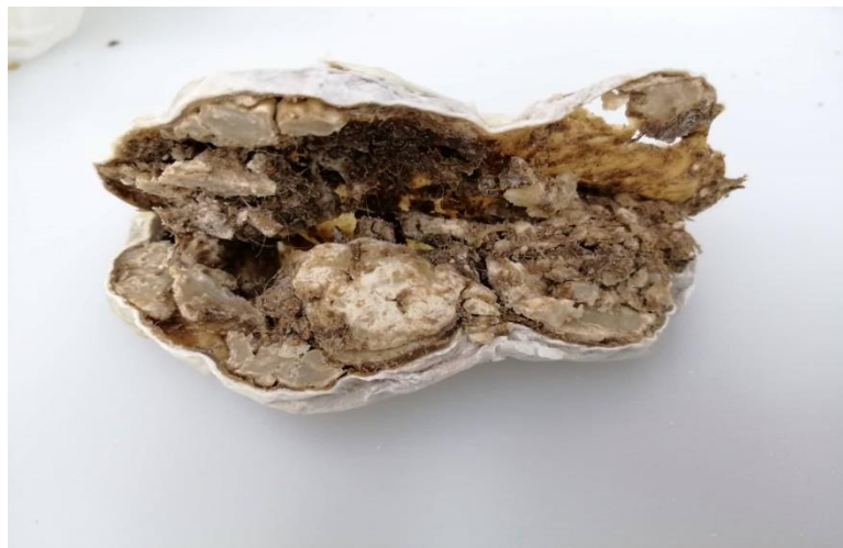
Slika 3.2.1.1. Unutrašnjost janječeg sirišta

Druga faza proizvodnje sirila je laboratorijska faza tijekom koje se osušeno sirište očistilo od nepotrebnih sadržaja te se rezalo na jednake trakice nakon čega je slijedila ekstrakcija i aktivacija sirila.