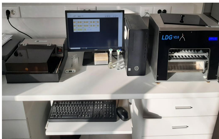
Slika 3.4.1. Instrument Formagraf

Prije početka analize, uzorci mlijeka su inkubirani i otopljeni u vodenoj kupelji na temperaturi 39 °C u trajanju 60 minuta. Za to vrijeme napravljene su otopine sirila vaganjem sirila u odmjernu tikvicu od 10 mL i dodavanjem destilirane vode. Nakon što je uzorak otopljen potrebno je odpipetirati 10 mL uzorka u svaku od 10 pozicija unutar aluminijskih blokova. Provjerava se temperatura uzorka koja mora biti 35 °C, te se potom pipetira otopina sirila u volumenu 0,2 mL (200 \mu m) (Slika 3.4.2.) i pokreće se analiza. Svaki uzorak ovčjeg mlijeka analiziran je u tri ponavljanja s tri različite koncentracije (0,041 IMCU/mL, 0,051 IMCU/mL te 0,061 IMCU/mL) od svake vrste sirila (Maxiren i domaće sirilo) u trajanju 60 minuta. Na kraju provedene analize dobiveni su podaci o čvrstoći gruša 30 minuta nakon dodatka sirila ( a_{30} ), vremenu potrebnom da gruša postigne čvrstoću od 20 mm ( k_{20} ), vremenu početka grušanja (RCT), čvrstoći gruša 60 minuta nakon dodatka sirila ( a_{60} ) te maksimalnoj čvrstoći gruša ( A_{max} ). Rezultati su potom pohranjeni u tablicu za daljnju obradu.