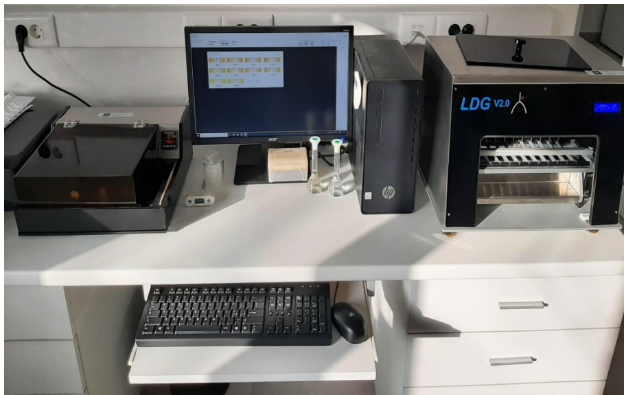
Slika 3.4.1. Instrument Formagraf

Prije početka analize, uzorci mlijeka su inkubirani i otopljeni u vodenoj kupelji na temperaturi 39 °C u trajanju 60 minuta. Za to vrijeme napravljene su otopine sirila vaganjem sirila u odmjernu tikvicu od 10 mL i dodavanjem destilirane vode. Nakon što je uzorak otopljen potrebno je odpipetirati 10 mL uzorka u svaku od 10 pozicija unutar aluminijskih blokova. Provjerava se temperatura uzorka koja mora biti 35 °C, te se potom pipetira otopina sirila u volumenu 0,2 mL (200 \mu m) (Slika 3.4.2.) i pokreće se analiza. Svaki uzorak ovčjeg mlijeka analiziran je u tri ponavljanja s tri različite koncentracije (0,041 IMCU/mL, 0,051 IMCU/mL te 0,061 IMCU/mL) od svake vrste sirila (Maxiren i domaće sirilo) u trajanju 60 minuta. Na kraju provedene analize dobiveni su podaci o čvrstoći gruša 30 minuta nakon dodatka sirila ( a_{30} ), vremenu potrebnom da gruša postigne čvrstoću od 20 mm ( k_{20} ), vremenu početka grušanja (RCT), čvrstoći gruša 60 minuta nakon dodatka sirila ( a_{60} ) te maksimalnoj čvrstoći gruša ( A_{max} ). Rezultati su potom pohranjeni u tablicu za daljnju obradu.