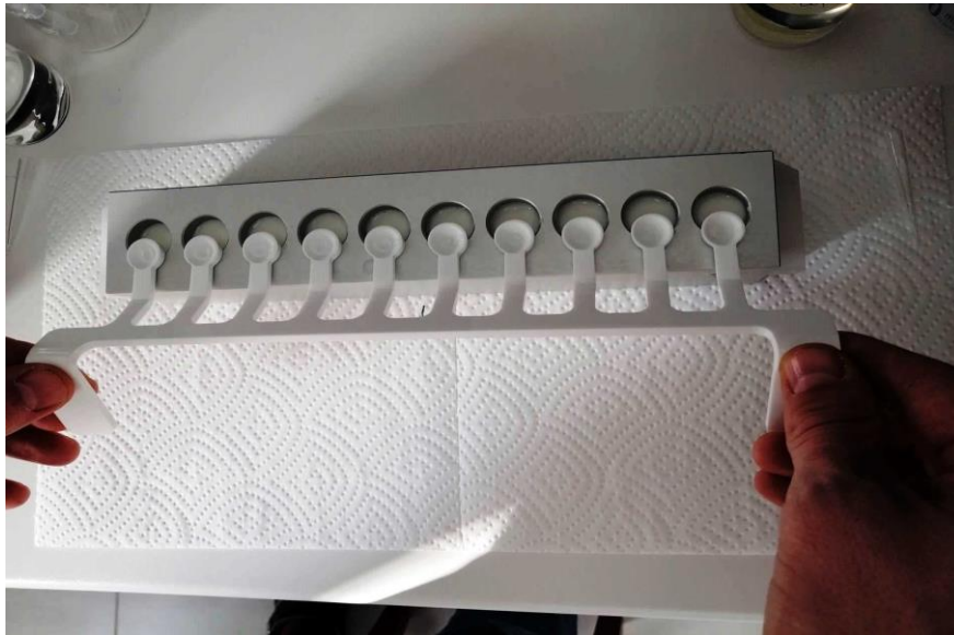
Slika 3.4.2. Dodavanje odpipetirane otopine sirila u ovčje mlijeko