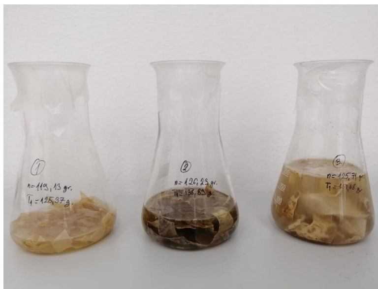
Slika 3.2.2.1. Tikvice sa narezanim sirištem i otopinom NaCl-a