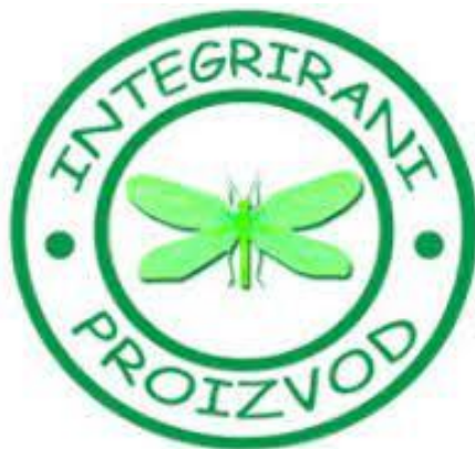
Slika 2. Znak kojim se označava integrirani proizvod