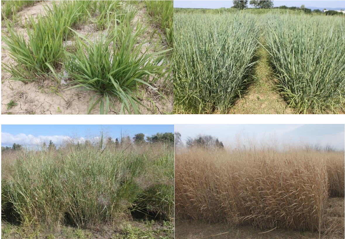
Slike 3, 4, 5 i 6: Faze rasta divljeg prosa