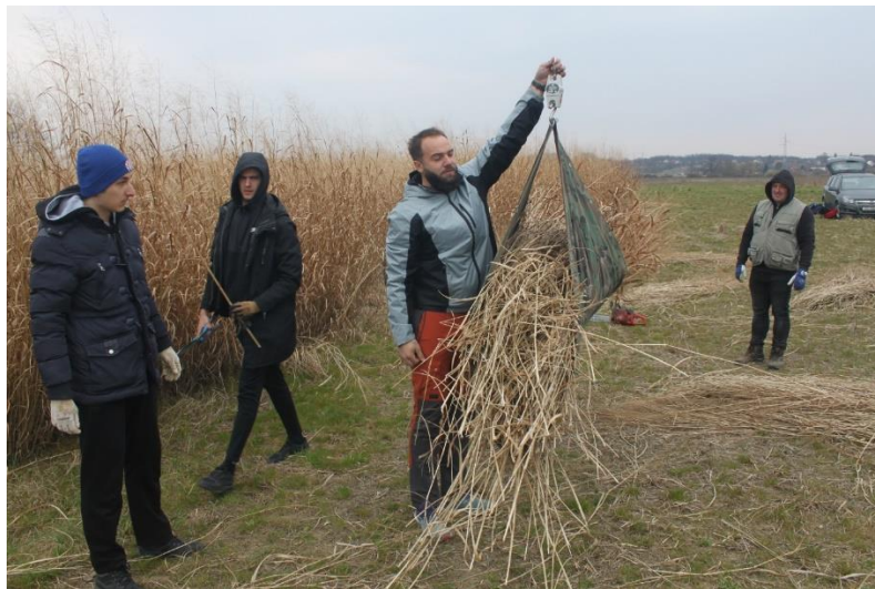
Slika 19: Vaganje – utvrđivanje prinosa svježe mase.