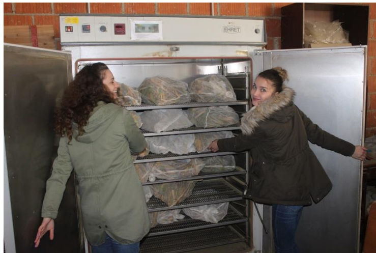
Slika 22: Sušenje poduzoraka u sušioniku.