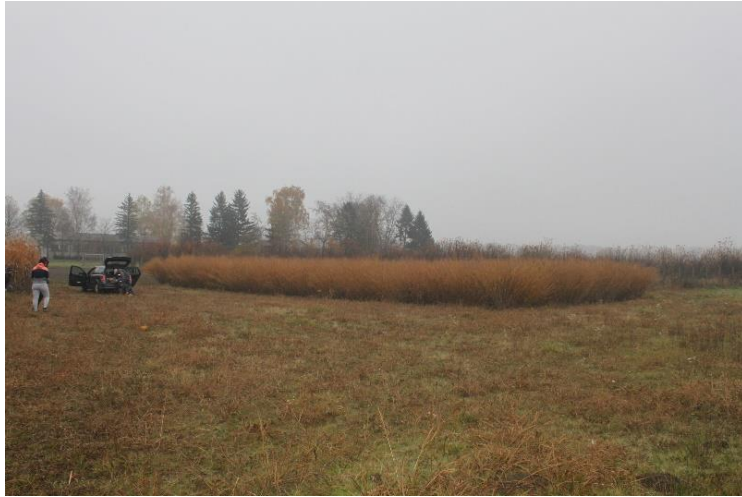
Slika 16: Nasad divljeg prosa pred jesensku žetvu.