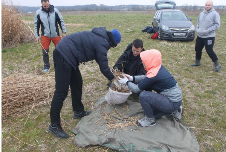
Slika 21: Uzimanje poduzoraka biomase.