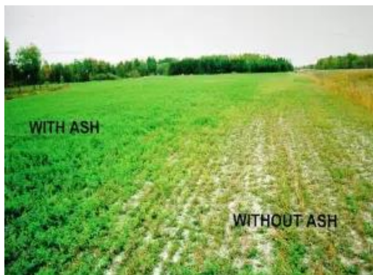
Slika 11: Izgled polja na kojem je primijenjen pepeo (lijevo) i na kojem nije primijenjen pepeo (desno)

Općenito govoreći, aplikacija drvenog pepela stimulira mikrobiološku aktivnost i mineralizaciju u tlu (Demeyer i sur., 2001). Efekti pepela i aplikacije pepela na fizikalna i mineraloška svojstva tla malo su poznata. Smatra se da aplikacija pepela u tlo može jako utjecati na teksturu, aeraciju, kapacitet tla za vodu i salinitet. Chang i sur. (1977) otkrili su da se sa malim dozama pepela može povećati hidraulička provodljivost i kapacitet tla za zadržavanje vode, ali bez značajnog porasta za vodu koja je zapravo dostupna biljci. Etiegni i Campbell (1991) su pokazali da čestice drvenog pepela nateknu u dodiru sa vodom i mogu opstruirati pore tla, što onda šteti cjelokupnoj aeraciji tla.