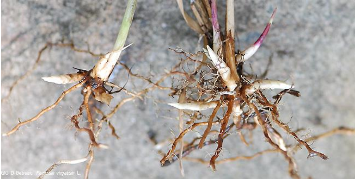
Slika 8: Rizomi divljeg prosa

divljeg prosa (Lemus i sur., 2008). Sezonsko kretanje nutrijenata kao što su fosfor, kalij itd., slična su kao što je to slučaj s dušikom (McLaughlin i sur., 2005, Lemus i sur., 2009) ali sa tom razlikom da umjesto translokacije nutrijenata, glavni mehanizmi recikliranja tih nutrijenata su povezani sa ispiranjem iz starih i odumrlih listova unutar opsežne korijenove zone divljeg prosa. U svakom slučaju, nutrijenti se vraćaju u tlo preko zime, što pomaže očuvanju plodnosti tla i smanjuje potrebe za gnojidbom divljeg prosa.