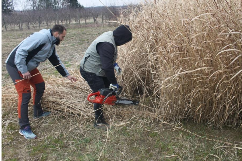
Slika 18: Žetva divljeg prosa.