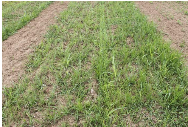
Slike 9 i 10: Sijanje divljeg prosa i mladi nasad divljeg prosa