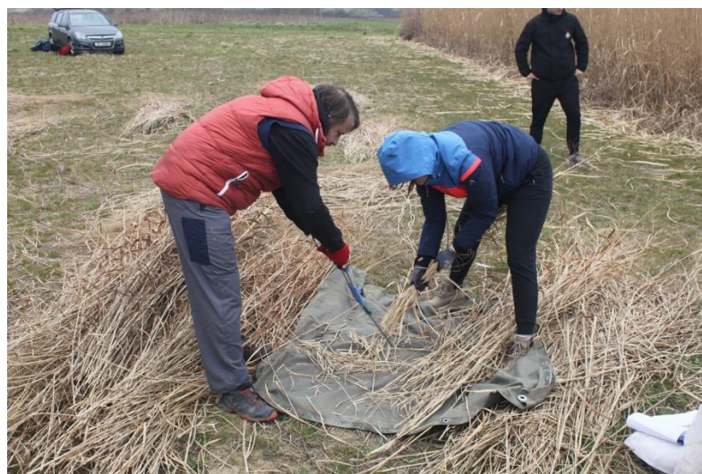
Slika 20: Sjeckanje biomase.