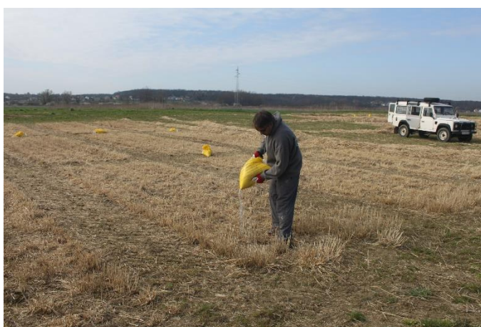
Slika 14: Aplikacija pepela na osnovne parcelice.