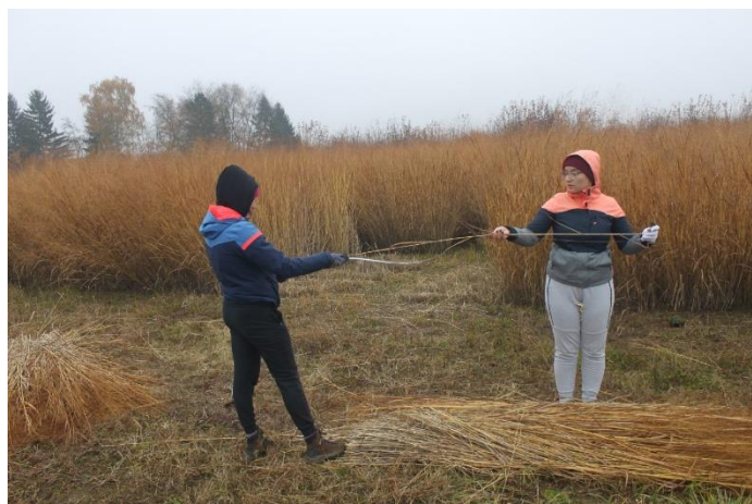
Slika 24: Mjerenje visine biljke