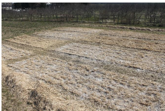
Slika 15: Pokusno polje divljeg prosa nakon aplikacije pepela.