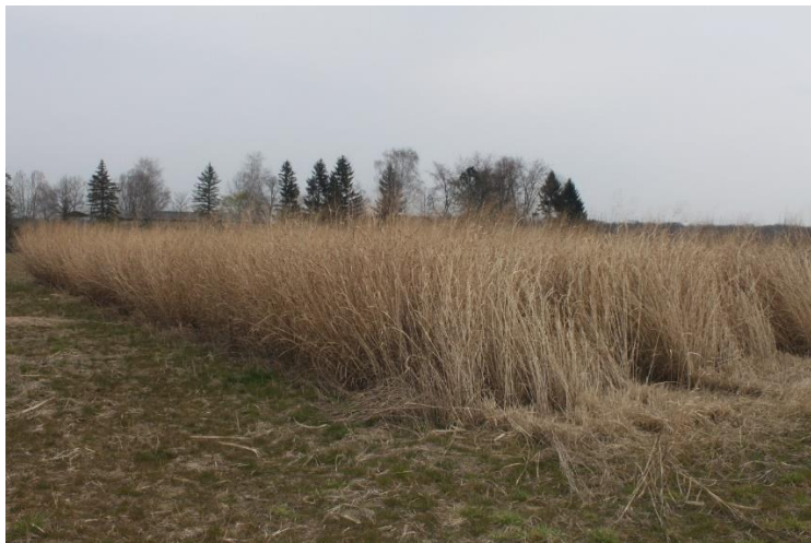
Slika 17: Nasad divljeg prosa pred proljetnu žetvu.