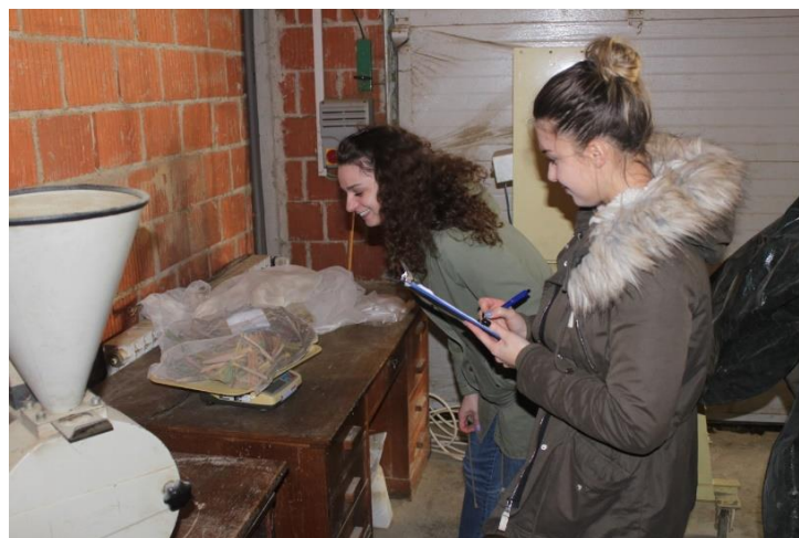
Slika 23: Vaganje poduzoraka prije i poslije sušenja.