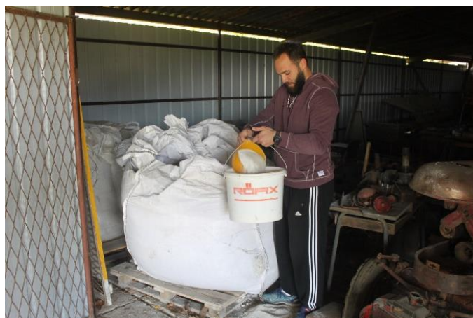
Slika 13: Vaganje pepela.