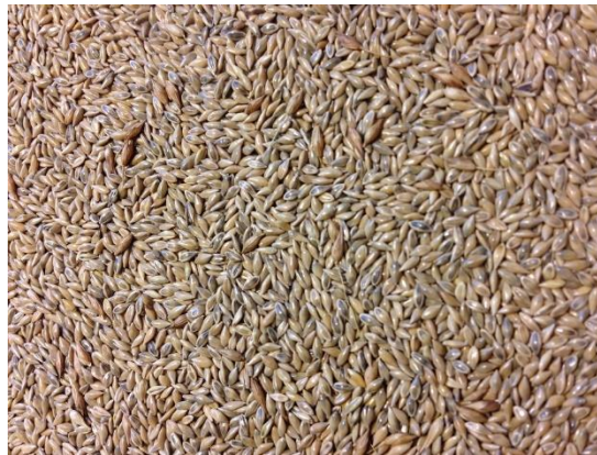
Slika 1: Sjeme divljeg prosa

Budući da su sjemenke divljeg prosa vrlo malene (slika 1), količina vode potrebne za klijanje je isto tako malena. Zahtjevi za vodom postaju veći kako zrno klija i mladi korijenov sustav kreće se rastom i funkcioniranjem (Newman i sur., 1988). Optimalna vlažnost pripremljenog tla je izrazito bitna za klijanje, iako su informacije o zahtjevima divljeg prosa za vodom u fazi nicanja i klijanja veoma oskudne. Nekoliko dostupnih informacija ukazuje na to da pod uvjetima suše samo 2,5% posijanih sjemenki proklija, što daje postotak preživljavanja od samo 5% uopće klijavih sjemenki (Barney i sur., 2009). Prikladna vlažnost tla u površinskom, tj. sjetvenom sloju je isto tako ključna za dobro formiranje adventivnog korijenja. Uspješnost klijanja i dugoročno preživljavanje najviše ovisi o razvitku jakog i robusnog adventivnog korijenja, jer to je glavni korijenov sustav kod malih izniklih sjemenki (Parish i sur., 2005; Newman i sur., 1988). U nešto dubljim zonama tla, temperatura i vlaga su optimalniji za uspješan razvoj adventivnog korijenja, koje onda osigurava uspješan razvitak i preživljavanje cijele biljke.