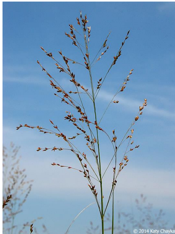
Slika 2: Metlica divljeg prosa

Fiziološki razvoj divljeg prosa, sličan je svim drugim višegodišnjim travama. Trajanje svake pojedine faze ovisi o svakom kultivaru pojedinačno ali ono što im je svima zajedničko je to da na vegetativni razvoj svih njih (uključujući razvoj lista i produljenje internodija) jak utjecaj ima temperatura (Madakadze i sur., 1998), dok je reproduktivna faza razvoja najviše pod utjecajem duljine dana, bez obzira na vlažnost i temperature (Van Esbroeck i sur., 2003).