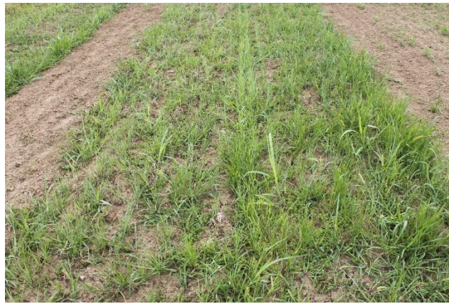
Slike 9 i 10: Sijanje divljeg prosa i mladi nasad divljeg prosa