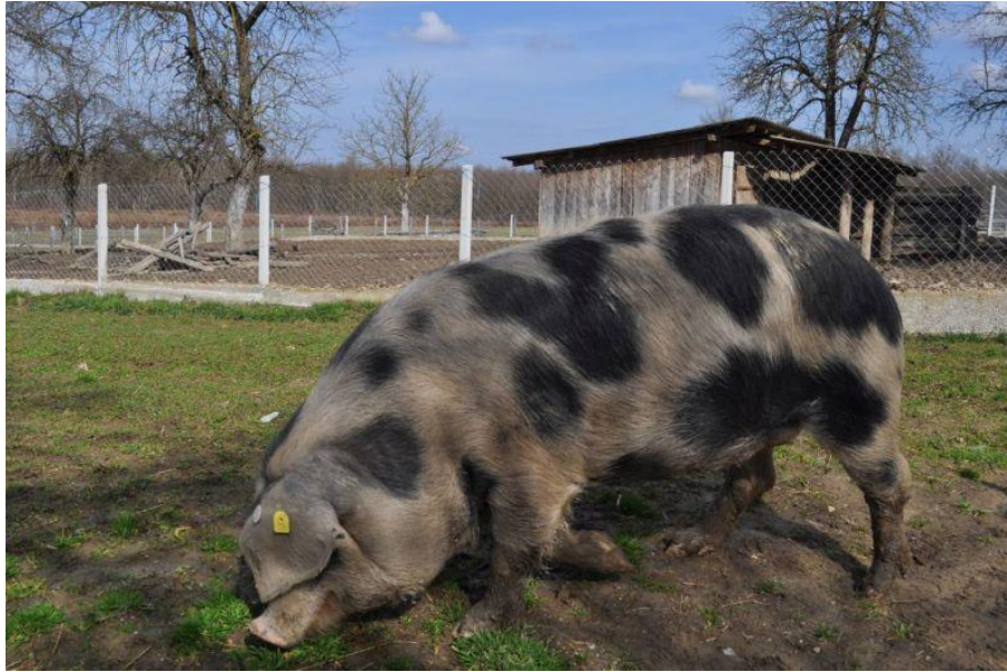
Slika 2.1. Banijska šara svinja

uzgaja na području Sisačko-moslavačke, Bjelovarsko-bilogorske, Zagrebačke, Zadarske, Požeško-slavonske i Vukovarsko-srijemske županije (HAPIH 2022.).