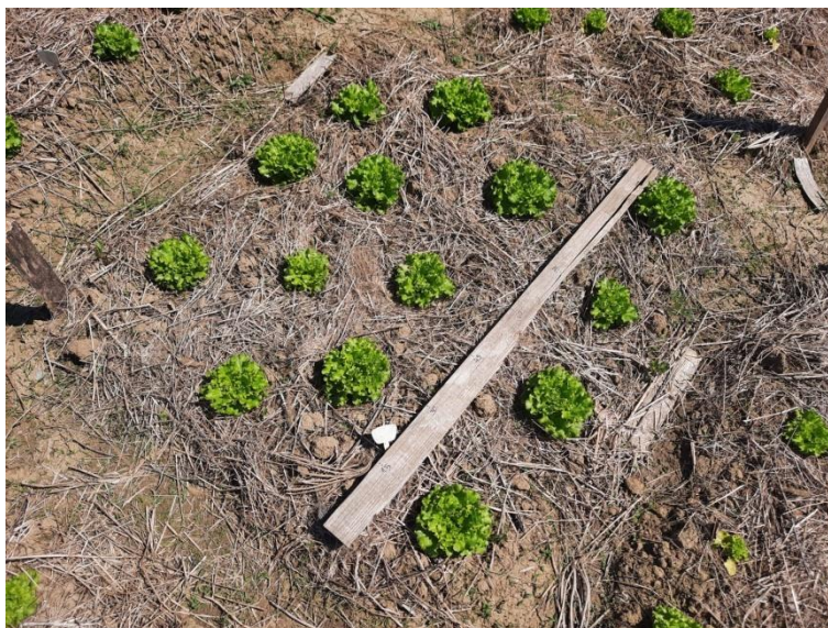
Slika 14.: Salata na pokusnom polju, tretman sII, ponavljanje 2.

Statistički značajna razlika je utvrđena u sadržaju sumpora i vodika među tretmanima. Tretman sIII (sterilizirani šturkov izmet) imao je značajno manju količinu supora i veću količinu vodika od ostalih tretmana.