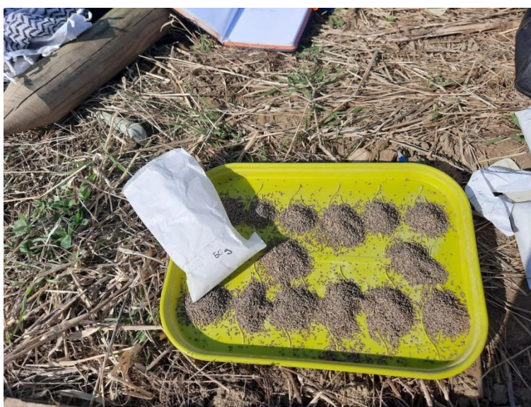
Slika 5.: Doziranje šturkovog izmeta za gnojidbu.

Šturkov izmet zajedno s drugim ostacima uzgoja šturka ustupio je "Insektarij - Tvornica buba" (Slika 5.).