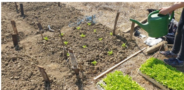
Slika 8.: Sadnja sadnica na pokusno polje.

Presadnice su posađene 29.3.2021. (Slika 8.) na razmak redova 30 cm i razmak unutar reda 30 cm na pokušalištu Maksimir Zavoda za povrćarstvo, u studentskim vrtovima. Uzgojna površina organizirana je u latinski kvadrat s tri tretmana. Svaka varijanta zauzimala je površinu od 1 m 2 te je ukupna površina bila 9 m 2 . Pojedinačni tretman je uključivao 14 zasebnih jedinki salate. Uzorci su se analizirali u Analitičkom laboratoriju Zavoda za opću proizvodnju bilja, Agronomskog fakulteta u Zagrebu. Mikrobiološka analiza napravljena je na Institutu Ruđer Bošković u suradnji s Veterinarskim fakultetom Sveučilišta u Zagrebu.