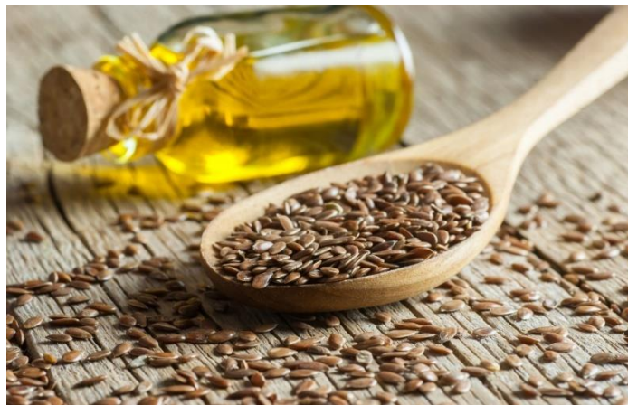
Slika 16. Laneno ulje

Izvor: https://www.verywellhealth.com/flaxseed-oil-health-benefits-how-to-use-and-cautions-4178046