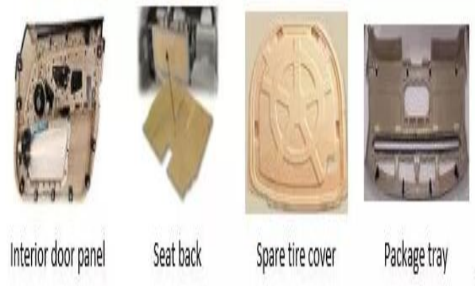
Slika 15. Upotreba biokompozita u autoindustriji.

postupak proizvodnje karoserije komercijalnih automobila manjih serija kao što je Dodge Viper.. Naglasak se stavlja u prvom redu na dobit, ali i na zaštitu okoliša. Stoga se provode brojna istraživanja i sve više raste upotreba biomaterijala u kompozitima (slika 15.). Za modele kod kojih cijena nije ograničavajući faktor upotrebljavaju se kompoziti od epoksidne duromerne matrice i ugljikovih vlakana. Osim razvoja lakših kompozita s boljim mehaničkim svojstvima radi se na razvoju uporabe svih komponenata u kompozitu (Milardović, 2011.).