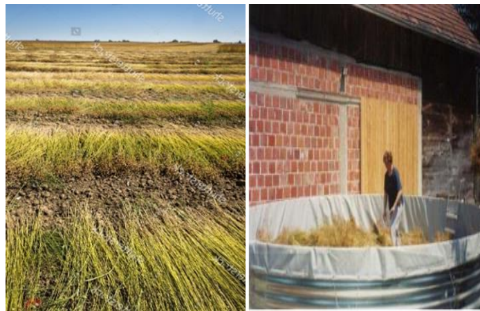
Slika 8. Rošenje lana u polju i močenje lana u bazenima

Kvaliteta vlakana koja su dobivena močenjem općenito je niža u usporedbi s vlaknima dobivenim močenjem u bazenu, ali se troškovi i zagađenje vode značajno smanjuju dok se postiže veći prinos vlakana. Nažalost, učinkovitost ovisi o zemljopisnim uvjetima. Regije s odgovarajućim vlažnim i temperaturnim uvjetima bitne su za dobar rast mikroorganizama. Ovisnost o vremenu prema regijama rezultira varijabilnošću kemijskih i mehaničkih svojstava lanenih vlakana, a time i nedosljednošću kvalitete vlakana, što zahtijeva da industrija lana miješa vlakna kako bi ublažila te varijacije (De Prez i sur., 2018.).