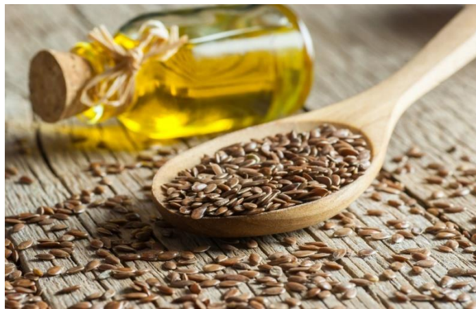
Slika 16. Laneno ulje

Izvor: https://www.verywellhealth.com/flaxseed-oil-health-benefits-how-to-use-and-cautions-4178046