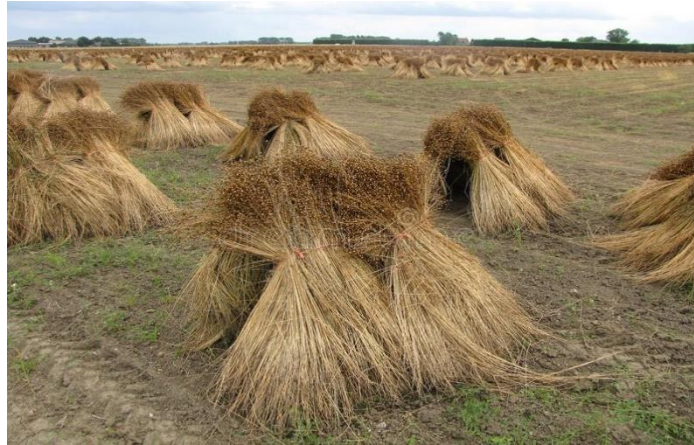
Slika 10. Sušenja lana u zbojevima na polju