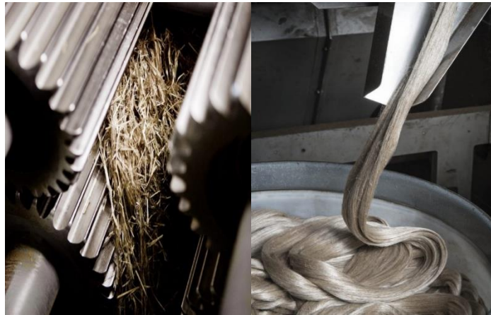
Slika 12. Žljebasti valjci u stroju za lomljenje i finalni proizvod

Lomljenje je proces koji slijedi nakon močenja, a koji je sastavni dio izvlačenja vlakana iz stabljike (slika 12.). Sastoji se u osnovi od razbijanja drvenih dijelova slame na fine komade i u isto vrijeme odvajanja drvenog dijela stabljike od vlakana. U Sjedinjenim Državama i u zapadnoj Europi razbijanje se obično postiže prolaskom suhe slame između žljebastih valjaka. Vlakno je dovoljno čvrsto i fleksibilno da se odupre lomljenju i izlazi van kao dugo neslomljeno vlakno. Stabljika lana se propušta kroz niz valovitih valjaka nakon čega slijedi mlazni cilindar i obično uređaj za trešnju. Slama je toliko slomljena i potresena da vlakno izlazi bez odrvenjenih dijelova stabljike i „piljevine“ (Robinson, 1940.).