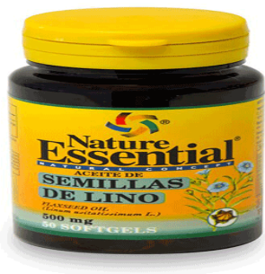
Slika 18. Lan za ljekovite svrhe.

Laneno ulje se u ljekovite svrhe najčešće prodaje u kapsulama (slika 18.). Kapsule se nalaze unutar tamne staklene bočice kako bi se smanjio utjecaj svjetlosti i temperature na svojstva lanenog ulja.