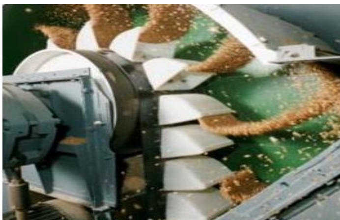
Slika 7. Elevator za sjeme

Izvor: https://www.tehnopan.com/w/transport-medija/elevatori/