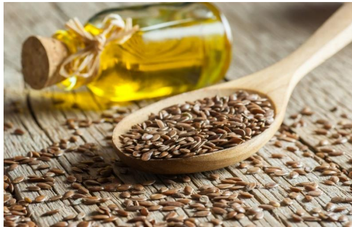
Slika 16. Laneno ulje