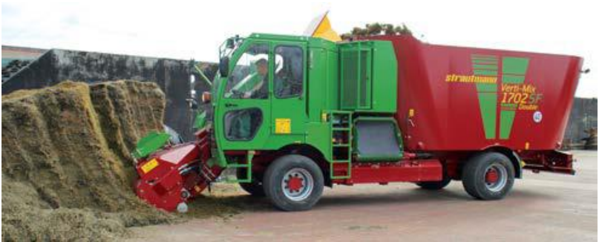
Slika 4.20. Samokretni stroj Strautmann Verti-Mix 1702 SF pri izuzimanju silaže