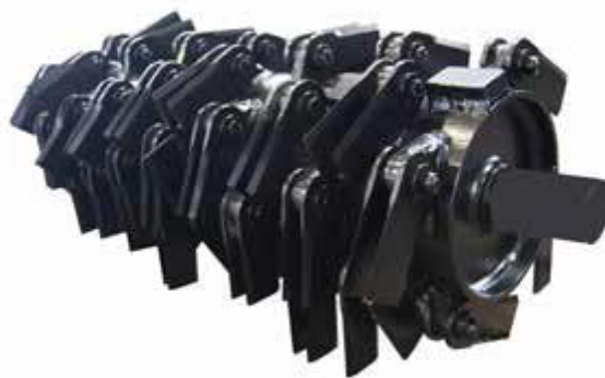
Slika 4.15. Prikaz noževa na glodalici samokretnog stroja proizvođača Faresin

Miješanje u spremniku se postiže s dvije okomite pužnice na kojima su postavljeni noževi za usitnjavanje hrane. Samokretni strojevi LEADER ECOMODE su u mogućnosti prilagoditi brzinu u različitim fazama utovara u odnosu na fazu miješanja, tako da je na kraju punjenja gotovi obrok spreman za distribuciju.