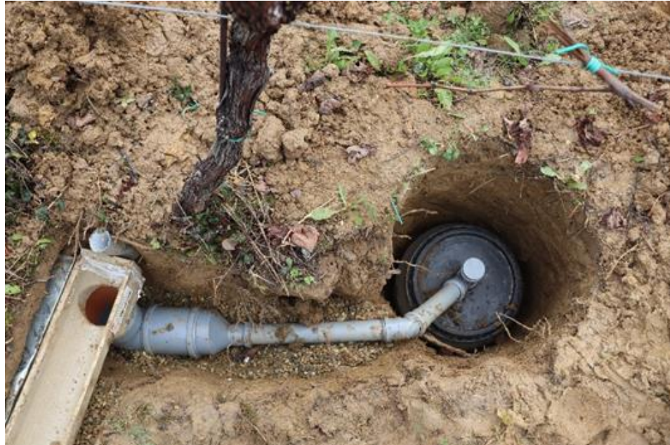
Slika 3.2.3. Instaliranje spremnika i cijevi na određenoj padini zbog osiguravanja otjecanja vode.

Osim kanalica i ostale cijevi i spremnik su morali biti postavljeni na određeni pad kako bi voda mogla otjecati. Uz to su kanalice fiksirane pomoću betona koji se izljevao u iskopane rupe (Slika 3.2.3).