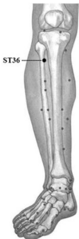
Slika 4.1.1.1. Akupunkturna točka ST36 (Zusanli) na nozi čovjeka