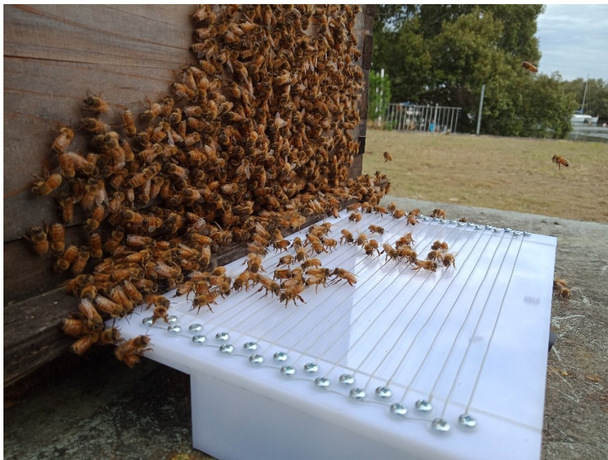
Slika 2.1.2.1. Moderni skupljač pčelinjeg otrova ispred leta košnice.

Moderni skupljač otrova se sastoji od 4 dijela: Baterija ili akumulator, transformator istosmjerne u izmjeničnu struju, okvir skupljača koji se sastoji od elektrizirane žičane mreže i staklene ploče, koja je pokrivena tankom polietilenskom membranom (Bogdanov 2017.). Skupljač se može postaviti unutar košnice ili izvan košnice ispred leta, što je uobičajenije. Slika 2.1.2.1. prikazuje skupljač pčelinjeg otrova ispred leta.