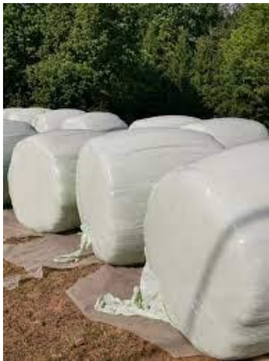
Slika 3. Sjenaža u rolo balama.

Drugo je rješenje za bolje provenjavanje primjena organskih desikanata (propionska i mravlja kiselina). Ti preparati na osnovi organskih kiselina zaustavljaju život stanice i prouzročuju sušenje bez promjene hranjive kvalitete tretiranoga krmiva. Osim toga, desikanti imaju i biostatski učinak na mikroorganizme te preveniraju kvarenje sjenaže. Kvalitetu sjenaže uvelike određuje visina reza, pa se kod višegodišnjih leguminoza preporučuje visina košnje 6 – 8 cm. Na taj se način manje oštećuje vegetativni vrh i brži je porast nove mase, a s druge strane izbjegava se donji dio biljke, koji je obično jače onečišćen. Taj donji dio stabljike sadržava i veću koncentraciju lignina, koja smanjuje probavljivost i hranjivu vrijednost gotove sjenaže (Domančinović i sur., 2019.).