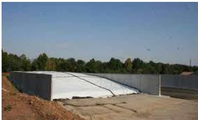
Slika 2. Horizontalni silos za silažu.

siliranoga materijala s polja do posluživanja silaže u hranidbi životinja (Domančinović i sur., 2019.).