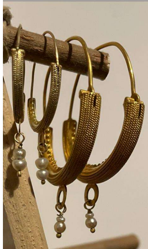
Slika 4: Priedba KUD Čilipa