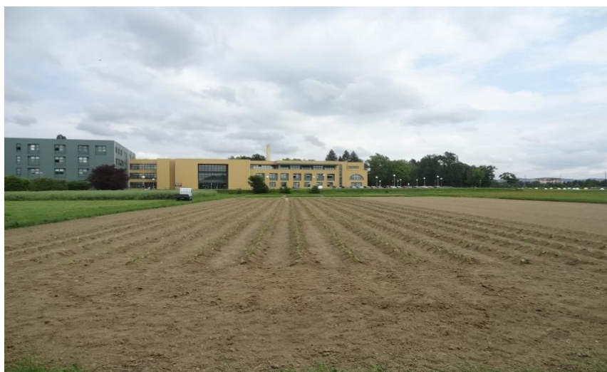
Slika 4.2.3. Posadeni pokus duhana