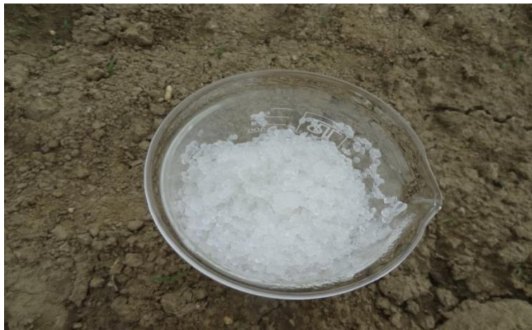
Slika 2.2.1. Mikrokapsule

Mnogi se polimeri koriste za dobivanje mikrokapsula, ali najviše biopolimeri. To su npr. polisaharidi poput alginata i kitozana, a dobiveni su iz poljoprivrednih sirovina ili ljuski rakova (Racovića i sur., 2009). Koriste se jer imaju sposobnost stvaranja mikrokapsula metodom ionskog geliranja (Fan i sur., 2011). Alginat je natrijeva sol alginske kiseline (Vinceković i sur., 2016), a izolira se iz smeđih algi. Alginat sadrži uronske kiseline, \alpha -L-guluronske i \beta -L-manuronske kiseline povezane \alpha -glikozidnom vezom. Čvršće i poroznije gelove koji su postojaniji dulje razdoblje razvija alginat s visokim sadržajem guluronske kiseline. Poliguluronatne jedinice molekula alginata stvaraju model „kutija za jaja“ tj., geliranu strukturu s metalnim ionima. Takav spoj između lanaca kinetički je stabilan prema disocijaciji. Polimanuronatne jedinice imaju polielektrolitske karakteristike vezanja kationa. Rezultat vezanja tih međudjelovanja je stvaranje okruglih mikrokapsula (Racovića i sur., 2009).