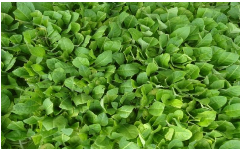
Slika 4 Rasad duhana F1 hibrid BH4