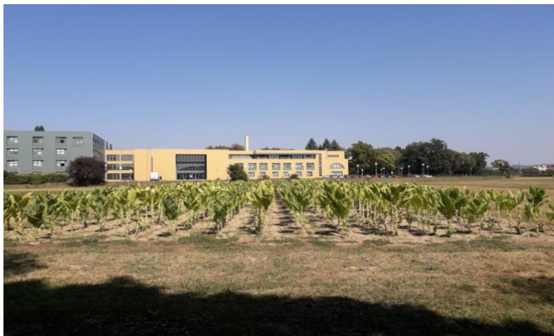
Slika 4.2.4. Biljke duhana u berbi

Nakon sušenja određen je prinos (kg/ha) i duhan je klasiran u šest klasa (27. kolovoza, 30. kolovoza, 3. rujna, 13. rujna, 16. listopada, 12. studenoga i 22 studenoga 2018.).