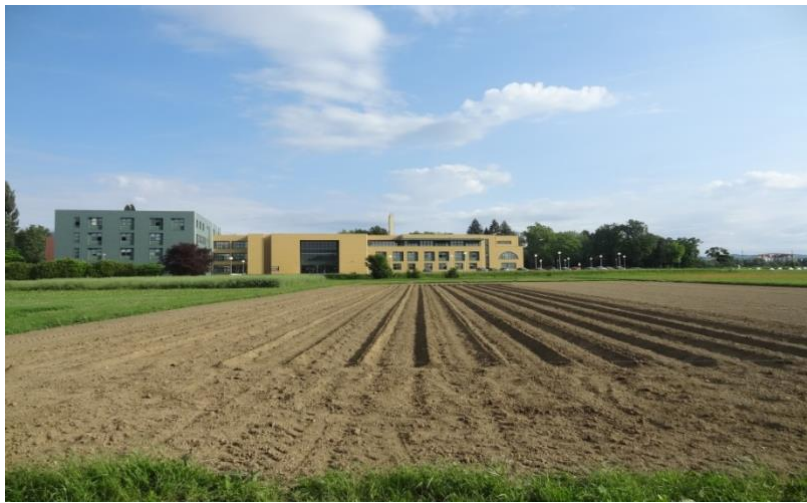
Slika 4.2.1. Gredice za sadnju duhana

U pripremi tla za sadnju duhana krajem studenog izvršeno je oranje na dubinu od 30 cm. Otvorena brazda ostavljena je preko zime. U tlo je prije sadnje (8. svibnja, 2018.) na svim parcelama uneseno 500 kg/ha NPK gnojiva formulacije 0 - 5 - 30 (25 kg/ha fosfora i 150 kg/ha kalija). Pred samu sadnju 9. svibnja, 2018., obavljena je finalna obrada tla sjetvospremačem u jednom proходу. 10. svibnja, 2018. napravljene su gredice za sadnju duhana visine 30 cm (Slika 4.2.1.)