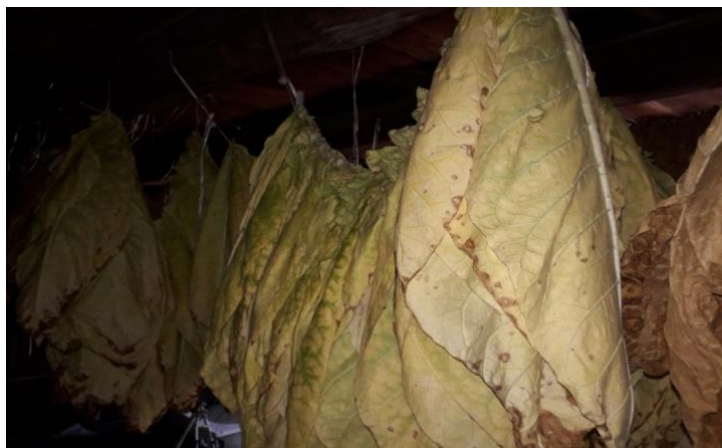
Slika 4.2.5. Sušenje listova duhana na zraku u hladu