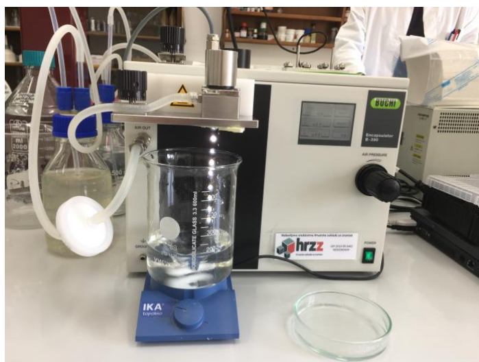
Slika 2.2.1. Izrada mikrokapsula u Encapsulatoru B – 390

Mikrokapsule su pripremljene tehnikom ionskog geliranja. Izrada mikrokapsula se provodi dokapavanjem otopine nosača aktivne tvari, natrijevog alginata inkapsulatorom Büchi - Encapsulator B-390 (BÜCHI Labortechnik AG, Švicarska)(Slika 2.2.2.) u otopine kalcijevog nitrat 4-hidrata ( \text{Ca}(\text{NO}_3)_4 \cdot 4\text{H}_2\text{O} ). Koncentracija natrijevog alginata je 1,5% (w/v). Otopina natrijevog alginata propušta se kroz mlaznicu veličine 1 mm pri frekvenciji vibracija od 40 Hz i tlaku od 35 mbar (Encapsulator Büchi-B390, BÜCHI Labortechnik AG, Švicarska). Za drugi tip mikrokapsula, 1250g mikrokapsula miješaju se 1h u 2,5 litre otopine s 0,5 % kitozana.