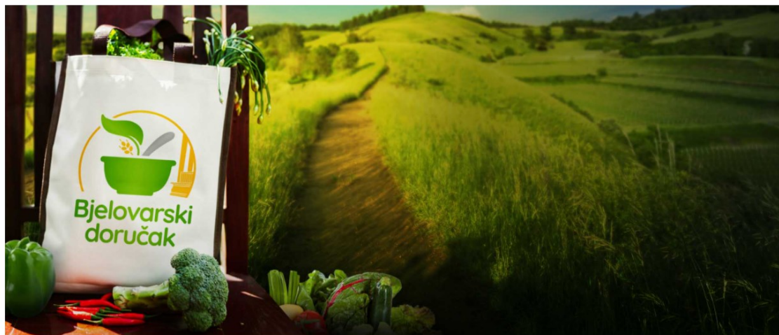
Slika 5.2.. Bjelovarski doručak