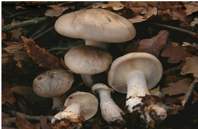
Slika 2 Maglenka

Maglenka, jestiva gljiva koja raste u kasnu jesen u velikim skupinama, u isprekidanim linijama ili krugovima, u crnogoričnim ili bjelogoričnim šumama. Teško je probavljiva te se ne preporuča konzumacija osobama koje imaju osjetljiv probavni sustav. Može narasti vrlo velika, promjera klobuka do 25 centimetara. Klobuk je na početku mesnat, zvonolik a u kasnijim fazama konveksan, zatim ravan, magleno - sive boje, posut svijetlim prahom. Listići su jako gusti, pomiješani sa kraćima, spuštaju se niz stručak, blijedo žute boje, poslije rumenkasti, lako se odvajaju od mesa klobuka. Stručak dostiže visinu od 15 centimetara, mesnat je i pun, elastičan, na dnu odebljan, smeđe - sive boje. Meso je bijele boje trpkog okusa. Spore su žućkaste, ovalne. Meso sa sulfovanilinom postaje ljubičasto a s fenolom posmeđi (Božac, 1993).