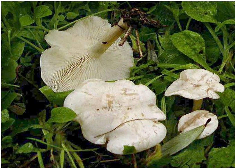
Slika 4 Otrovna brašnjača

Otrovna brašnjača raste od ljeta do kraja jeseni u skupinama u bjelogoričnim šumama, vlažnim uvalama, livadama i pašnjacima (Božac, 1986). Klobuk širine 5 centimetara u ranijim je fazama konveksan, zatim otvoren. Obod je valovit, bijele boje te pokriven injem. Listići su gusti, pomiješani s kraćima, spuštaju se niz stručak, bijele boje. Stručak doseže visinu od 4 centimetara, vlaknaste strukture, savijen dok kasnije postaje šupalj, bijele je boje kao i klobuk. Meso klobuka je žilavo, ne lomi se, bijele je boje, okus podsjeća na brašno. Spore su glatke i eliptične. Meso s fenolanilinom pocrveni na trenutak, s gvajakolovom tinkturom poplavi, a s kalijevom lužinom postaje blijedo smeđe (Božac, 1993).