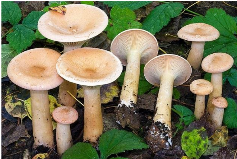
Slika 3 Martinčica

Mlada martinčica je iznimno kvalitetna gljiva, no ubiru se samo mlade gljive jer kod starijih primjeraka meso postaje gorko. Raste u vlažnim crnogoričnim i bjelogoričnim šumama, travnjacima, pašnjacima, na obroncima šuma, u velikim skupinama ili krugovima u kasnu jesen. Klobuk dostiže 10 centimetara u promjeru, mesnat je, konveksan. Rub klobuka je uvrnut, poslije je ravan, klobuk poprima žutu boju a zatim bijelu boju. Listići su na početku bijeli ili žuti, pomiješani s kraćima, spuštaju se niz stručak. Stručak doseže visinu od 15 centimetara, pun, odebljan na dnu, iste boje kao klobuk i listići. Meso je u klobuku bijelo, jakog mirisa po voću, suho te žilavo. Spore su bijele, bradavičaste. Meso s kalijevom lužinom postaje svijetlo žuto dok sa sulfovanilinom poprimi ljubičastu boju (Božac, 1986).