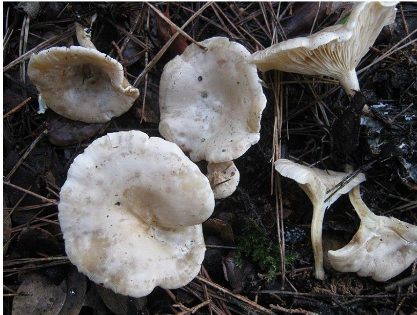
Slika 5 Bijela otrovnica

Bijela otrovnica, smrtno otrovna gljiva, raste u jesen, grupno ili u krugovima u svim šumama. Klobuk je širok do najviše 8 centimetara, ulegnut i konveksan, slabo je mesnat i bijele je boje. Izgleda kao da je pokriven bijelim injem koje se može obrisati. Kožica je sjajna i suha. Listići su bijeli ili slabo žućkasti, gusti, nejednake veličine, prirasli ili se spuštaju nit stručak. Stručak je bijele boje, ispunjen, visok do 7 centimetara, u isto vrijeme može narasti i više stručaka skupa, pri dnu stručka nalaze se dlačice. Meso je bijele boje, žilave konzistencije, vodenaste strukture, miris i okus podsjeća na užeglost. Spore su u bijele dok su u uvećanom izdanju prozirne (Božac, 1993).