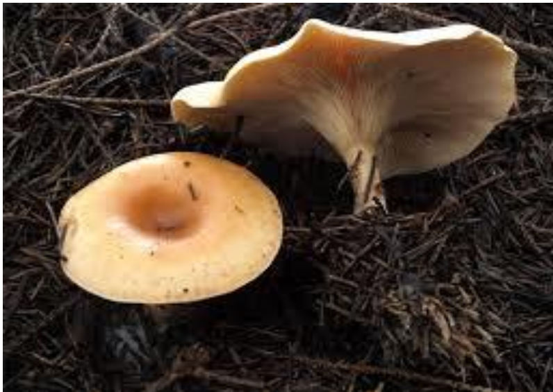
Slika 1 Žuta uleknjača

Žuta uleknjača ima kožastu konzistenciju te zbog toga nije vrlo cijenjena. Raste u jesen u grupama u listopadnim i crnogoričnim šumama. Konzumira se kada drugih gljiva nema u izobilju dok je mlada jer u kasnijim fazama postaje žilava. Ako se konzumira u većim količinama zbog prisustva muskarina, može uzrokovati smetnje. Muskarin je toksičan spoj koji se može pojaviti kod puno vrsta koje imaju listićav himenij, naposve kod gljiva iz roda Clitocybe i Inocybe te može uzrokovati tegobe. Klobuk je u mlađim fazama razvoja ulegnut, zatim tanak, žutocrvene boje, sjajne površine a za suhog vremena pokriven čehicama, uvijenog ruba. Listići su vrlo gusti, uski, prvo su bijeli a zatim prelaze u smeđe - crvenu boju. Stručak je visok, pun zatim šupalj, zadebljan, na kraju bijelo crvenkaste boje. Meso je bijelo ili crveno, žilave konzistencije, nema mirisa, okus je slatkast. Spore su u masi bijele, okrugle ili eliptične. Meso i kožica klobuka u dodiru s kalijevom lužinom požute (Božac, 1993).