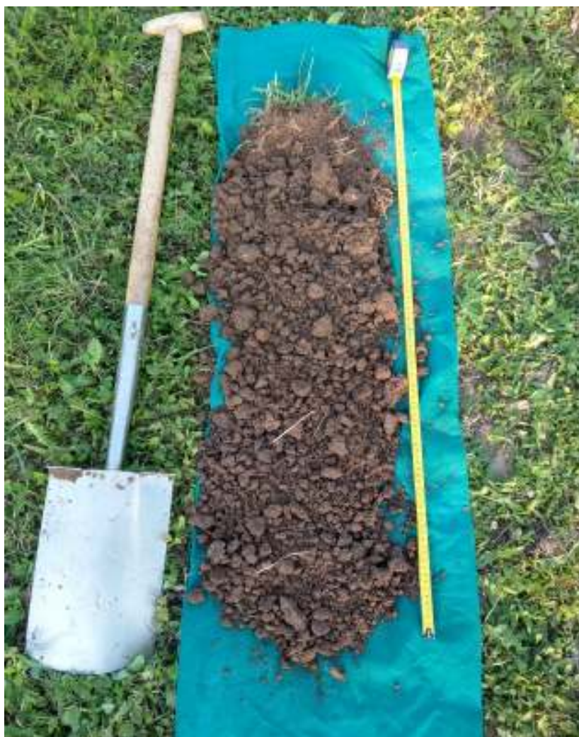
Slika 4 Prikaz strukture tla na dubini 0-90 cm