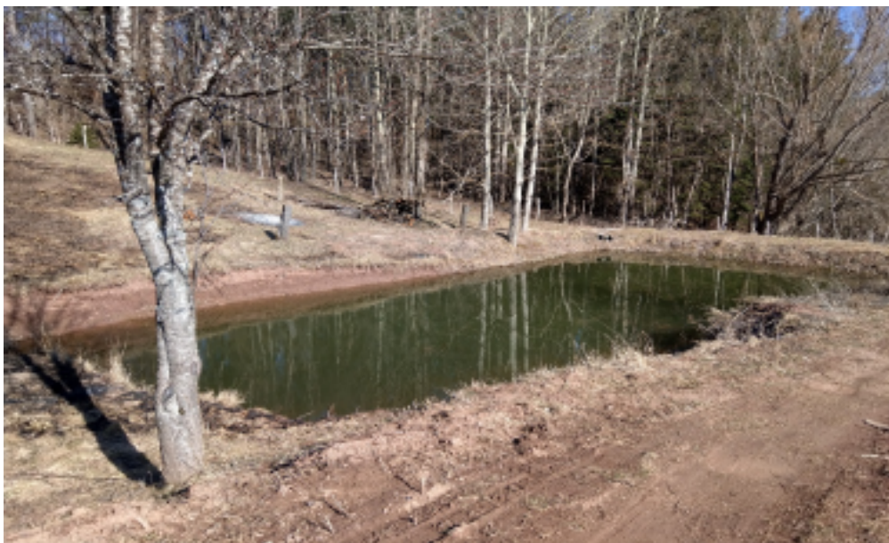
Slika 3 Izgled akumulacije nakon zimskog perioda