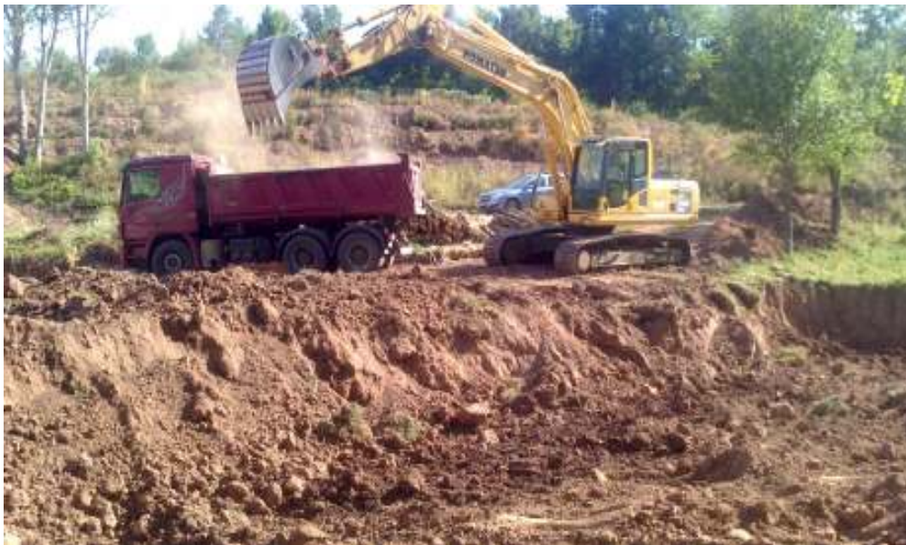
Slika 2 Izrada akumulacije

Nakon detaljne analize terena pristupilo se izradi akumulacije. Mehanizacija koja je korištena za iskopavanje zemlje je bager gusjeničar Komatsu PC 240 i kamion za odvoz iskopane zemlje na druge dijelove parcele. Prema planu napravljena je akumulacija dužine 30 m, širine 10 m i dubine 3 metra koja svojom površinom može primiti maksimalno 900 kubika vode. U periodu kada ima više vode nego što je potrebno za ostvarenje potreba korisnika, višak vode se prirodnim tokom nakuplja u akumulaciji te se može iskoristiti tijekom sušnih ljetnih perioda. Ako kojim slučajem dođe do prekoračenja maksimalnog kapaciteta akumulacije, voda odlazi kroz dva izvedena cijevna preljeva (propusta) u obližnju šumu. S time se riješila problematika nedostatka vode te će u budućnosti sigurno poslužiti za navodnjavanje 200 novih sadnica šljiva.