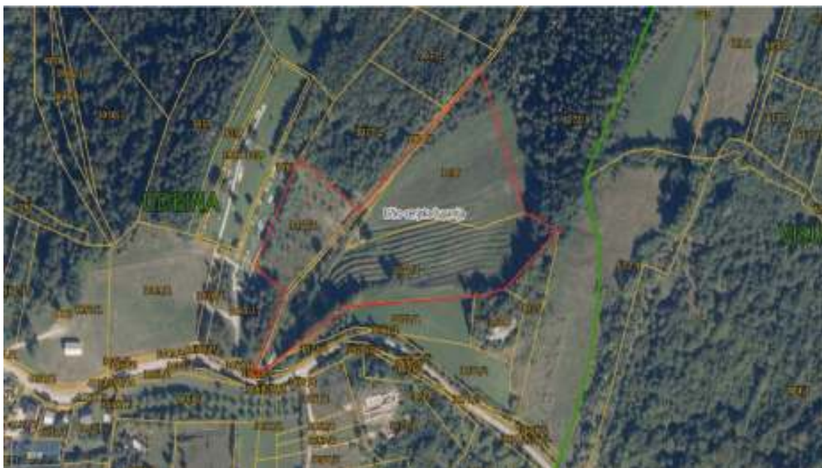
Slika 1 Izvod iz katastarskog plana

Zemljište, koje je u vlasništvu OPG-a Brkić, obuhvaća tri katastarske čestice (3077/1, 3072/3 i 3076) ukupne površine 30.649 m 2 u općini Udbina. Cestovno je dobro povezano, udaljeno je samo 1 km od obiteljske kuće i 18 km od ulaza na autocestu Zagreb-Split. Dobra cestovna povezanost je izrazito bitna kod poljoprivredne proizvodnje zbog bržeg izvoza proizvoda s parcele i bržeg dolaska mehanizacije.