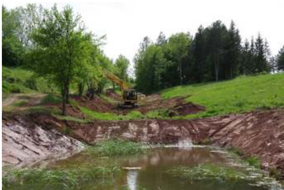
Slika 9 Ravnanje donjeg dijela terena