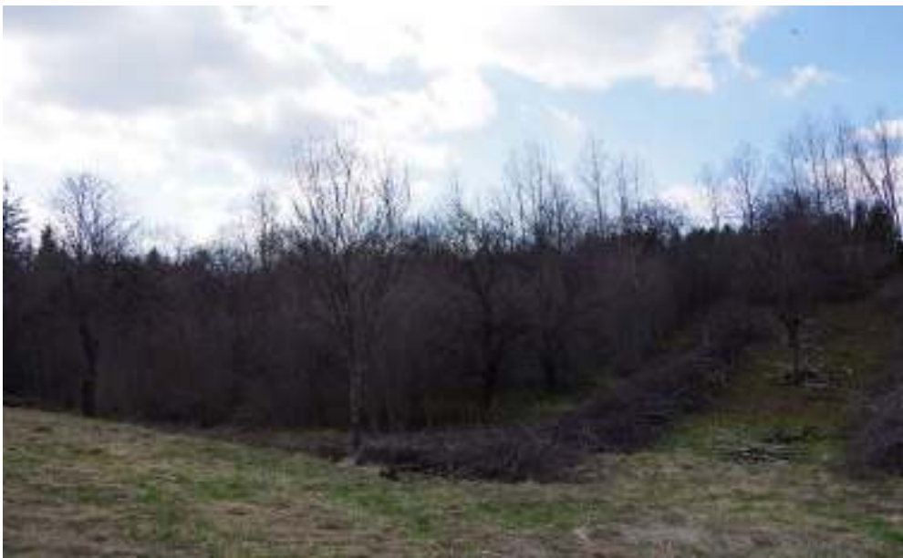
Slika 5 Izgled terena tijekom krčenja

Korovi, a naročito višegodišnji mogu nanijeti velike štete nasadu, jer troše hranjive supstance i vodu, a neki mogu biti domaćini virusa. Za radnje odvoza iskorišteni su gusjeničar za vađenje panjeva i kamion za odvoz panjeva i korijenja.