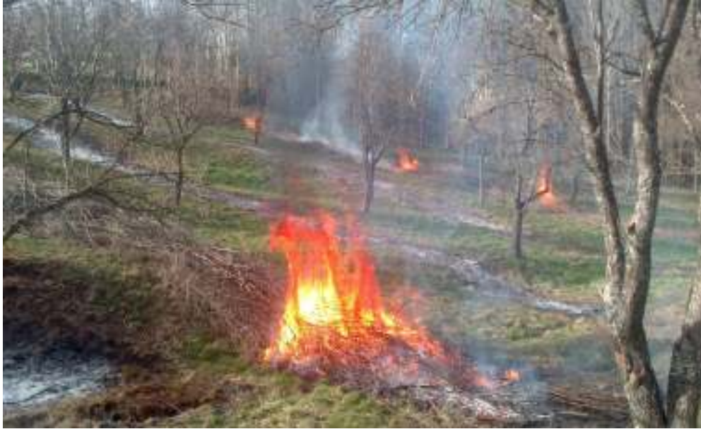
Slika 6 Paljenje granja i korova