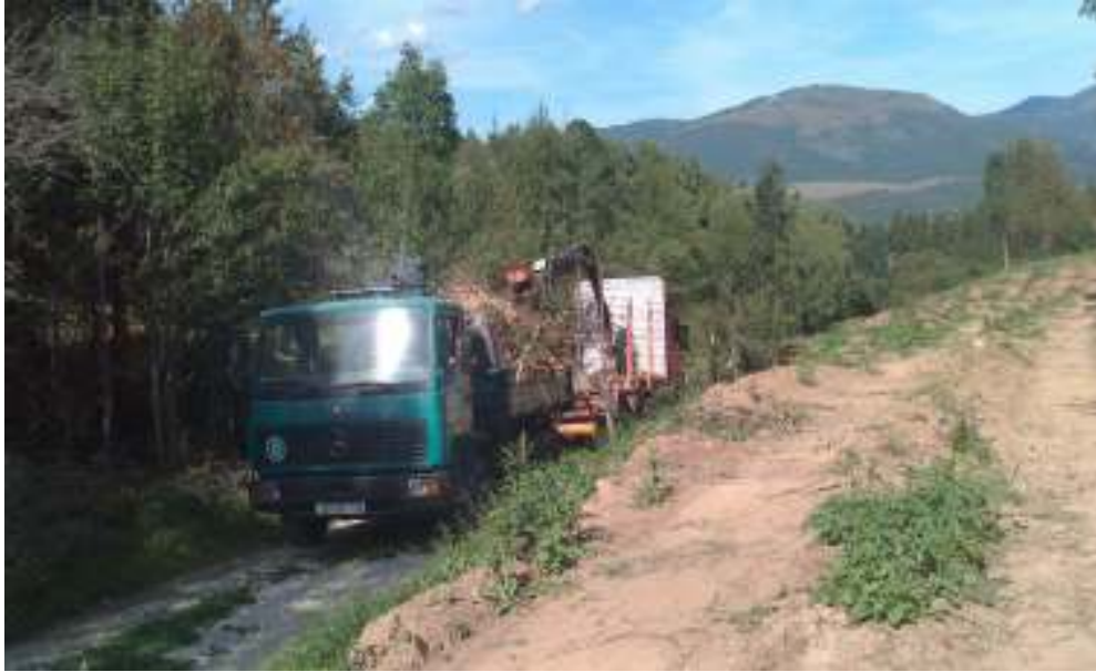
Slika 8 Odvoz panjeva i korijenja