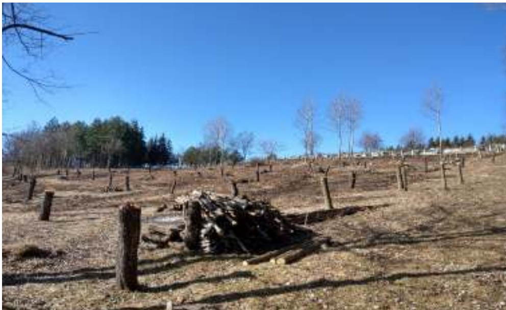
Slika 7 Izgled terena prije odvoza krupnijeg drveta, panjeva i korijenja šljiva