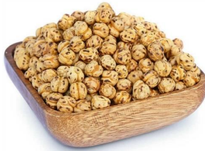
Slika 3.6.4.1. Sjemenke slanutka

Cvjetovi su obično samooplodni. Boja latica je bijela, plava, žuta ili ružičasta (Gagro 1997.).