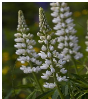
Slika 3.4.4.2. Bijela lupina ( L. albus L.)