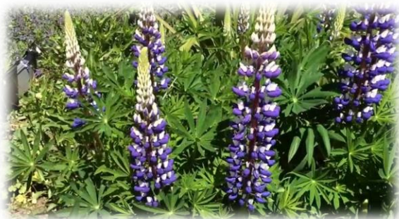
Slika 3.4.4.1. Plava lupina ( L. angustifolius L.)

Plod je mahuna koja je gruba, kožasta, dlakava i na vrhu zašiljena. Unutar nje se nalazi tri do deset sjemenki. Sjeme je okruglasto, sa strane spljošteno, različite veličine i boje, što ovisi o vrstama (Gagro 1997.).