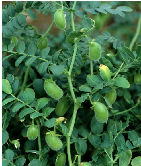
Slika 3.6.4.2. Slanutak ( C. arietinum L.)