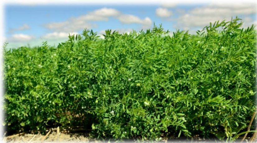
Slika 3.5.4.2. Leća ( L. culinaris L.)