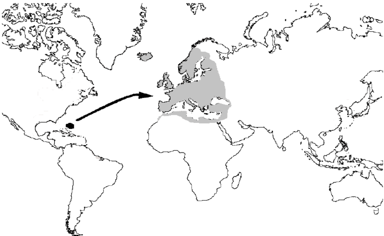
Slika 1. Rasprostranjenost Europske jegulje nakon mrijesta u Sargaškom moru (Ringuet i sur., 2002).