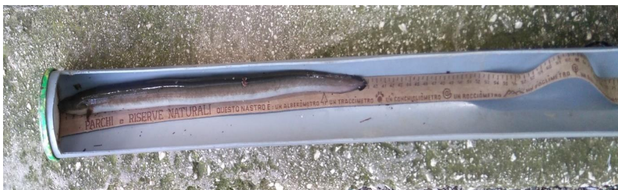
Slika 4. Mjerenje dužine jegulje ihtiomетrom

Jedinke jegulja su lovljene tijekom 4.6.2016. (Sutorina, Brca i Željeznica) i 2.10. 2016 (Žrnovnica) godine uređajem za elektroribolov (Hans Grassl), tehnikom kontinuiranog prolaza uzduž riječne obale pri čemu je obuhvaćena površina uzorkovanja od 100 m dužine u svakoj rijeci. Totalna dužina (TL) uzorkovanih jedinki izmjerena je ihtiomетrom s točnošću od 0,5 cm (Slika 4), dok je masa izmjerena vagom s preciznošću od ± 0,001 g. Na osnovi dužinsko-masениh vrijednosti, izračunat je Fultonov faktor kondicije (CF) koji pokazuje opće stanje riba i promjene koje se odvijaju zavisno od lokacije i fizioloških ciklusa u životu riba. Jegulje su stavljene u vrećice i transportirane u hladnjak ribarskog laboratorija Zavoda za ribarstvo, pčelarstvo, lovstvo i specijalnu zoologiju Agronomskog fakulteta Sveučilišta u Zagrebu.