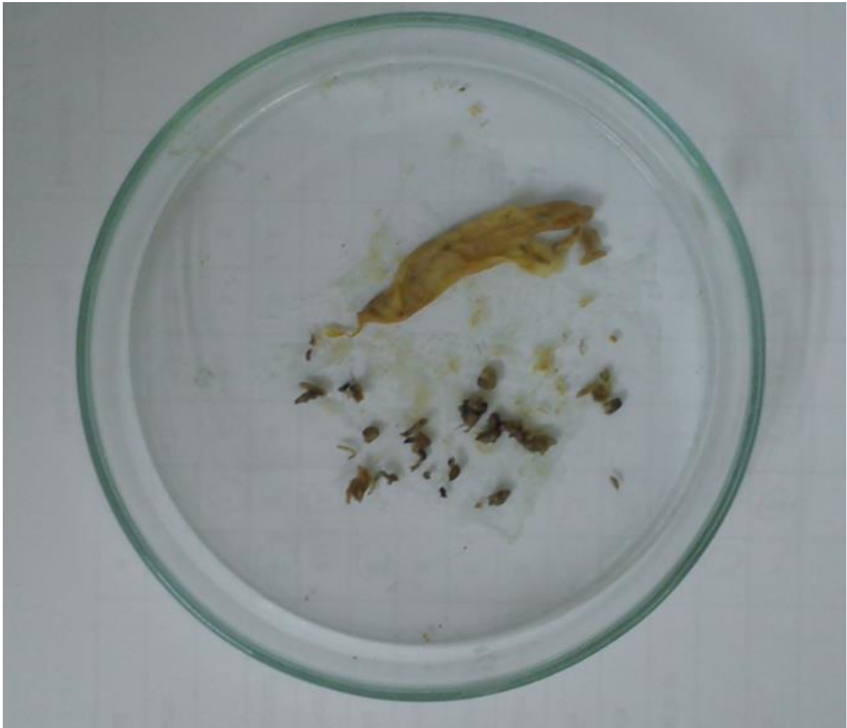
Slika 5. Izdvojene svojte nakon disekcije probavila (Autor: Ante Šango)

obzirom da su ga sačinjavale različite razgrađene biljke koje tvore biljnu masu, koja se nije mogla sistematski kategorizirati (Slika 7).