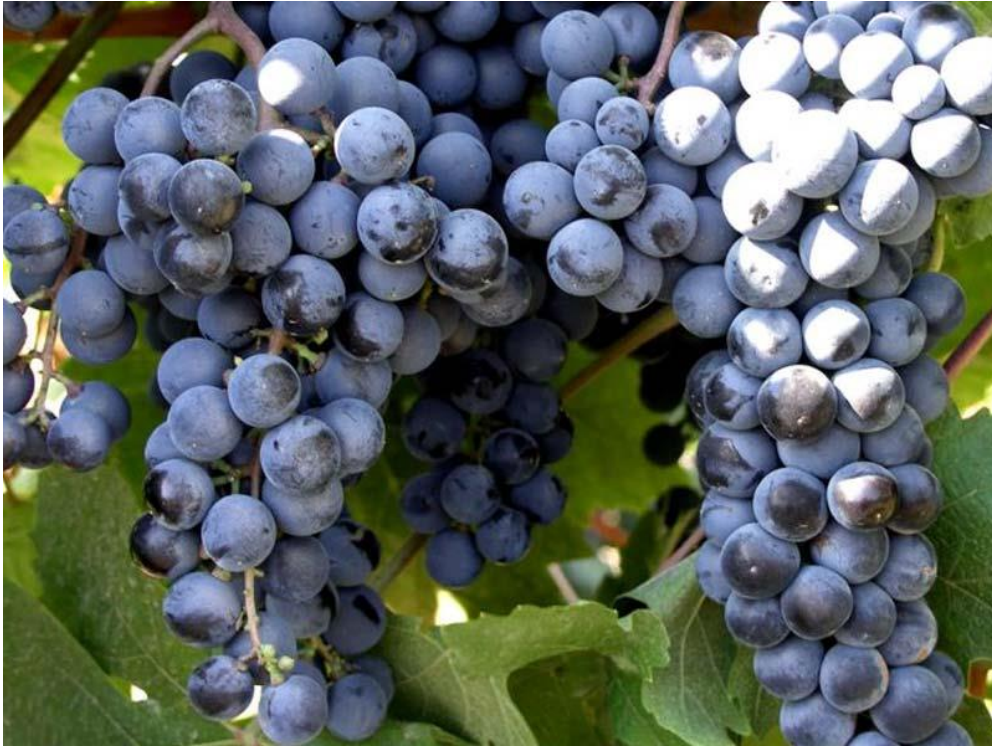
Slika 2. Sorta Muškato Hamburg

Važna stvar oko određivanja aromatske komponente jest i OAV ( Odour Aroma Value ) prema kojem su određene razlike između tipova Tempranillo vina. Tempranillo Blanco vina iz karbonske maceracije bila su najaromatičnija vina, s OAV vrijednošću 822, naspram 770 kod vina klasične vinifikacije (Ayestarán i sur. 2018.)