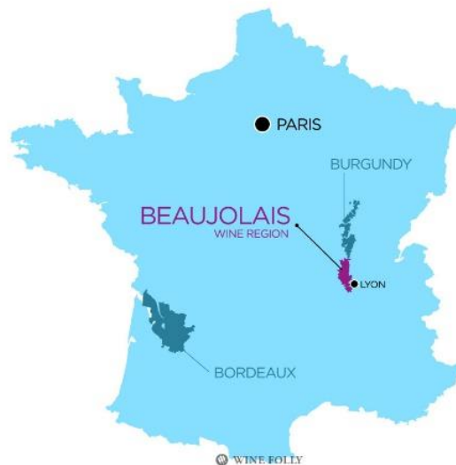
Slika 4. Pokrajina Beaujolais, Francuska

U Španjolskoj se koristi za preradu grožđa Tempranillo koje se zatim koristi u raznim kupažama. Osim u tim trima zemljama, karbonska maceracija provodila se i diljem vinarija Sjeverne i Južne Amerike te u Australiji i Japanu, iako se ni kod jedne od tih zemalja nije zadržala zbog već navedenih razloga, od kojih je najveći velik ekonomski trošak. Ako se ta metoda i koristi, onda se koristi kod manjih frakcija unutar berbe gdje se stvaraju manje količine vina koji se eventualno koriste za kupaže. Osim Beaujolaisa, Tesnier i Flanzly (2011.) navode da interes u Francuskoj za karbonskom maceracijom raste i u pokrajinama Burgundija (Pinot noir) i Champagne.