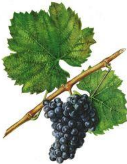
Slika 7. Grožđe sorte Frankovka

Sorta grožđa na kojoj je provedeno istraživanje primjenom karbonske maceracije i klasične vinifikacije u Hrvatskoj je poznata pod nazivom 'Frankovka'. Ona je uobičajena crna sorta kontinentalne Hrvatske, a najviše je zastupljena u Slavoniji, Plešivici i Moslavini, iako je ima i u drugim kontinentalnim podregijama i vinogorjima. Ovisno o položaju, godištu i nizu drugih čimbenika na koje čovjek utječe (berba, tehnologija i dr.) šećer u grožđu varira od 18 do 20%, ukupne kiseline od 8 do 9 g/L a urod od 60 do 80 hl/ha. ( http://vinopedia.hr/wiki/index.php?title=frankovka ).