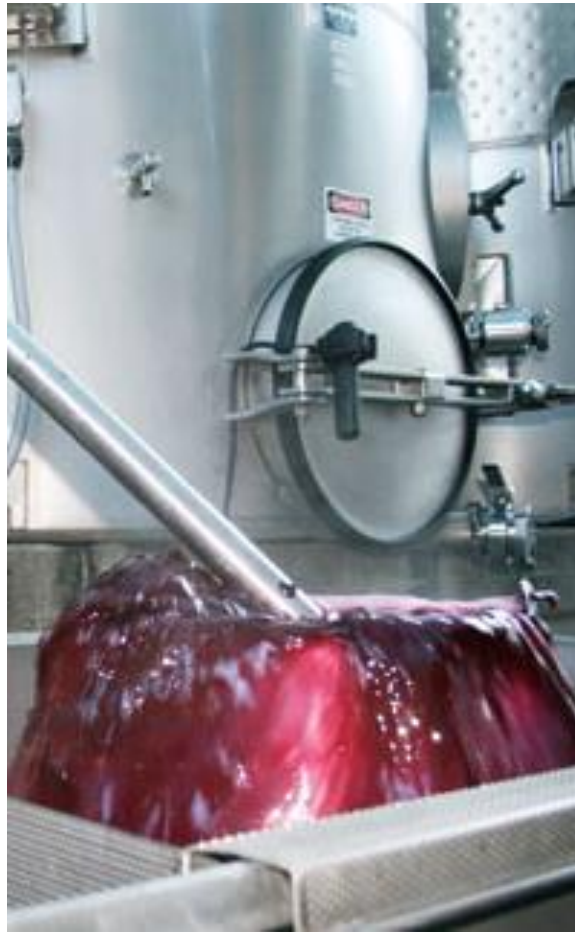
Slika 6. Delestage metoda

Metodom dozrijevanja može se dobiti izuzetno kvalitetno vino, iako je vino iz karbonske maceracije prvenstveno namijenjeno za proizvodnju mladih, svježih crnih vina.