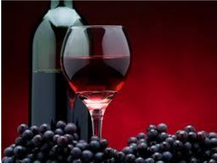
Slika 1. Crno vino

Cilj ovog istraživanja bilo je utvrditi razlike među mladim crnim vinima sorte 'Frankovka' proizvedenih klasičnom metodom proizvodnje crnih vina, sa i bez malolaktične fermentacije te karbonskom maceracijom. Početna hipoteza samog istraživanja bila je da će vino proizvedeno metodom karbonske maceracije imati izraženiji voćni aromatski karakter u odnosu na kontrolu proizvedenu klasičnom vinifikacijom kao i manje intenzivnom bojom.