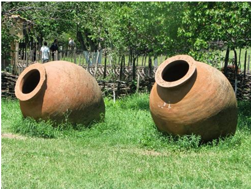
Slika 5. Kvevri

Karbonska maceracija tradicionalno se provodi u zemljama gdje je najviše zastupljena te nije došlo do potpunog razvoja neke nove slične metode u svijetu. Iako nema novih razvijenih metoda, razvile su se varijacije klasične metode poznate u svijetu kao „sub“-karbonska maceracija. Kod radova Tesniera i Flanzya (2011.) spomenuto je da je u Gruziji kod ove metode specifično što se ona ne provodi u inoks tankovima već se proizvodi u „kvevrima“ koji su specifični za gruzijsko vinarstvo. Kvevri su oblik amfora koje se pune s grožđem i hermetički zatvara te ukopava duboko u zemlju gdje se zatim provodi karbonska maceracija. Najpoznatije redefinicije ove metode jesu produžena maceracija nakon što je završila fermentacija samotoka na dnu tanka, pretok samotoka nastalog iz karbonske maceracije te zamjena tog toka sa svježim moštom nastalim muljanjem i runjanjem iste sorte.