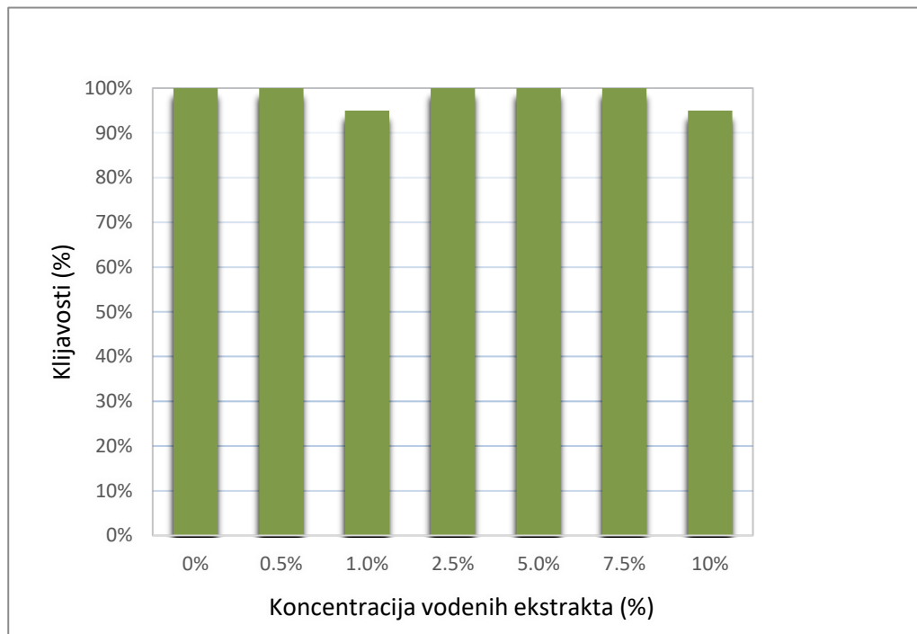
Grafikon 4.1.1. Utjecaj različitih koncentracija vodenog ekstrakta pokrovnih biljaka na klijavost sjemena soje

U grafikonu 4.1.1. prikazan je utjecaj različitih koncentracija vodenog ekstrakta pokrovnih biljaka na klijavost sjemena soje.