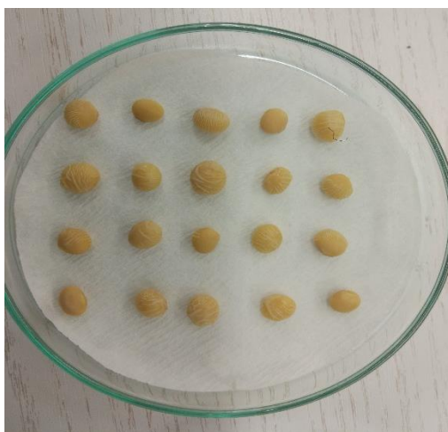
Slika 3.2.1. Posijano sjeme soje

Prije sjetve je sjeme soje površinski sterilizirano uranjanjem u 4 %-tnu otopinu natrijevog hipoklorita (NaOCl) u trajanju od pet minuta, a zatim nekoliko puta isprano destiliranom vodom.. Sjeme je potom pincetom položeno na filter papir postavljen u sterilne Petrijeve zdjelice promjera 100 mm. U svaku Petrijevu zdjelicu položeno je po 20 sjemenki soje i dodano 10 ml vodenog ekstrakta svake koncentracije (Slika 3.2.1). Na kontrolnom tretmanu je dodana ista količina (10 ml) destilirane vode. Svaka istraživana koncentracija postavljena je u 4 repeticije. Nakon sjetve soje, svaka Petrijeva zdjelica zatvorena je parafilmom radi sprječavanja isparavanja tekućine iz zdjelice. Posijane sjemenke u Petrijevim zdjelicama čuvane su na sobnoj temperaturi.