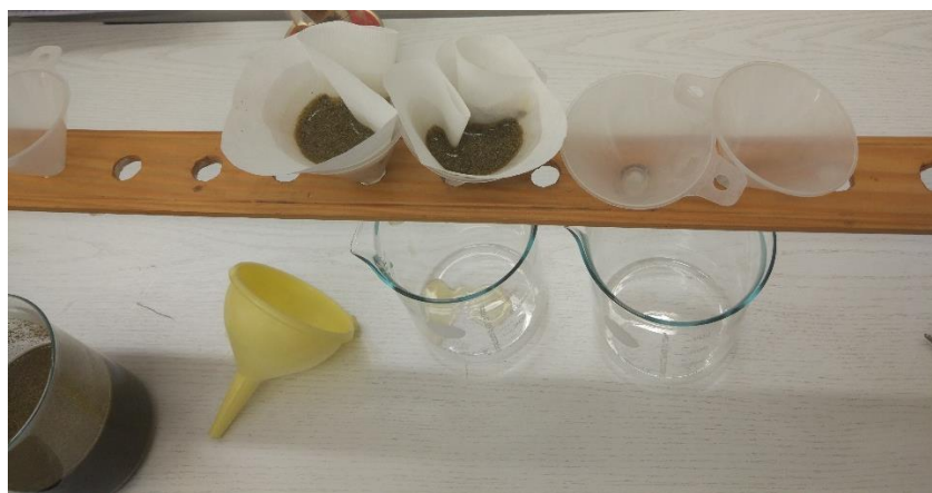
Slika 3.1.1. Filtriranje smjese pokrovnih biljaka

Svježa nadzemna masa pokrovnih biljaka osušena je u sušioniku na 70 °C u trajanju od 72 sata, nakon čega je usitnjena pomoću električnog mlina. Smjesa je pripremljena potapanjem suhe biljne mase u destiliranu vodu u omjeru 100 g suhe biljne mase na 1 litru destilirane vode (1:10). Dobivena smjesa ostavljena je 24 sata na sobnoj temperaturi, nakon čega je filtrirana kroz dvostruki filter papir kako bi se uklonile čestice većih dimenzija (slika 3.1.1.).