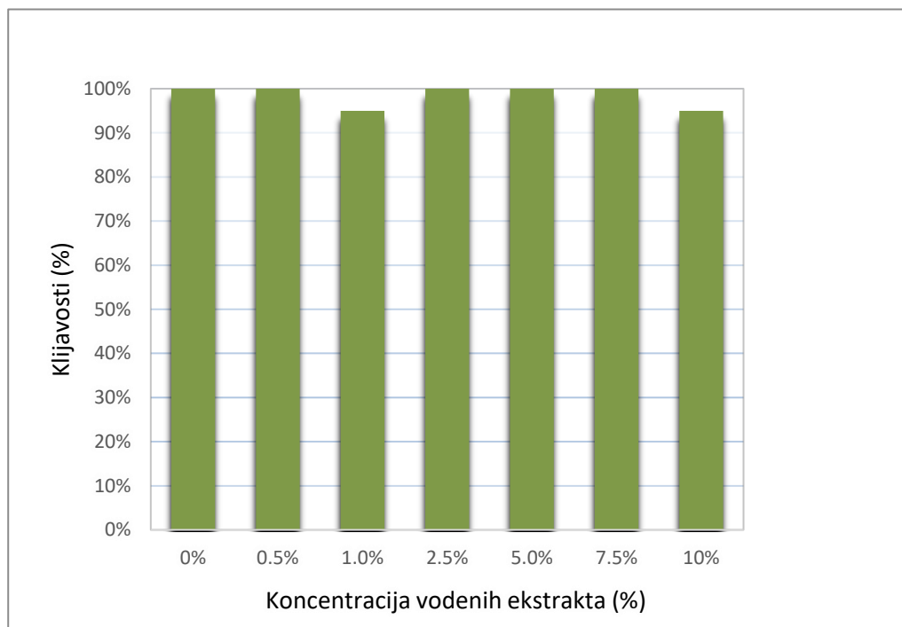
Grafikon 4.1.1. Utjecaj različitih koncentracija vodenog ekstrakta pokrovnih biljaka na klijavost sjemena soje

U grafikonu 4.1.1. prikazan je utjecaj različitih koncentracija vodenog ekstrakta pokrovnih biljaka na klijavost sjemena soje.