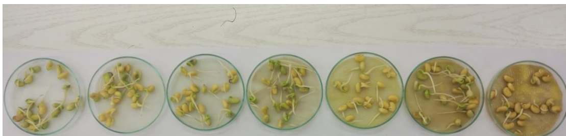
Slika 4.1.1. Utjecaj različitih koncentracija vodenog ekstrakta pokrovnih biljaka na klijavost sjemena soje (s desna na lijevo: 0; 0,5; 1,0; 2,5; 5,0; 7,5; 10 %)

Iz grafikona je vidljivo da ni jedna istraživana koncentracija vodenog ekstrakta pokrovnih biljaka nije utjecala na klijavost u usporedbi s kontrolom. Također, nije dokazana statistički značajna razlika između istraživanih koncentracija. Na kontrolnom tretmanu utvrđena je 100 %-tna klijavost soje, kao i pri koncentracijama od 0,5; 2,5; 5,0 i 7,5 % (Slika 4.1.1.).