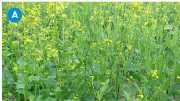
Slika 2.1.1. Smeđa gorušica ( Brassica juncea )

Biljne vrste kao što su smeđa gorušica (slika 2.1.1.), rukola (slika 2.1.2.), rotkvica (slika 2.1.3.), bijela gorušica (slika 2.1.4.), brokula, cvjetača, uljana repica i hren sadrže organsku tvar koja se naziva glukozinolat (GSL). Nakon što se tkivo biljaka tijekom žetve ošteti, dolazi do otpuštanja biološki aktivnih kemijskih spojeva među kojima je najvažniji ITC. Ono što gorušici i hrenu daje ljutkast i gorak okus je upravo taj kemijski spoj. U niskim količinama ITC nije štetan za ljudsko zdravlje. U visokim količinama ITC dobiva biocidno djelovanje, a otrovnost se može usporediti s uobičajenim pesticidima. Neki komercijalni pesticidi kao što su Dazomet, Vapam i Vorlex sadrže aktivnu tvar koja je slična ITC-u (Srivastava i Ghatak, 2017).