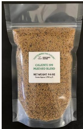
Slika 2.1.5. Sjeme gorušice za biofumigaciju Caliente 199™