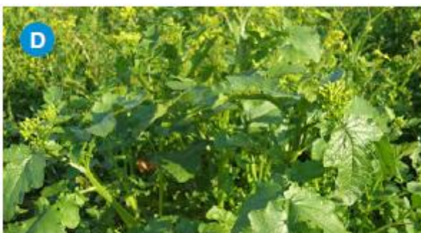
2.1.4. Bijela gorušica ( Sinapis alba )