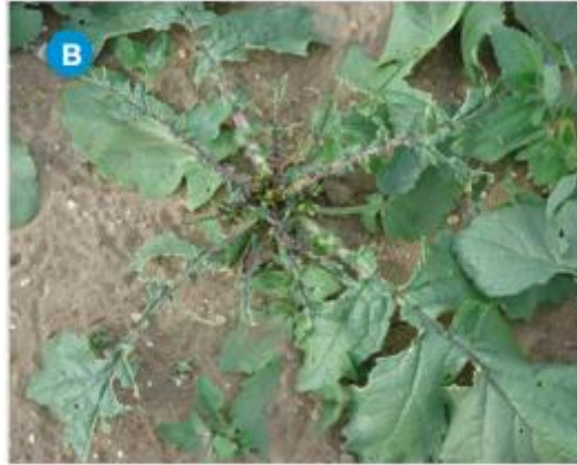
Slika 2.2.2. Štete od goluba na rotkvici ( Raphanus sativus )