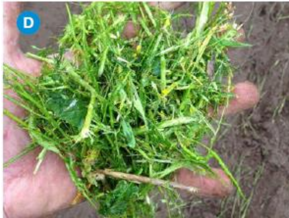
Slika 3.4.1. Kvalitetna i svježa macerirana biomasa kupusnjača