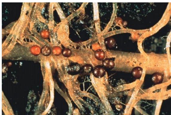
Slika 4.1.1. Ciste zlatne krumpirove cistolike nematode ( Globodera rostochiensis ) na korijenu krumpira