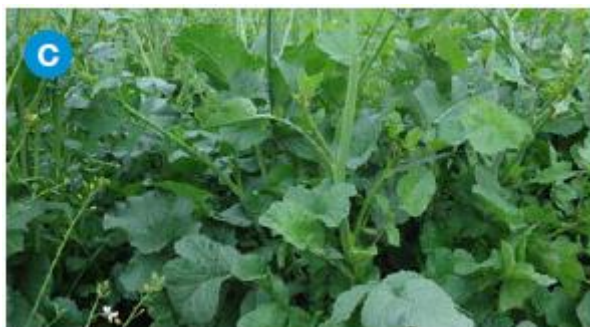
2.1.3. Rotkvica ( Raphanus sativus )