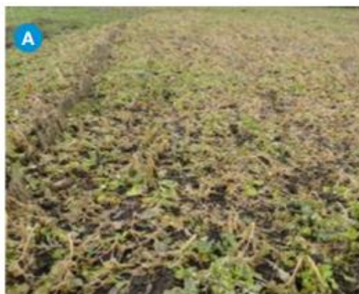
Slika 2.2.1. Štete od mraza na gorušici ( Brassica juncea )

Kao i svaki drugi usjev, biofumiganti su podložni oštećenjima abiotskih i biotskih čimbenika. Trebalo bi izbjegavati rotaciju usjeva u kojoj su biofumiganti jedni blizu drugih, a posebno izbjegavati da su usjevi uz uljanu repicu. Mraz (slika 2.2.1.) i golubovi (slika 2.2.2.) mogu napraviti velika oštećenja. Kao zaštita od golubova usjev se može prekriti, no to rezultira smanjenom lisnom masom, kašnjenjem usjeva i starenjem biljaka što onemogućava kompeticiju usjeva s korovima (Back i Watts, 2017). Štete čine buhači u početnoj fazi razvoja gorušice (Agroklub, 2014) i ličinka kupusne muhe u cvatnji koja se hrani vratom korijena kupusnjača (slika 2.2.3.), a uz nju se mogu pojaviti i neke gljivične bolesti. Kupusnjače su domaćini bolestima kao što su Sclerotinia sclerotiorum ((Lib.) de Bary, 1884) koja uzrokuje bijelu plijesan i može kasnije stvarati probleme u krumpiru te Plasmodiophora brassicae (Woronin, 1877) koja uzrokuje kvržičavost korijena kupusnjača (slika 2.2.4.). Kvržičavost korijena uzrokuje malformacije korijena kupusnjača te time smanjuje prinos i tržišnu vrijednost usjeva (Srivastava i Ghatak, 2017). Rješenje bi moglo biti sjetva sortimenta otpornog na uzročnika kvržičavosti korijena. Neke sorte uljane repice su otporne dok većina sorata gorušice i rotkvice nije (Back i Watts, 2017).