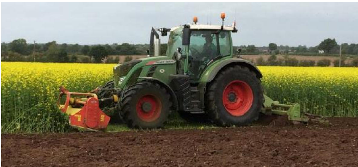
Slika 2.1. Maceracija i inkorporacija smeđe gorušice u tlo