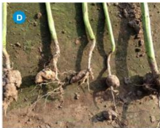
Slika 2.2.4. Kvržičavost korijena na gorušici ( Brassica juncea )