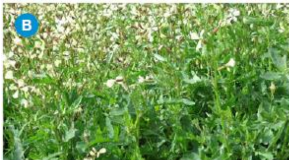
Slika 2.1.2. Rukola ( Eruca sativa )