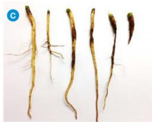
Slika 2.2.3. Štete od ličinke kupusne muhe na gorušici ( Brassica juncea )