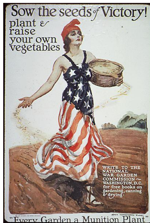
Slika 2. Oglas za vrtove pobjede u SAD-u tijekom Prvog svjetskog rata

U SAD-u, europski doseljenici donose svoje navike, a s time želju za stvaranjem vlastitih vrtova. Pod utjecajem vlade početkom 20. stoljeća, građani SAD-a sve više počinju stvarati gradske vrtove kako bi preživjeli. Ti „ratni vrtovi“ igrali su važnu ulogu u pobjedi Prvog i Drugog svjetskog rata. Ti vrtovi, kasnije nazvani „vrtovi pobjede“ učinili su vrtlarstvo i gradsku poljoprivredu domoljubnom djelatnošću, a vrtlarenje uveli kao aktivnost za sve, a ne samo za siromašne građane.