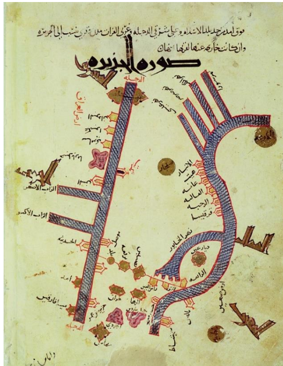
Slika 1. Mapa rijeka Eufkrat i Tigris, 10. stoljeće

Poljoprivreda kao važan element svakodnevnog gradskog života datira još od početaka gradske civilizacije u Egiptu, Kini i Perziji. Pronađeni zapisi pokazuju kako su parcele za poljoprivredni uzgoj bile ucrtane unutar gradova na rijekama Eufkrat i Tigris, prije 4000 godina (Smit et al., 2001).