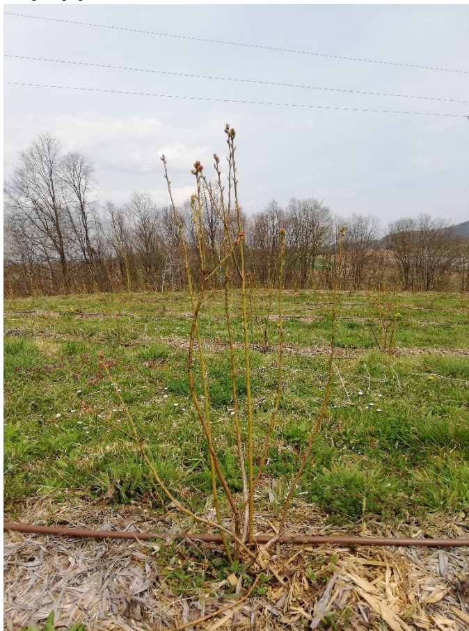
Slika 3. Sorta Bluecrop

Biljka je uspravnog rasta, jednogodišnji izboj je zelen, a internodij na njemu kratak (Slika 3). Obojanost antocijanom cvjetnog pupoljka je jaka. Vjenčić cvijeta je malen, cilindričan, a obojanost antocijanom u unutrašnjosti vjenčića je jaka, dok je vidljivost nabora na vjenčiću slaba ili je nema. Promjer i dubina čašice cvijeta su srednji. Ima rijetke grozdove i srednju jačinu intenziteta zelene boje nezrelog ploda. Voštana prevlaka jakog je intenziteta, a nakon njenog nestajanja plod je srednje plave boje. Uzdužni presjek ploda je kružni, plod je velik, a omjer visine i širine ploda velik. Lapovi na plodu su uspravni i ravni. List je srednje dug i širok, a omjer duljine i širine lista srednji. List je oblikom jajolik, rubovi su cijeli, naličje lista svijetlozelene boje i srednje sjajno.