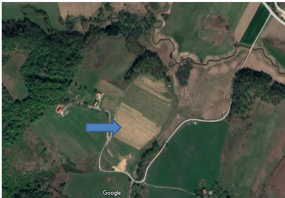
Slika 1. Prikaz nasada borovnica u Cetingradu

Istraživanje fenologije i morfologije borovnice provedeno je u Cetingradu, mjestu u središnjoj Hrvatskoj koje se nalazi na području Karlovačke županije, u predjelu Kuk (45°09'47.7"N 15°42'45.0"E) (Slika 1.). Gospodarstvo je osnovano u srpnju 2016., a najesen iste godine je podignuto oko 8.000 sadnica američke borovnice za uzgoj i pokusni nasad s 10 različitih sorata. Na površini od 3,5 ha u uzgoju su prisutne 4 sorte: Chandler, Duke, Bluecrop i Nelson. U pokusnom dijelu nalazi se 10 sorata, od svake po 10 biljaka: Elizabeth, Spartan, Lateblue, Darrow, Patriot, Bonus, Herbert, Toro, Bluejay i Ivanhoe. U periodu od ožujka do srpnja 2019. godine istraživane su i praćene morfološke karakteristike i fenološke faze ukupno 14 sorata američke borovnice u razdoblju od kretanja vegetacije do berbe. Odabrano je i praćeno po 10 biljaka od svake sorte.