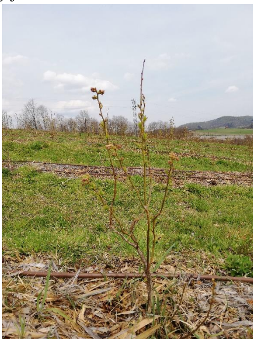
Slika 4. Sorta Duke

Biljka je uspravnog rasta, jednogodišnji izboj je zeleno-crvene boje, a internodij na njemu kratak (Slika 4). Obojanost cvjetnog pupoljka antocijanom je slaba. Cvjetni vjenčić je velik, cilindričan, a obojanost antocijanom u unutrašnjosti vjenčića je slaba, dok su nabori na vjenčiću srednje vidljivi. Promjer čašice cvijeta je srednji, a dubina plitka. Ima rijetke grozdove, a nezreo plod je srednje zelene boje. Voštana prevlaka jakog je intenziteta, a nakon njenog nestajanja plod je srednje plave boje. U uzdužnom presjeku plod je spljošten na polovima, plod je velik, kao i omjer visine i širine ploda. Lapovi na plodu su uspravni i ravni. List je dugačak, srednje širok, a omjer duljine i širine lista srednji. List je oblikom jajolik, rubovi su cijeli, naličje lista srednje zelene boje i sjajno.