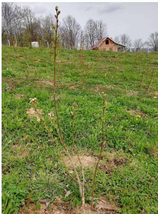
Slika 7. Sorta Spartan