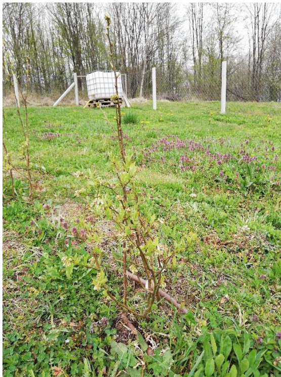
Slika 5. Sorta Ivanhoe

Biljka raste uspravno, jednogodišnji izboj je zeleno-crvene boje, a internodij na njemu kratak (Slika 5). Obojanost cvjetnog pupoljka antocijanom je srednja. Cvjetni vjenčić je vrlo malen, cilindričan, a obojanost antocijanom u unutrašnjosti vjenčića vrlo slaba ili je nema, dok je vidljivost nabora na vjenčiću srednja. Promjer čašice cvijeta je srednji, a dubina plitka. Grozdovi su rijetki, a nezreo plod je srednje zelene boje. Voštana prevlaka jakog je intenziteta, a nakon njenog nestajanja plod je svijetloplave boje. U uzdužnom presjeku plod je spljošten na polovima, srednje je veličine, a omjer visine i širine ploda srednji. Lapovi na plodu su uspravni, a u nagibu savinuti. List je srednje duljine i širine, pa tako i njihov omjer. List je oblikom eliptičan, rubovi su cijeli, naličje lista tamnoz zelene boje i srednje sjajan.