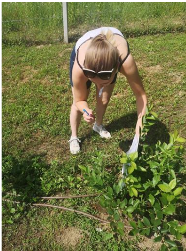
Slika 2. Praćenje morfoloških karakteristika i fenoloških faza borovnica

Fenologija sorata praćena je prema BBCH (Biologische Bundesanstalt, Bundessortenamt und Chemische Industrie) skali (AgVita Analytical 2008., Prilog 1) . Pomoću BBCH skale praćene su fenološke promjene od otvaranja prvih listova, pojave i bubrenja cvjetnih pupova, faze otvaranja cvjetova, faze cvatnje, nastajanje, rast i razvoj plodova, pa sve do potpuno zrelih plodova spremnih za branje. Promatralo se vegetativne i generativne fenofaze biljaka borovnice od početka vegetacije do berbe. Praćenje morfoloških karakteristika i fenoloških faza prikazano je na slici 2.