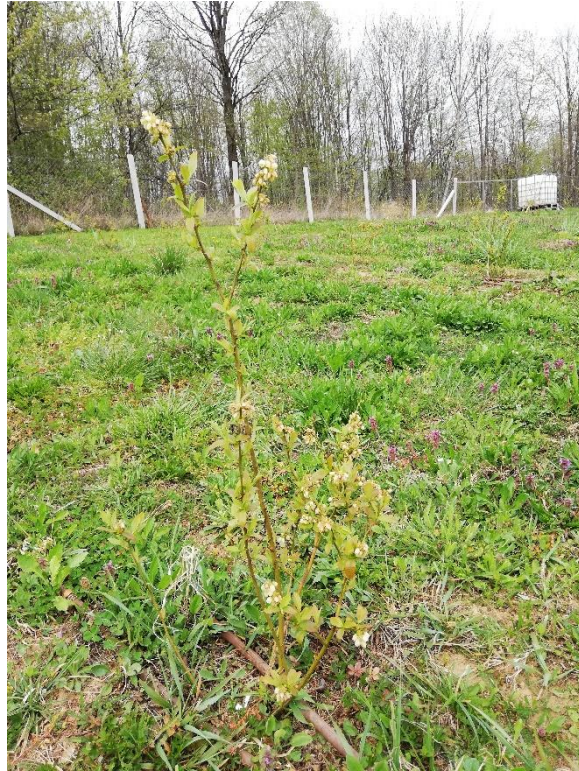
Slika 6. Sorta Patriot